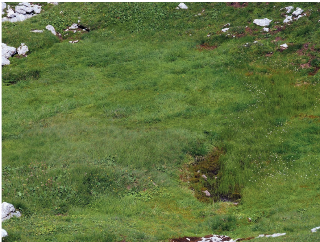
Slika 4: Prodi pod Mangartom, mokrišče ob izviru. Figure 4: Prodi below Mangart, wetland at spring.