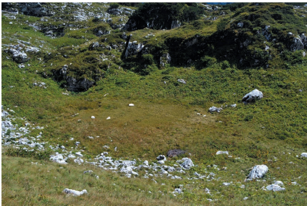
Slika 5: Spodnji Lepoč nad dolino Bale. Figure 5: Spodnji Lepoč above the Bala valley.