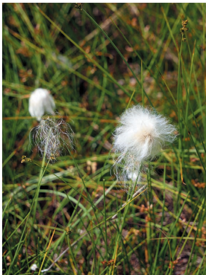
Slika 9 a: Rjavkasti šaš ( Carex brunnescens ) v združbi s Scheuchzerjevim muncem ( Eriophorum scheuchzeri ) na planini Na Kalu.

Figure 8: Wetland (fen) on the alp Na Kalu, Zgornja Komna (Upper Komna plateau).