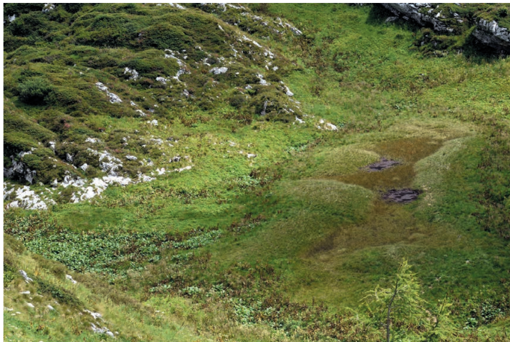
Slika 6: Veliki Razor – Zgornji Lepoč (Lašte) pod Morežem. Figure 6: Veliki Razor – Zgornji Lepoč (Lašte) below Morež.