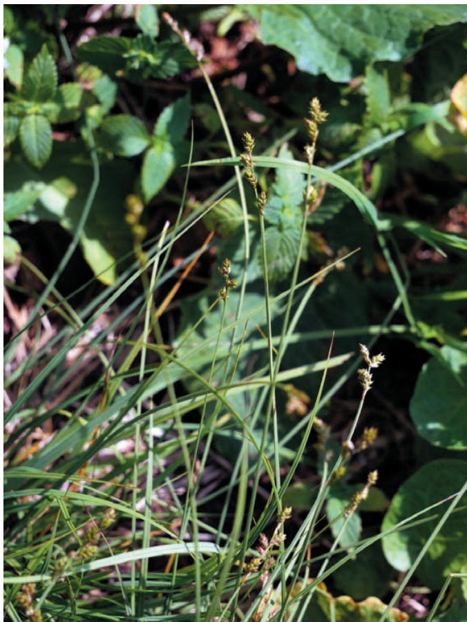
Slika 9 b: Rjavkasti šaš ( Carex brunnescens ) na planini Na Kalu. Figure 9 b: Carex brunnescens on the alp Na Kalu.