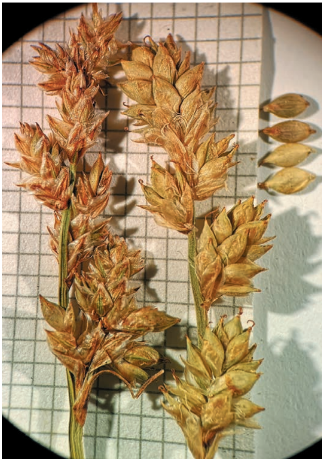
Slika 2: Klaski vrste Carex canescens – desno (Spodnji Lepoč) ter klaski vrste C. brunnescens – levo (pl. Na Kalu). Figure 2: Spikelet of Carex canescens – right (Spodnji Lepoč) and spikelet of C. brunnescens – left (alp Na Kalu).