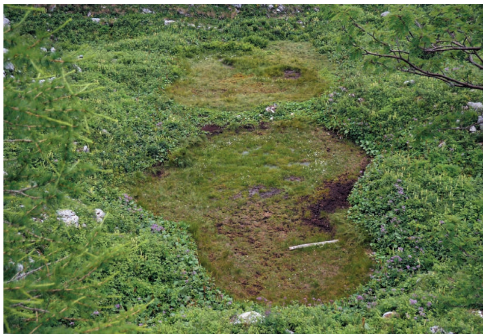
Slika 8: Mokrišče (nizko barje) na Pl. Na Kalu, Zgornja Komna.

Figure 8: Wetland (fen) on the alp Na Kalu, Zgornja Komna (Upper Komna plateau).