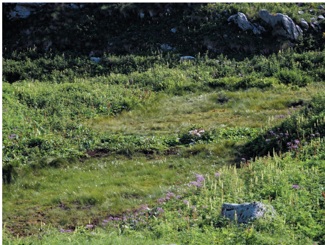
Slika 7: Pl. Na Kalu (Na Kolu), Zgornja Komna. Figure 7: Alp Na Kalu, Zgornja Komna (Upper Komna plateau).