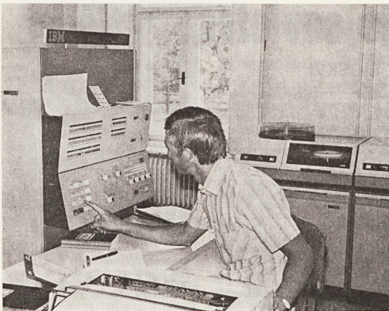
Iz našega centra za avtomatsko obdelavo podatkov