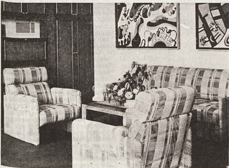
Ena izmed izvedb sedežne garniture DETEL