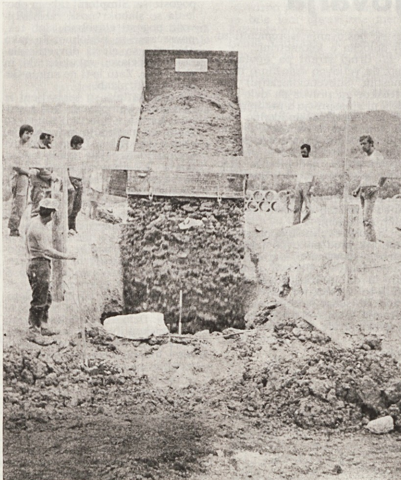
Zemeljska dela za tovarno ivernih plošč so v polnem teku