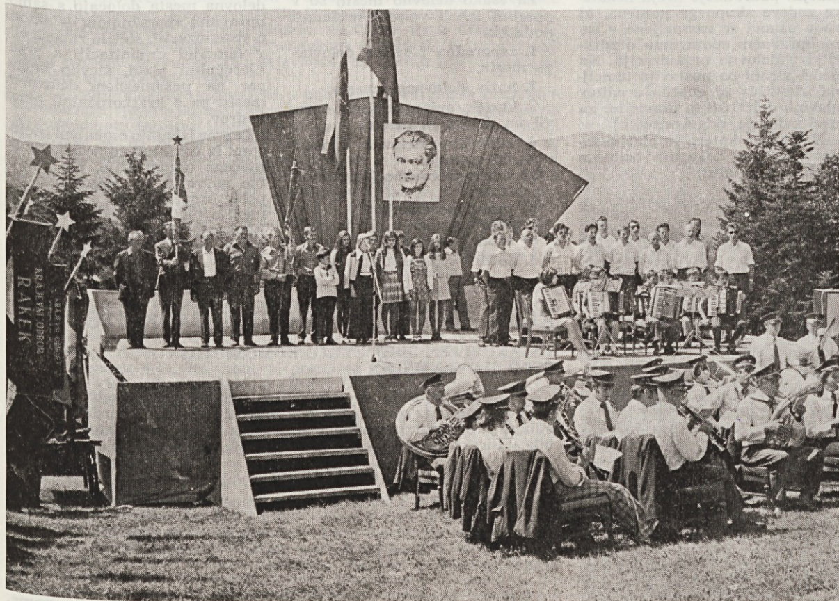
Z osrednje proslave Dneva vstaje. Več na 7. strani

Področje nabave je bilo v preteklem obdobju letošnjega leta prav gotovo problematično. Na to vplivajo valutne spremembe