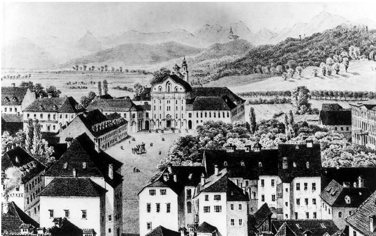
Uršulinski samostan v Ljubljani v 18. stoletju