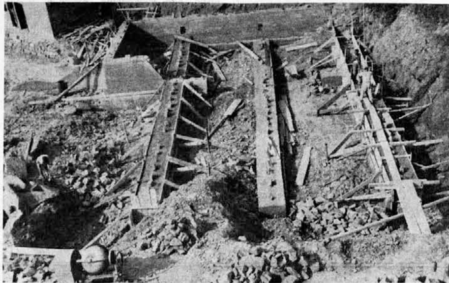
MARIJIN DOM V ROJANU JE V GRADNJI

Avtonomni zavod za ljudske hiše je zadnja štiri leta sezidal v Trstu, Tržišču in Gradežu 163 hiš s 1619 stanovanji, kar je stalo vsega okoli 4 milijarde lir. Zdaj je v delu 297 hiš s 1896 stanovanji, kar bo zahtevalo nadaljnjih 5 milijard lir izdatkov. Prejšnja štiri leta je bilo sezidanih 8881 prostorov, zdaj pa jih je v delu 9979.