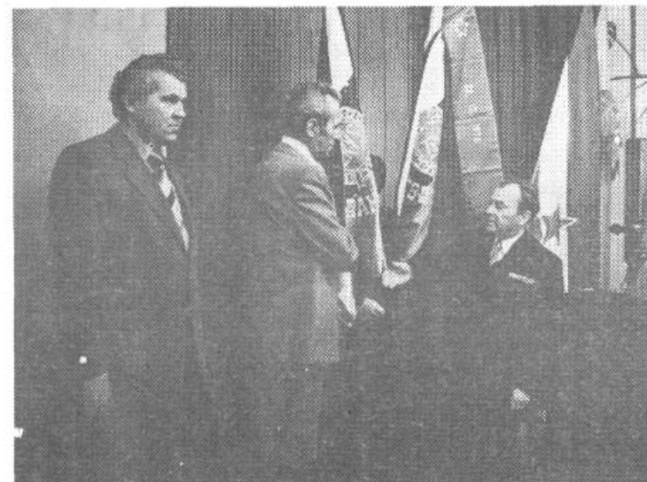
Ob razvitju prapora KO ZRVS Krim-Rudnik

Prapor krajevne organizacije ZRVS pa so ob dnevu JLA razvili tudi v krajevni skupnosti Vič. Slovesnost je bila v osnovni šoli Vič, kjer sta se prav tako srečala in združevala mladostna prešernost in pomembno poslanstvo narodnoosvobodilnega boja in razvoja naših oboroženih sil.