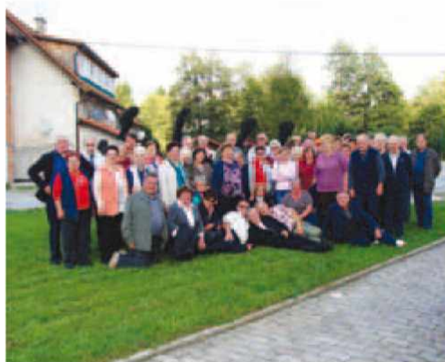
Izlet v deželno medvedov - Kočevje, 19.09.2013

Organizator prireditve je bilo PGD Gornja Bistrica. Pred gasilskim domom so nas sprejeli člani pobratenegega društva in gasilci ter nas pogostili z domačim žganjem. Po kosilu smo bili prisotni pri kurjenju prvomajskega kresa. Ob zvokih harmonike smo zapeli partizanke pesmi in se spominjali praznovanja preteklih prvomajski dogodkov. Ob kresu so postregli z vinom in domačim kruhom, namazanim z zaseko. Ob kulturnem programu in zvokih muzike nas je vseh 26 udeležencev nekaj časa pozabilo na vsakdanje skrbi. Veseli in zadovoljni smo se vrnilo na Goričko.