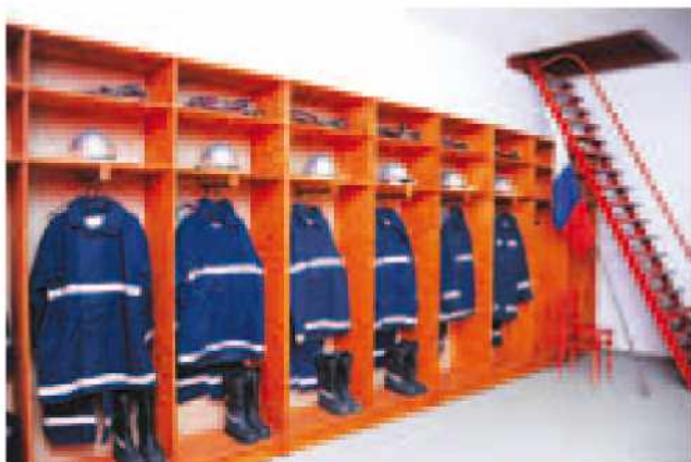
Obnovljeni prostori vaško gasilskega doma Stanjevci.

Za popestritev kulturnega programa je poskrbel Pihalni orkester iz Murske Sobote, pevci in godci iz Gornjih Petrovec »Gorički lájkoši«, s svojimi plesi in petjem pa so se nam predstavili tudi gostje iz Romunije.