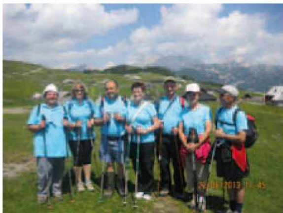
Pogled na vršace