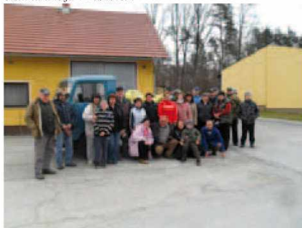
Čistilna akcija v Gornjih Petrovcih