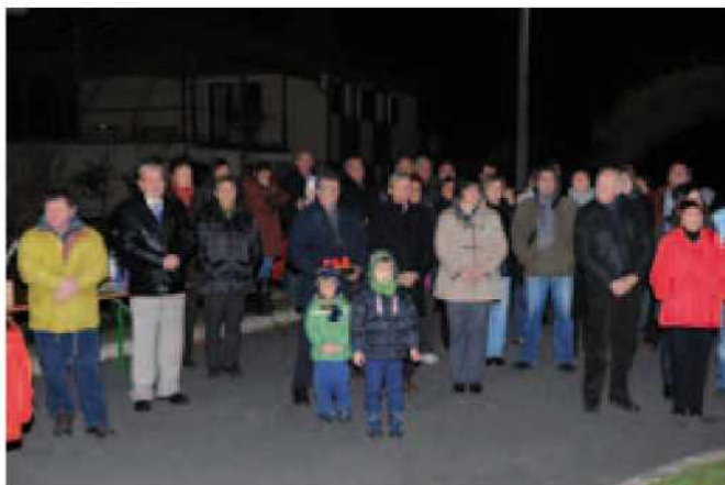
Pod smreko v Gornjih Petrovcih.