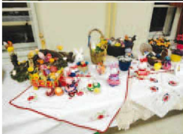
Razstavljena ročna dela.

Markovcih, kar si lahko ogledate na priloženih fotografijah.