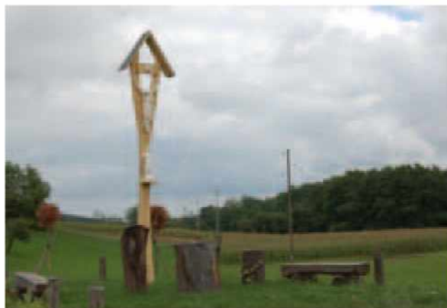
Križ v Lucovi