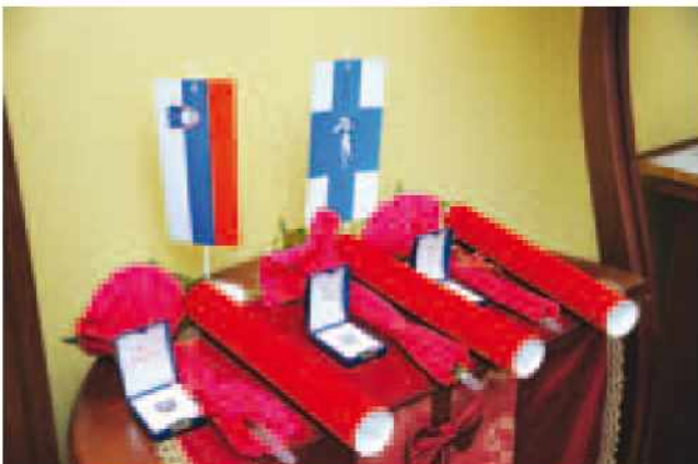
Priznanja Občine Gornji Petrovci za leto 2013