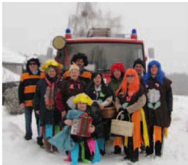
Člani in članice TD Vrtanek na pustnem pohodu po vasi