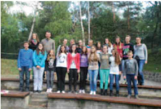
Učenci OŠ Gornji Petrovci vključeni v projekt "Slovenski učni krogi".

Delo poteka v več fazah in je časovno omejeno. V 1. fazi se šole predstavijo (v obliki filma, risanke, slik ali kako drugače), v 2. fazi postavijo raziskovalno vprašanja na dano temo, v 3. fazi raziskujejo in objavljajo rezultate svojih raziskav, v 4. fazi pregleda vsaka šola odgovore na svoje zastavljeno vprašanje in predstavi povzetek raziskave. V zadnji fazi pa se šole še poslovijo z zaključno mislijo, sliko ali čim podobnim.