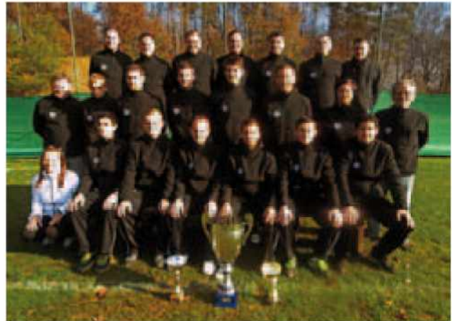
Člani KMN Gornji Petrovci