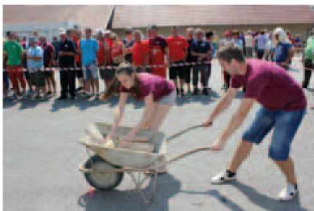
Štrk na raori