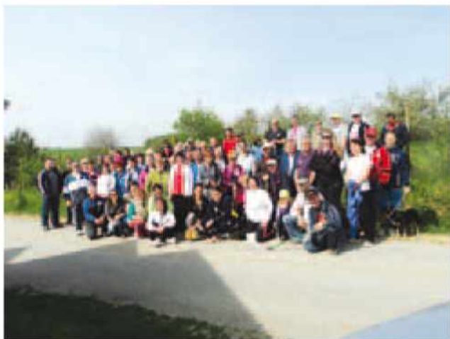
Udeleženci pohoda vaščanov in vikendašev na Kukeču