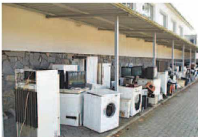
Zbiranje odpadne električne opreme.