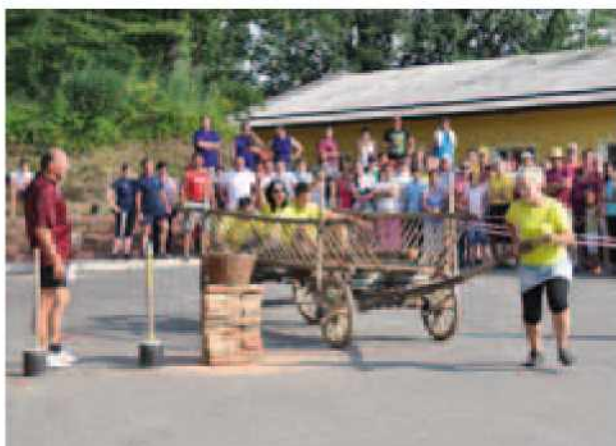
Vleka kmečkega voza