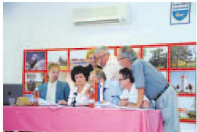
KUD Goričko s skečem: Seja občinskega sveta