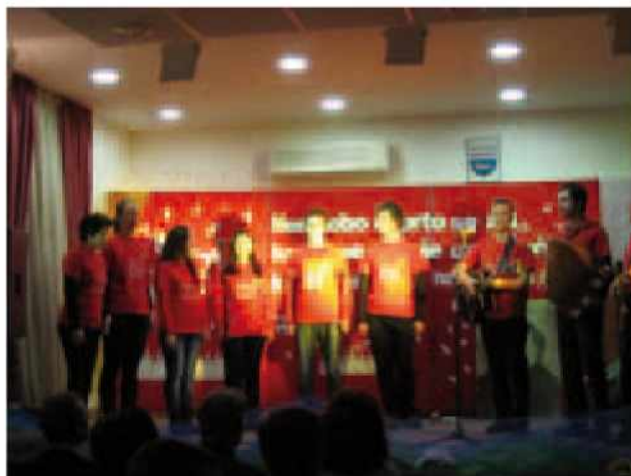
Zgrableni na kvadrat