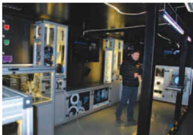
Notranjost vozila e-transformer.

Uredili smo prostor pri kolesarnici za zbiranje starega papirja, baterij ter zamaškov. Omenjene odpadke zbiramo skozi celo leto in jih lahko prinaša-