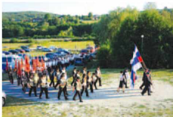
Povorka gasilcev in gostov na osrednji del prireditve.