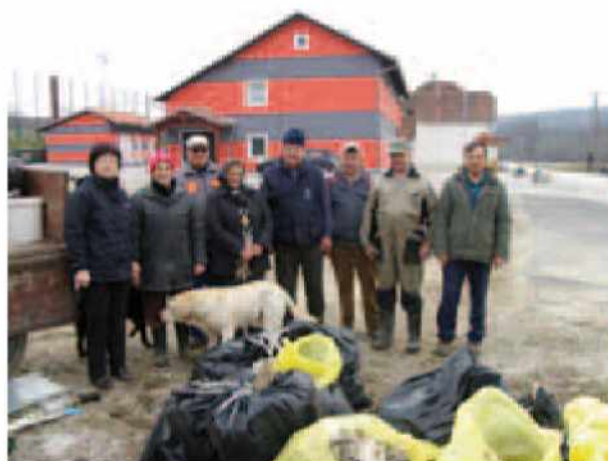
Čistilna akcija v Lucovi

Tudi v drugih vaseh naše občine so se v soboto, 23. marca 2013 odvijale čistilne akcije, kjer so se nekateri občani in občanke, vsako leto so to večinoma isti ljudje, trudili pobrati čim več smeti odvrženih v naravo tekom prejšnjega leta. Čeprav je teh smeti dejansko manj, jih je še vedno preveč. Nekaterim pač ni mar za urejeno okolje in za naravo, ali pa so zgolj škodoželjni in si mislijo: « Saj bodo že drugi bedaki to pobrali na čistilni akciji. Mene že ne bodo videli tam. » Upajmo le, da bo takih iz leta v leto manj, za to pa lahko poskrbimo tudi sami z vzgojo mladih generacij.