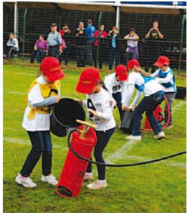
Mladi gasilci PGD Križevci

jo željo po spoznavanju gasilskega življenja, dela, orodij, osnov prve pomoči, orientacije in drugih veščin.