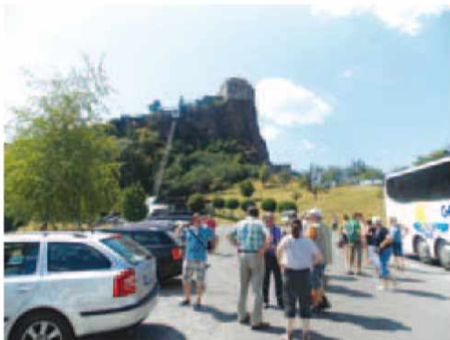
Pod srednjeveškim gradom Riegersburg