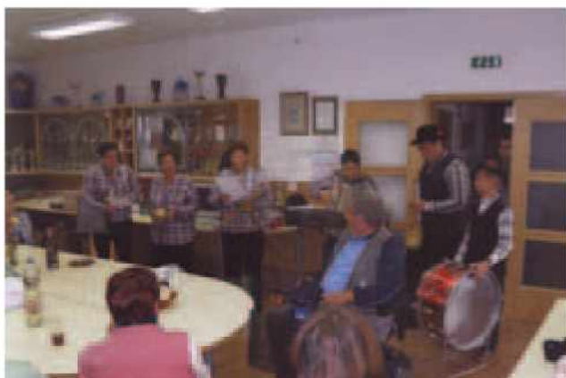
Nastop Ljudskih pevcev in godcev TD Vrtanek v invalidskih delavnicah v Murski Soboti za 80. rojstni dan članice društva invalidov, oktobra 2013

Tudi v letu 2013 smo Ljudski pevci in godci TD Vrtanek aktivno delovali skozi celo leto. Imeli smo številne nastope po Prekmurju, zlasti v domači občini, nastopali pa smo tudi v Izoli v hotelu Delfin. V avgustu smo bili gostje na 9. srečanju Zapojmo in zaigramo na Gorički zemlji. Kljub zavidljivi starosti nekaterih naših članov, smo polni elana, veselja in volje do igranja in upamo, da bomo še vrsto let plodno ustvarjali.