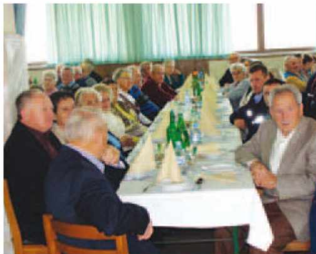
Martinovanje in krst mošta pri pobratenem Društvu upokojencev v Črenšovcih, 16.11.2013