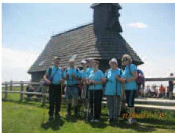
Pri kapelici Marije Snežne