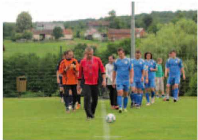
Prihod ekip na igrišče