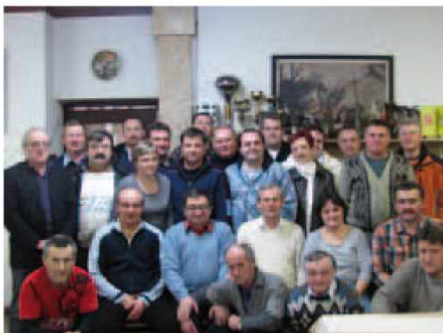
Krvodajalci KORK Ženavlje, 10.01.2013

Krvodajalske akcije naših občank in občanov so se nadaljevale tudi v letošnjem letu. Prvo skupno krvodajalsko akcijo so imeli člani KORK Ženavlje v četrtek, 10.01.2013. Člani KORK Gornji Petrovci in Križevci pa so darovali kri dvakrat in sicer 07.02.2013 in 05.09.2013.