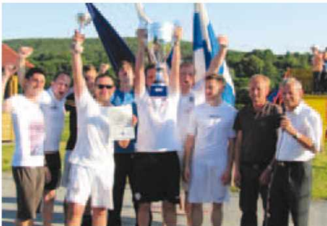
Občinski pokal prvič v rokah KMN Gornji Petrovci