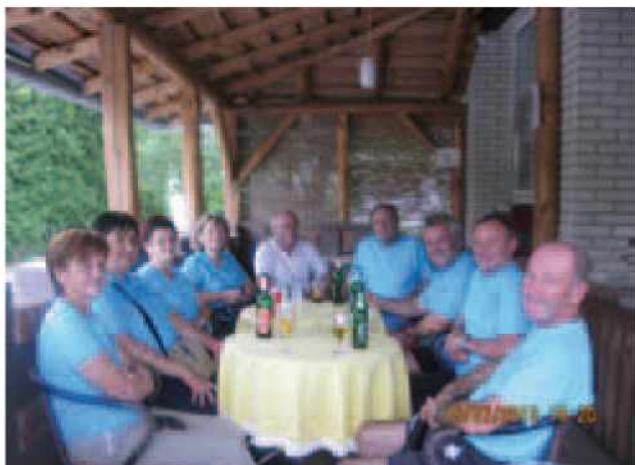
Pri Nemetu v Mačkovcih