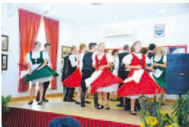
Folklorna skupina iz Romunije

Proslava se je zaključila z družabnim srečanjem in pogostitvijo pod šotorom na športnem igrišču v Stanjevcih.