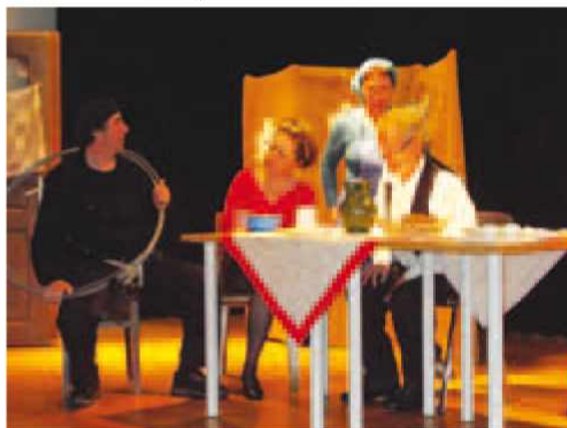
Nastop v Rogašovcih, 10.03.2013

Vsako leto imamo veliko nastopov in tudi v odhajajočem letu je bilo tako. Približno dvakrat