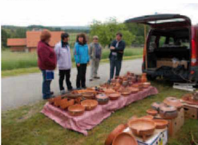
Članice si ogledujejo nepogrešljive lončene izdelke