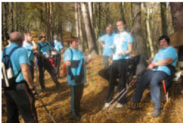
Počitek v gozdu