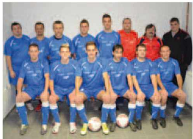
Članska ekipa ŠD Srebrni breg Martinje