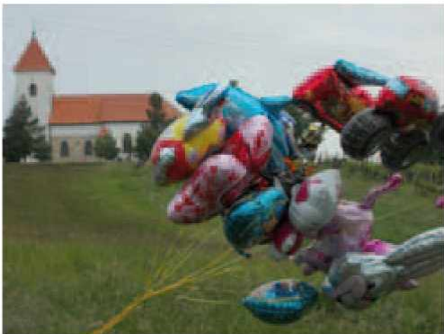
Buča pri Nedeli

Slabo vreme, ki je zajelo naše kraje konec maja, je botrovalo, da se je letošnjega sejma Buča pri Nedeli, v nedeljo, 26.05.2013, udeležilo malo sejmarjev. Tudi obisk je bil v jutranjih urah skromen, ko pa je dopoldan posijalo sonce, so se vaščani odpravili od doma pod Nedelo na tradicionalni sejem, ki ga že 13. zapored organizira domače TD Vrtanek.