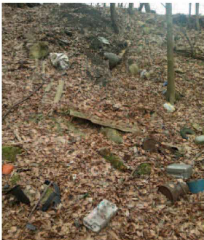
Smeti v naravi namesto v košu za smeti

steklena volna) odvržejo v naravo (običajno v gozd), prav tako povzročajo škodo s svojimi neprimernimi vozili. S sodelovanjem v akciji smo dali svoj prispevek k čistejšemu in zdravemu okolju ter ohranjanju narave. Naša želja pa je, da se tega zave čim širši krog prebivalcev in obiskovalcev naše lepe pokrajine in da podobne akcije v prihodnje ne bodo več potrebne.