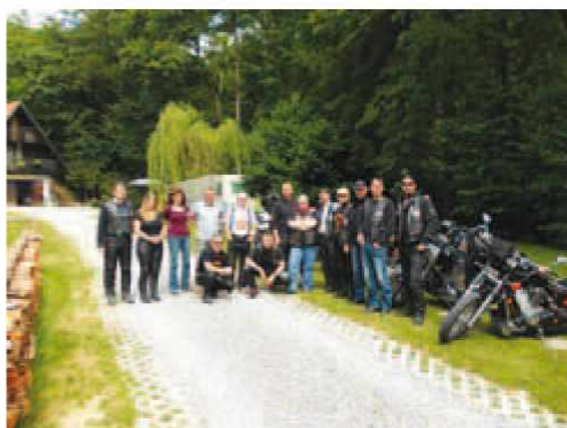
Na obisku v moto kampu v Braslovčah

Postorili smo že veliko tega. Pred časom smo obnovili del strehe ter uredili zunanjo ploščad, ki smo jo tudi zagradili, bolje rečeno zaprli in tako dobili nekakšen motoristični zimski vrt. Pred kratkim pa smo se lotili še obnove podstrešja, ki ga bomo preuredili v pravo »bajkersko« prenočišče. Da se v naših prostorih tudi drugi počutijo dobro, pričajo številni obiskovalci ob najrazličnejših priložnostih. Pri delu pa nam priskočijo na pomoč tudi nečlani kluba in sicer so to naši prijatelji oz. simpatizerji kluba ter seveda domačini, ki so nas že od vsega začetka sprejeli z odprtimi rokami.