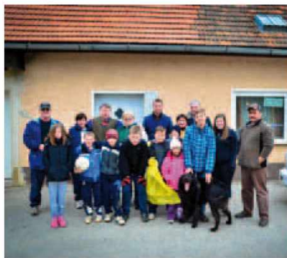
Neradnovčani na čistilni akciji

VO Neradnovci je v skladu z navodili občine Gornji Petrovci organiziral čistilno akcijo dne, 23.3.2013. Sodelovalo je 18 vaščanov od tega 6 šoloobveznih otrok. Z akcijo smo pričeli ob 8.00 uri in končali ob 13.00 uri z malico v gasilskem domu v Neradnovcih. Odpadke smo pobirali in sortirali v barvne vreče, prav tako smo na poseben kup odlagali zbrane kosovne odpadke. Odkrili smo eno večje odlagališče ob cesti Neradnovci - Čepinci, ki se sicer nahaja v KO Čepinci, je pa bližje Neradnovcem. Poleg gradbenih odpadkov (salonitne plošče) in kosovnih odpadkov so tam odvrženi tudi nevarni odpadki - akumulatorji, zato predlagamo sanacijo. Takšnih odlagališč je manj kakor v preteklosti, še vedno pa je veliko odvrženih odpadkov in smeti v naravo iz avtomobilov, sprehodov, kolesarjenja in gobarjenja. Navedeno smo pobrali in odložili na zbirno mesto. Predlagamo, da se prouči možnost nadzora nad pobiranjem odpadkov s strani madžarskih državljanov, ti velikokrat poberejo odpadke od gospodinjstev, nato pa neprimerne (hladilnik,