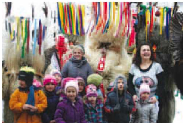
Otroci in kurenti

V vrtcu potekajo še obogatitveni programi: folklor, pevski zbor, tuji jezik - angleščina. Vrtec je do-