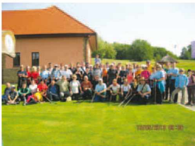
Zbrani pohodniki pred pohodom