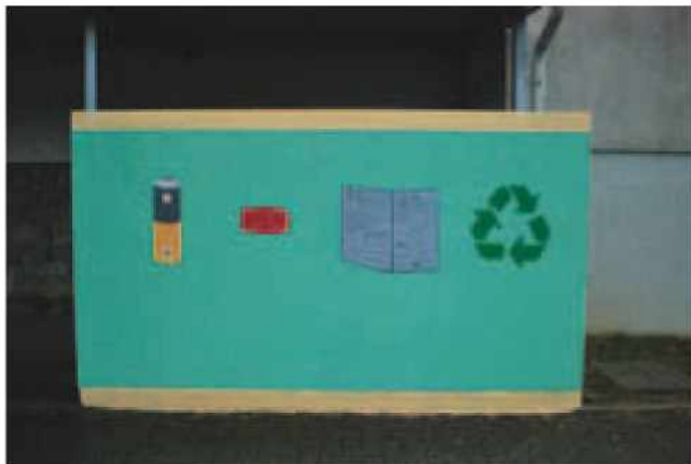
Urejen zunanji prostor za odpadke.

Projekt na naši šoli izvajamo že 12. leto. Namen in cilj Ekošole je razvijati pozitiven odnos do okolja ter zbirati različne vrste odpadkov, ki jih pošiljamo v recikliranje ter ponovno uporabo. V projekt poleg učencev posredno vključujemo tudi starše, v zadnjem letu pa z zbiralnimi akcijami tudi občane celotne občine.