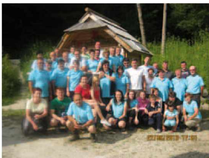
Vsi skupaj v Kamniški Bistrici

nas je markacija usmerila na strmo travnato pobočje, ki se je čez čas položilo in nas pripeljalo do osamljene pastirske koče. Za kočo pot preide v gozd, se začne strmo vzpenjati, čez čas se položi in pripelje do označenega razpotja, kjer smo krenili mimo Jarčjega doma in po petih minutah prisopihali do razglednega travnatega pobočja. Tu smo se posedli po klopcah in občudovali lepote tega prečudovitega planinskega sveta. Vse naokrog po pašnikih se je sprehajala živina in mulila travo, oblito z jutranjo roso. Sonce nas je prijetno grelo in obetal se je lep dan. Razgledi so bili prečudoviti, vse povsod so se bleščale strehe pastirskih koč v jutranjem soncu. Okoliški vršaci so pogumno kazali svoje sive vrhove iznad zelenih smrek, vse