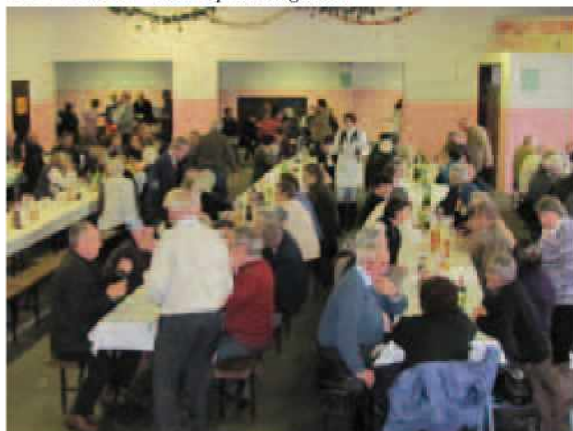
Pogostitev v Križevcih