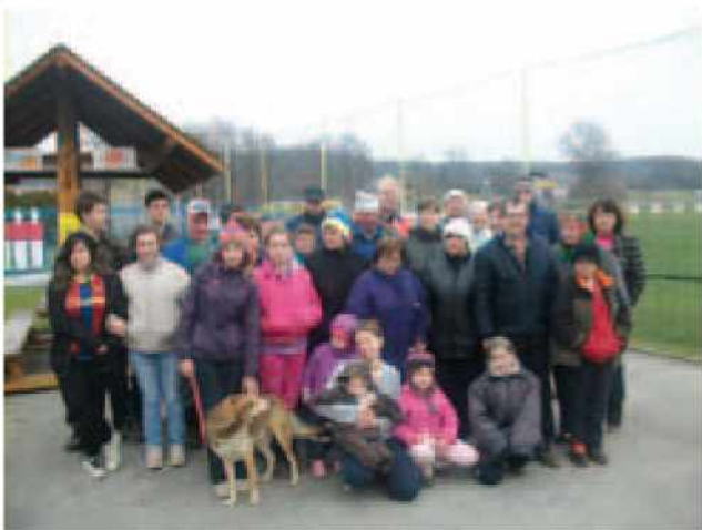
Čistilna akcija v Križevcih