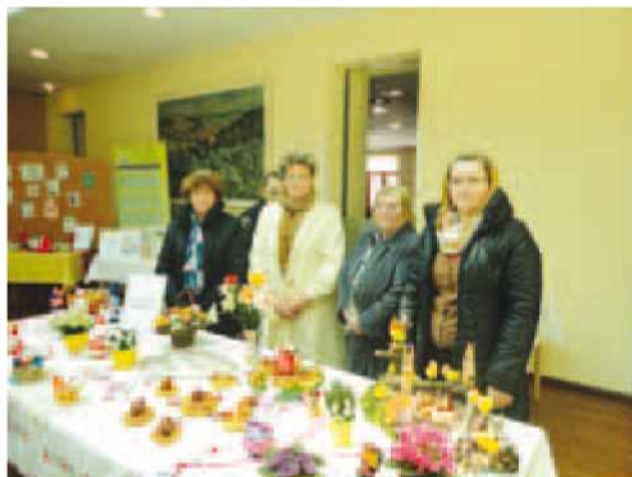
Članice Društva žena Neradnovci na razstavi v hotelu Radin v Radencih.

Članice društva žena Neradnovci smo bile tudi v letu 2013 precej aktivne in ker smo ukaželjne, smo se tudi letos naučile novih tehnik ročnih del. Svoje izdelke smo s ponosom razkazale na velikonočnih razstavah in sicer v Radencih v hotelu Radin in v