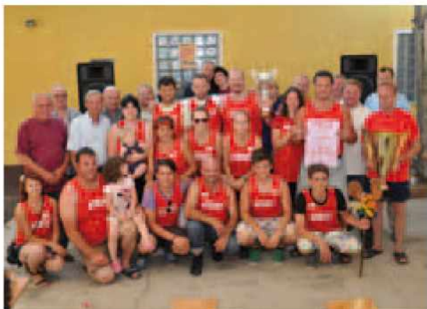
Zmagovalna ekipa vasi Kukeč

Igre so bile težke in naporene, še zlasti ker je bilo ves dan zelo vroče. Podelitev pokalov je bila komaj ob 19.00 uri. Podelitvi pokalov in nagrad je sledila zabava z ansamblom Duo last minute.