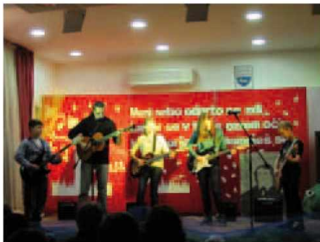
Kitaristi "Prvi prijemi"