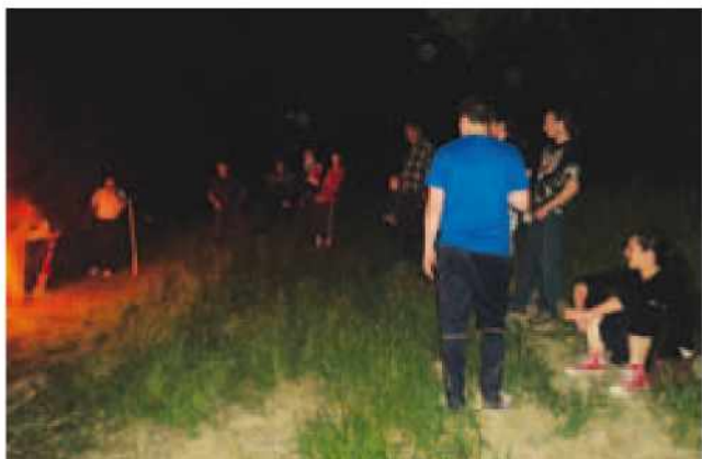
Kres na Kukeču