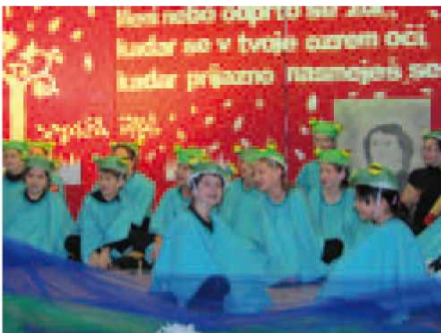
Učenci OŠ Gornji Petrovci v igri: Regarija