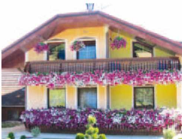
2. najlepši balkon, Jožica Balek, Neradnovci 36