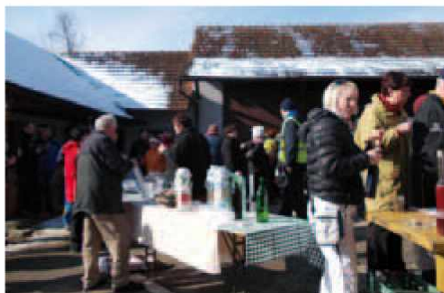
Na kmetiji pri Bagiju