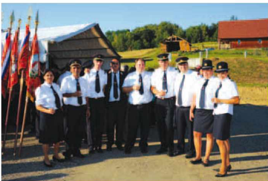
Gasilci in gasilke PGD Martinje na slovesnosti v Stanjevcih