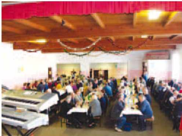
Kostanjev piknik v Križevcih, 20.10.2013

se tudi sprehodili po mestu in si ogledali kočevski pokrajinski muzej. Pot smo nadaljevali do Gotenice v Kočevskem Rogu ter do brezna pod Krenom. Tu smo si ogledali največja raziskana grobišča nasprotnikov komunističnega režima v Sloveniji.