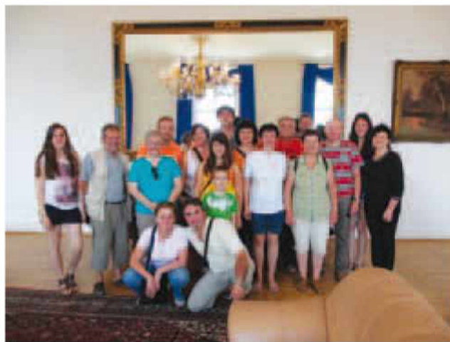
Člani KUD Goričko na radgonskem gradu, 15.06.2013