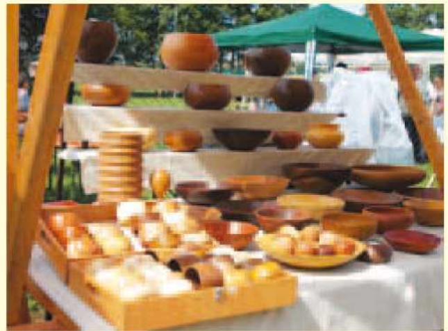
Unikatni leseni dekorativni predmeti in nakit - Ljubomir Zečevič, Vaneča

Na razstavno - prodajnih stojnicah se je ponašalo s svojimi izdelki okrog 20 mojstrov domače obrti kot tudi ponudnikov domačih dobrot. Na voljo so bili kovaški, lončarski, pletarski izdelki, izdelki iz slame, ličja, lesa, voska, lesene igrače, čevlji, tekstilni in kvačkani izdelki, medenjaki ter lect. Izmed domačih dobrot pa krušni izdelki, med, likerji in žganja.