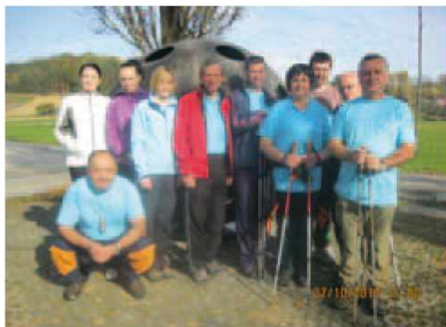
Pri spomeniku v Ženavljah