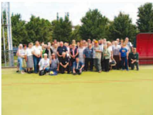
Srečanje pomurskih upokojencev v Moravskih Toplicah

Enodnevni izlet smo izvedli, 13. junija 2013. Potejali smo se po dravski dolini. Pot nas je vodila do Libeličev, vasice ob Avstrijski meji, v kateri je bil leta 1920 podpisan plebiscit. Oglledali smo si tudi muzej in kostnico. Od tu smo se odpeljali do kmetije Klančnik, kjer nas je pričakal gospodar kmetije in nam predstavil družinsko gospodarjenje. Pokusili smo domače divjačinske salame in mošt. Po ogledu kmetije smo se s turističnim vlakcem zapeljali do lovišča hrastnikov gaj. V muzejski hiši smo si ogledali lovske trofeje. Po ogledu smo se zapeljali nazaj do kmetije, se poslovili od prijaznega gospodarja in zapeljali v smeri Črne na Koroškem, do gostišča na Poljani, kjer smo imeli kosilo. Pot smo nadaljevali do turistične vasice Šentanela in naprej do Črne na Koroškem, kjer je rojena naša slavna smučarka Tina Maze. Tukaj smo imeli krajši postanek, se sprehodili po mestu in si ogledali muzej na prostem. Naslednji postanek je bil v Kotljah, ob rimskem vrelcu in pri Iverčkem jezeru. Obiskali smo tudi Slovenj Gradec. Zadnji postanek je bil v Vuzenici, kjer smo si ogledali cerkev in Slomškov muzej, v katerem je zbrana njegova zapuščina iz let 1838 - 1843, ko je služboval v Vuzenici. Polni lepih vtisov z izleta smo se vračali proti domu v poznih večernih urah.