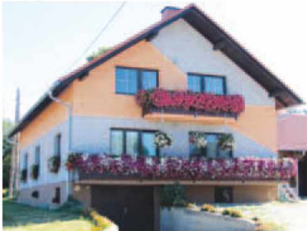
3. najlepši balkon, Zlatica Smodiš, Stanjevci 4