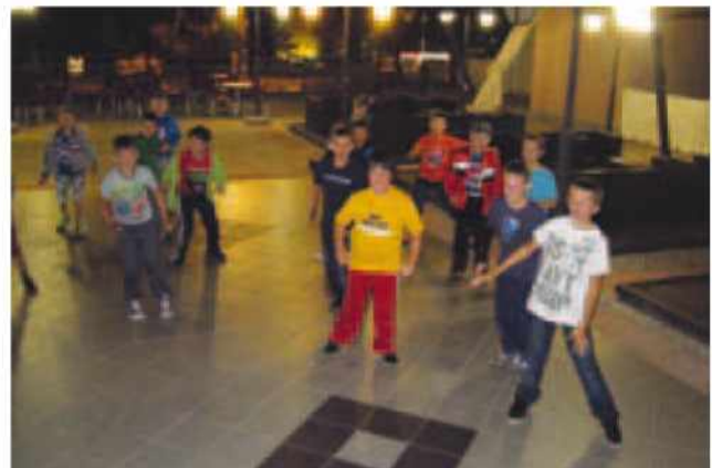
Dečki na plesnem večeru

polne. Sledilo je še zaključno fotografiranje in preden smo se dobro zavedli, smo se že peljali z vlakom proti Gornjim Petrovcem. Čeprav smo prispeli domov zelo utrujeni in z zamudo, se je na naše obraze prikazal velik nasmeh. Veseli smo stopili z vlaka in planili k staršem, bratom, sestram ... Še enkrat smo dokazali, da je povsod lepo, a doma je najlepše.