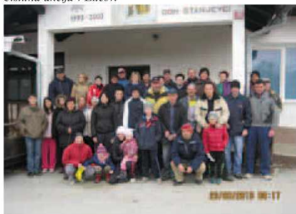
Čistilna akcija v Stanjehcih