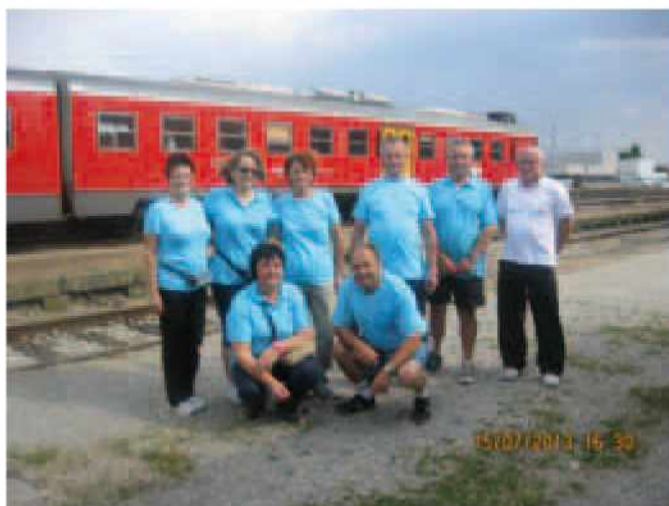
Prihod v Mursko Soboto

Anin pohod nadaljujemo vsak ponedeljek še naprej. Tako smo se tudi zmenili, da gremo na ponedeljkov pohod, 15.7.2013 do železniške postaje v Gornjih Petrovcih in se zapeljemo z vlakom v Mursko Soboto. Zbralo se nas je devet pohodnikov in ob 16 uri smo se, skozi našo vas, peljali proti Murski Soboti. Večina se nas je peljala prvič po tej progi. Na železniški postaji v Murski Soboti smo pri vlaku naredili nekaj posnetkov in se odpravili proti mestu. Med potjo smo si ogledali našo »Goričko Mariško«, ki je sopihala po stari progi od leta 1906 pa do leta 1968, na relaciji Hodoš - Ormož in obratno. Prišli smo pod kovanje pri hotelu Zvezda, ki nas spominjajo na naša mlada leta, se posedli in se osvežili s hladno pijačo, saj je julijsko sonce prijetno grelo. Po krajšem počitku in osvežitvi smo stopili do Trga zmage, kjer stoji 17 m visok spomenik zmage nad okupatorjem v drugi svetovni vojni. Trg zmage Murska Sobota je tudi regijsko središče Pomurja. Domačini mestu pravijo kar Sobota. Naredili smo nekaj posnetkov in se odpravili skozi mestni park proti gradu. Grad stoji na uravnavi sredi mesta, v osi razsežnega, v krajinskem