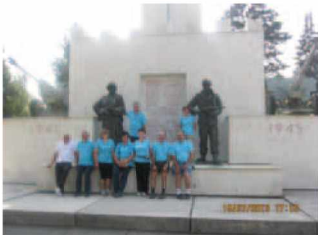
Pri spomeniku NOB na Trgu zmage