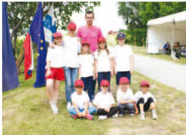
Najmlajši gasilci in gasilke PGD Križevci