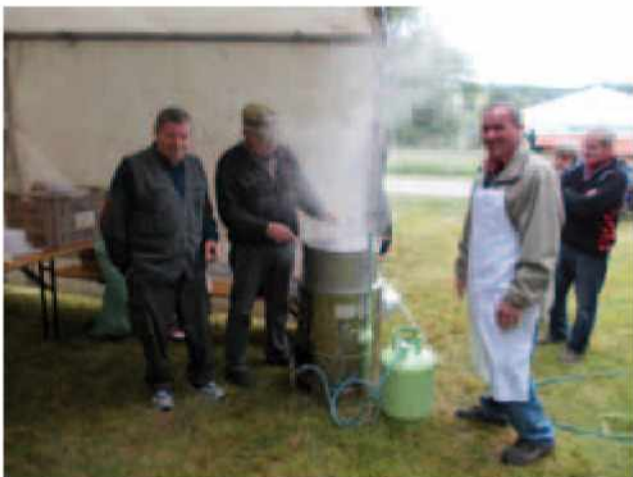
Moški člani društva so bili zadolženi za klobase

Domače klobase in langaš so kar dober magnet za obiskovalce. Škoda le, da je bilo v tem času veliko podobnih prireditev po Goričkem in sejmarji niso vedeli, katerega bi se udeležili. Kljub vsemu je bilo med obiskovalci veliko dobre volje in sejem se je zavlekel do popoldanskih ur. Če ne bi bilo toče, ki se je nenadoma spustila na Gornje Petrovce, bi obiskovalci ostali še dlje. Upajmo, da bo prihodnje leto lepše vreme in večji obisk.