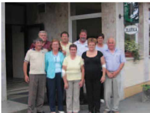
Krvodajalci KORK Gornji Petrovci, 05.09.2013