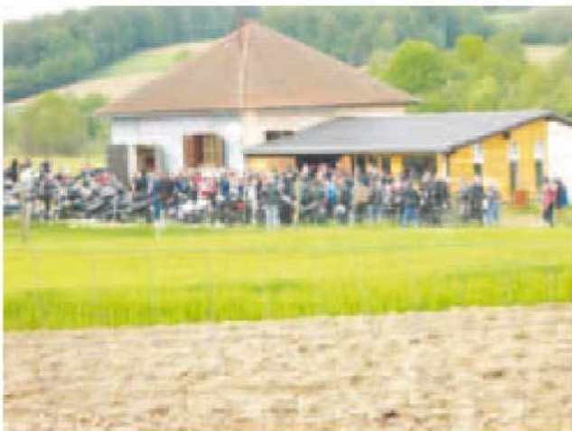
»Club house« v Budincih

Naš »club house« v Budincih, kot radi člani moto kluba imenujemo naše klubske prostore, nam zelo veliko pomeni in smo nanj zelo po-