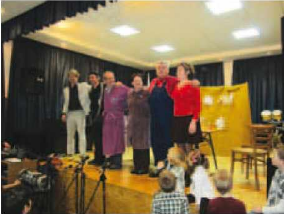
Nastop v Domanjševcih ob dnevu žena, 09.03.2013