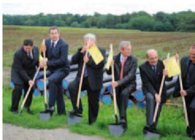
Simbolična zasaditev lopat na trasi bodočega B kraka pomurskega vodovoda v Murskih Črncih, 11.09.2013

S simbolično zasaditvijo lopat na trasi bodočega B kraka pomurskega vodovoda v Murskih Črncih, v občini Tišina, so župani dvanajstih prekmurskih občin v sredo, 11.09.2013 skupaj z ministrom za kmetijstvo in okolje, mag. Dejanom Židanom začeli tudi fizično gradnjo tega najtežje pričakovanega kraka novega pomurskega sistema oskrbe s pitno vodo. Vsi župani, minister in izvajalci so se nato odpeljali v kulturni dom Občine Gornji Petrovci v Stanjevcih, kjer so podpisali še pogodbo o sofinanciranju izgradnje vodovoda.