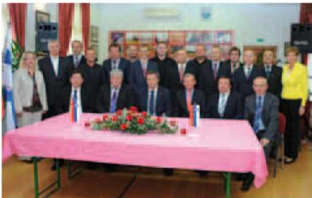
Vsi podpisniki pogodbe o sofinanciranju izgradnje vodovoda - sistem B