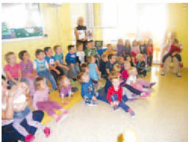
Otroci na glasbeni pravljici Maček Muri

Vzgojno izobraževalno delo v vrtcu poteka po individualnih načrtih za celo šolsko leto, ki ga za vsako skupino sestavi vzgojni tim. Rdeča nit, ki je vodilna za vse skupine je PREDBRALNA PISMENOST . Otroci se srečujejo s slikanicami, knjigami, ki so primerne za starostno obdobje. Za bralno značko otroci s pomočjo staršev preberejo določeno število knjig, slikanic in potem otroci vedo ob ilustracijah tudi opisat dogodke iz knjige in slikanice. Tudi ostale dejavnosti se med seboj prepletajo skozi igro.