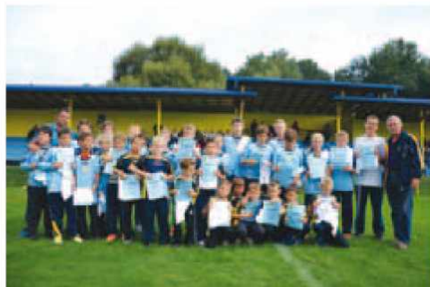
Zaključek nogometnega tabora.

Leto 2013 se poslavlja tudi z nogometnih zelenic. Ob koncu leta lahko povemo, da se je v Križevcih letošnje leto spet odvijalo po zastavljenih načrtih. Leto, ki ga obeležuje 50. obletnica delovanja,