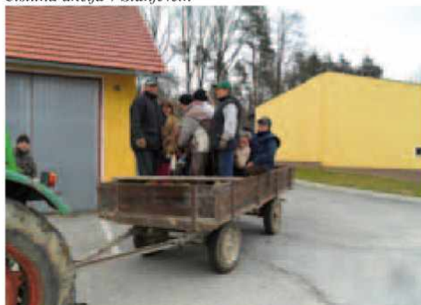
Čistilna akcija v Peskovcih