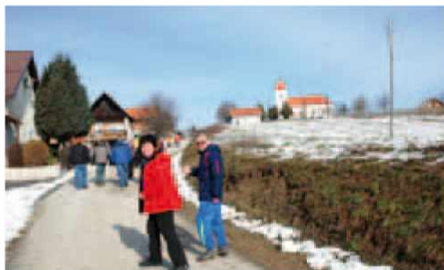
Na poti proti sv. Trojici

TD VRTANEK iz Gornjih Petrovec vsako leto organizira Prešernov pohod v počastitev slovenskega kulturnega praznika – Prešernovega dne. Tako je bilo tudi letos. Pohodniki so se zbrali v petek, 08.02.2013 pred vaškim domom v Gornjih Petrovcih in se odpravili na 12 km dolgo pot po obrobju vasi Gornji Petrovci. Pričakala jih je zasnežena zim-