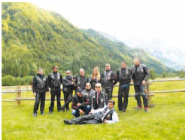
Člani MK Gronska strejla v Logarski dolini

Sicer pa smo v mesecu maju 2013 pod streho uspešno spravili že naše 13. mednarodno srečanje motoristov, ki se je tako kot prejšnja leta odvijalo na pomožnem nogometnem igrišču v Križevcih. Program srečanja je bil izjemno pester, saj so se na našem odru zvrstili številni odlični glasbeniki, prav tako ni manjkalo jedače in pijače. Za udeležence srečanja smo organizirali že tradicionalno krožno vožnjo do naših klubskih prostorov, kjer so se motoristi odžejali in nekaj malega prigriznili ter si istočasno ogledali še naše klubske prostore. Sicer pa je bistvo srečanja motoristov druženje, izmenjava izkušenj in informacij ter zabava.