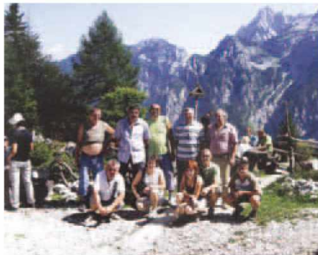
Gasilski izlet PGD Križevci na Okrešelj

Pridnost naših desetih pa smo ponovno nagradili in se meseca avgusta odpravili na izlet, seveda v lastni režiji. Obiskali smo PGD Rogaška Slatina, kjer so nas zelo lepo sprejeli in nam razkazali svojo gasilsko opremo in vozila. Ogledali smo si tudi trgovino rogaške steklarne in nekaj malega nakupili. Pot nas je naprej vodila v Olimje in Kostanjevico na Krki. Domov smo se vrnili v poznih nočnih urah.