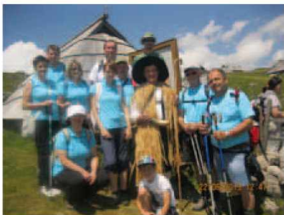
Pred pastirskim muzejem

nas je markacija usmerila na strmo travnato pobočje, ki se je čez čas položilo in nas pripeljalo do osamljene pastirske koče. Za kočo pot preide v gozd, se začne strmo vzpenjati, čez čas se položi in pripelje do označenega razpotja, kjer smo krenili mimo Jarčjega doma in po petih minutah prisopihali do razglednega travnatega pobočja. Tu smo se posedli po klopcah in občudovali lepote tega prečudovitega planinskega sveta. Vse naokrog po pašnikih se je sprehajala živina in mulila travo, oblito z jutranjo roso. Sonce nas je prijetno grelo in obetal se je lep dan. Razgledi so bili prečudoviti, vse povsod so se bleščale strehe pastirskih koč v jutranjem soncu. Okoliški vršaci so pogumno kazali svoje sive vrhove iznad zelenih smrek, vse