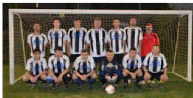
Veteranska ekipa ŠD Srebrni breg Martinje