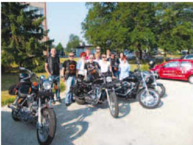
Člani MK Gronska strejla na krvodajalski akciji