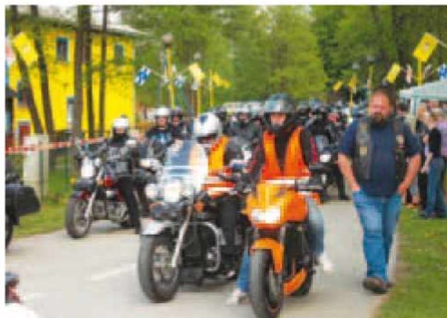
Start klubske vožnje v Križevcih

nosni. O tem priča vnema, s katero se vedno znova lotimo dela v naših klubskih prostorih, ki jih želimo preurediti tako, da bodo čim bolj funkcionalni ter hkrati prijetni in udobni. Radi rečemo, da bomo naš »club house« uredili tako, da se bomo v njem počutili kot doma. Da ne bo pomote, klubski prostori odražajo »bajkerski« način življenja in razmišljanja. Motoristi smo v svojem razmišljanju in delovanju pač izjemno preprosti, vendar kljub temu praktični.