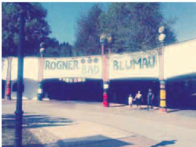
Terme Bad Blumau

Člani društva ŠKTD Adrijanci smo se 11.8.2013 odpravili na izlet na avstrijsko Štajersko. Zbirali smo se pri Izletniški kmetiji Falaut in se nato v velikem številu podali na pot. Prvo postajališče so bile terme Bad Blumau, kjer smo zvedeli veliko zanimi-