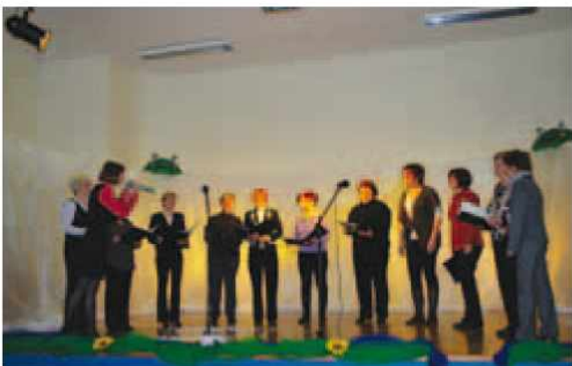
Vokalna skupina Zarja