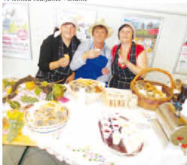
Martinovanje v Mercatorju

Teksti in slike Društva žena Kukeč: Nina Cifer