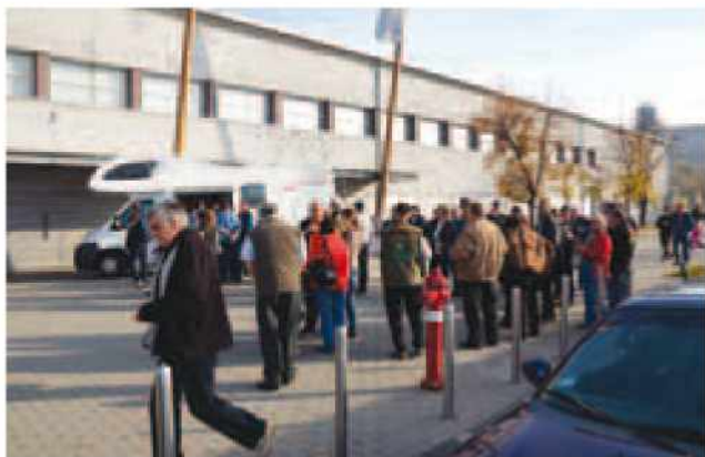
Izlet v Budimpešto

ogledu razstave smo se zapeljali po mestu in si po krajših postankih ogledali znamenitosti starega mesta in se v poznih večernih oz. jutranjih urah vrnilo domov.