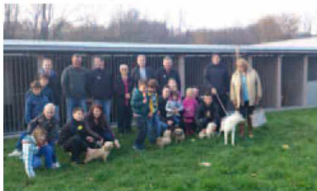
V zavetišču Mala hiša

Ponosni smo tudi na uspešno izpeljano celodnevno dogajanje v juliju, ko smo priredili turnir »na žajfi« in tekmovanje v kuhanju za »petrovski pisker«. V klubu vedno želimo biti inovativni in krajanom ter ostalim obiskovalcem