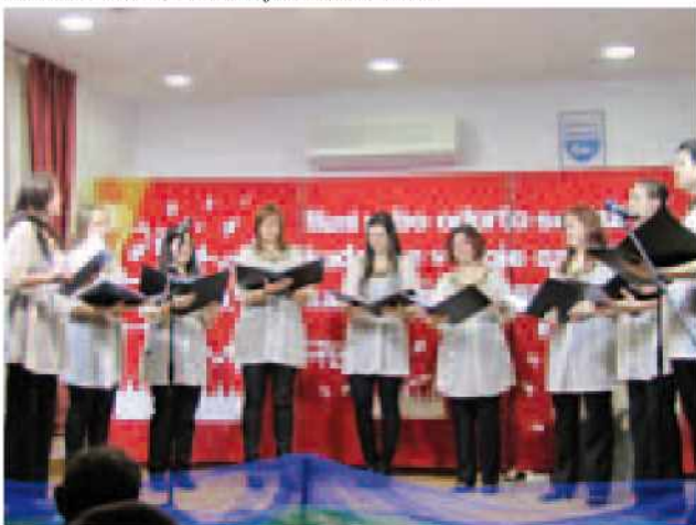
Vokalna skupina Bel canto