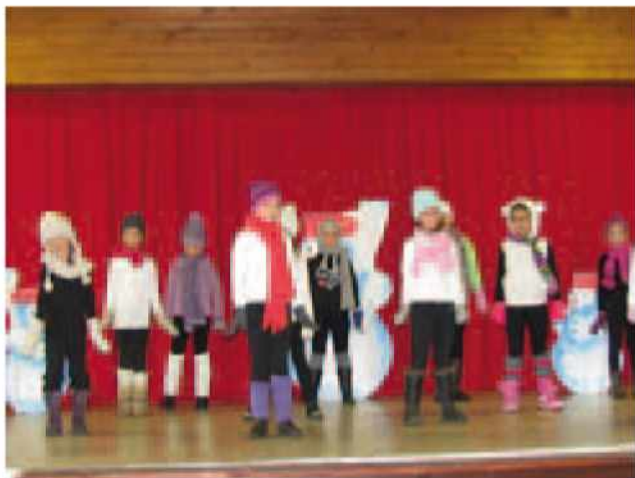
Plesni nastop najmlajših učenk - sneženi možak