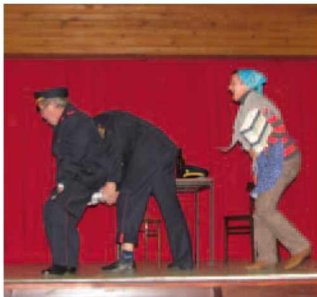
KUD Goričko - skeč Izprašeni gasilec