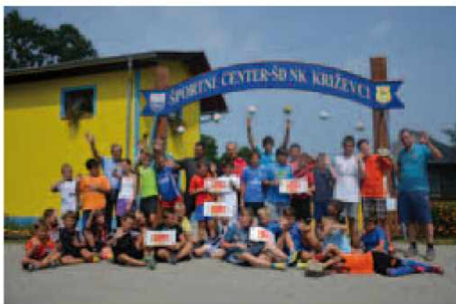
Udeleženci 2. nogometnega tabora v Križevcih

Od 21. do 23. avgusta 2013 je v Križevcih v športnem centru potekal nogometni tabor za otroke od 6. do 12. leta starosti. Tabora se je udeležilo 30 otrok iz širšega območja Goriškega in Murske Sobotice. Tabor je potekal od 7. ure zjutraj do 17. ure popoldan. Čez dan so po-