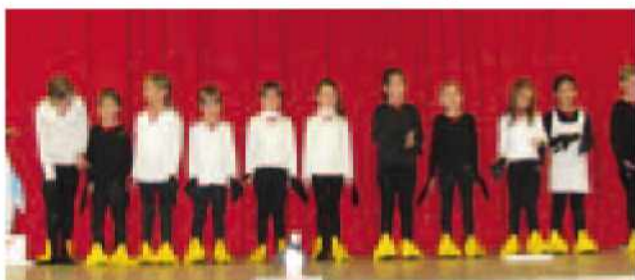
Plesni nastop najmlajših učenk - pingvinčki

Tudi letos je Občina Gornji Petrovci, skupaj s krajevnimi skupnostmi Gornji Petrovci, Križevci in Šulinci pripravila pogostitev za starejše občane nad 70 let. V gasilskem domu v Križevcih se je v nedeljo, 24.11.2014 zbralo 110 starejših občanov, ki so preživeli prijetno popoldne v druženju s sovrstniki in znanci iz mladosti. Kulturni program so pripravili učenci in učenke osnovne šole Gornji Petrovci, ki