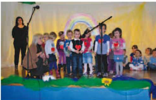
Nastop otrok VVZ Jurček