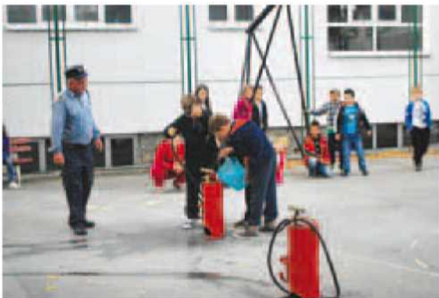
Tehniški dan Požarna varnost na OŠ Gornji Petrovci

pravljenost, natančnost in zmožnost usklajenega delovanja kot skupine. Pionirji so že večkrat dokazali, da sta sodelovanje in pripravljenost pomembni, saj so poleg priznanj prejeli tudi že pokal za usvojeno 1. mesto.