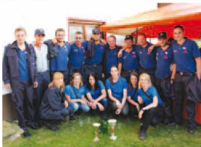
Zmagovalna ekipa PGD Križevci