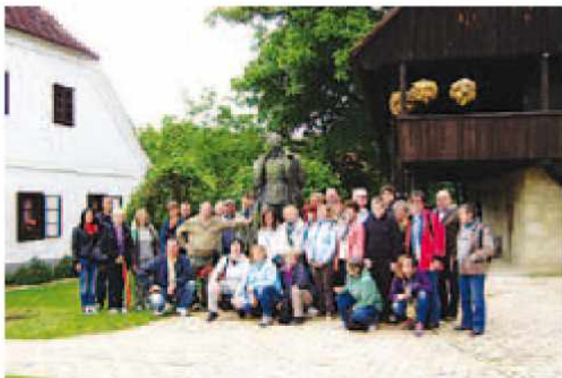
Pri rojstni hiši TITA v Kumrovcu