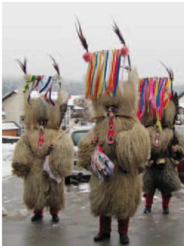
Kurenti s Ptuja

svojimi norčijami poskušali odgnati zimo. Prijazno smo jih sprejeli, malo smo se jih tudi bali, saj jih je bilo kar 12, nato pa so svojo pot nadaljevali še v vrtec in OŠ Gornji Petrovci ter naprej po Goričkem.