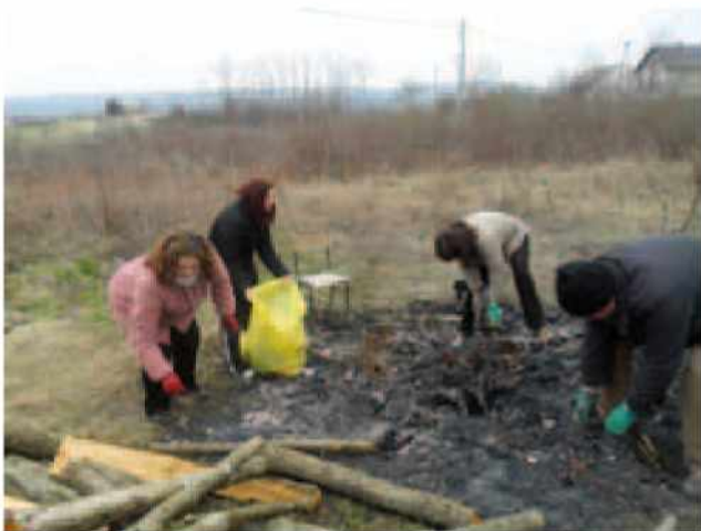
Čistilna akcija v Gornjih Petrovcih