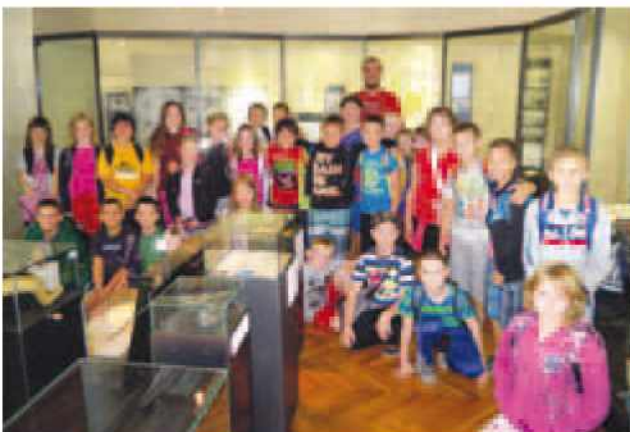
Na obisku v pomorskem muzeju v Piranu

Med nami se je proti koncu našega bivanja začelo čutiti domotožje. Zato so nekateri nestrpnost pričakovali zadnji dan. Potovalke so bile v nekaj minutah