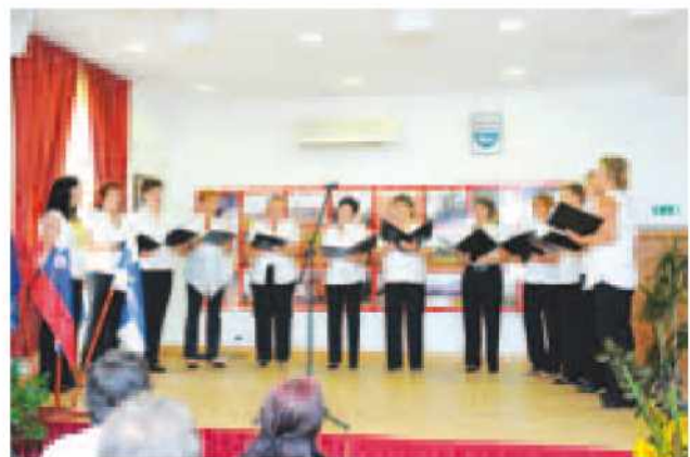
ŽPZ Primož Trubar Križevci