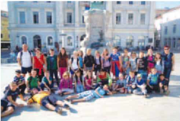
Učenci na Tartinijevem trgu v Piranu