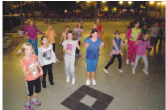
Deklice na plesnem večeru