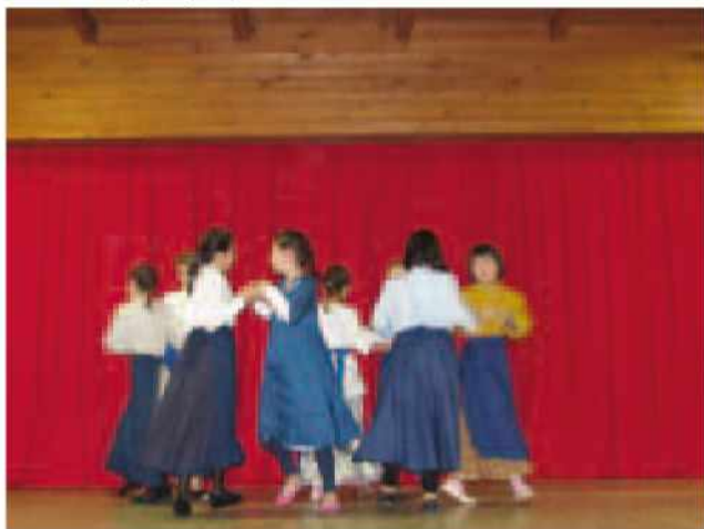
Folklorna skupina OŠ Gornji Petrovci