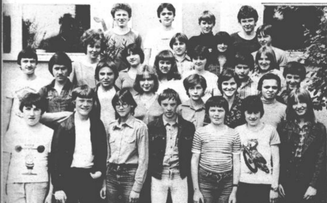
8.b MIHA PINTAR TOLEDO