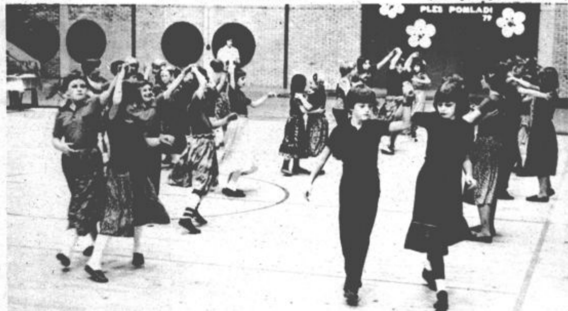
V počastitev dneva mladosti, rojstnega dne tovariša Tita, je Plesni klub Velenje prejšnjo soboto pripravil v Rdeči dvorani „Ples pmladi“, na katerem je nastopilo nad sto mladih plesalcev iz velenjskih osnovnih šol in Plesnega kluba.