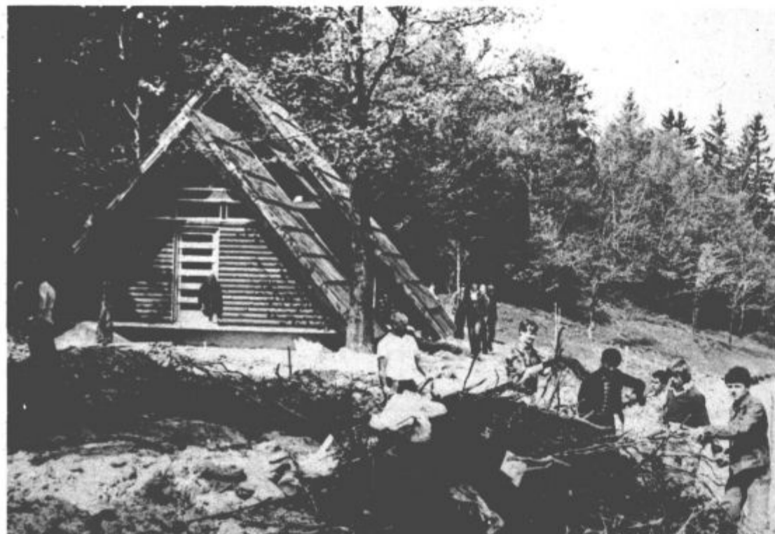
Dela pri urejanju spominskega parka na Graški gori, v katerem bodo postavili v spomin na legendarne boje Štirinajste divizije nošenje ranjencev, delo enega naših največjih umetnikov, nedavno umrlega kiparja Antuna Augustinčiča, so v polnem razmahu. V brunarici, ki so jo že postavili, bodo uredili spominski muzej o pohodu in bojih borcev Štirinajste. V akcijo urejanja parka na Gori jurjev so se pred dnevi vključili tudi učenci in starejši rudarji Rudarskega šolskega centra – TOZD Rudarski praktični pouk. Urejali so okolje, zbralo pa se jih je okoli 170.