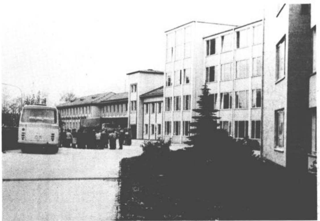
Tovarna Gorenje — Koerting

Zanimivo je, da tovarna v Grassau dobro sodeluje s tovarno Gorenje — Elrad v Gornji Radogni. Z njo so sklenili 5-letno pogodbo za kooperacijsko proizvodnjo tiskanih vezij oziroma platin, modulov in kanalnih preklonov. Letos bo vrednost tega kooperacijskega