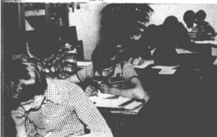
Mladi matematiki med reševanjem nalog

Organizacija Rdečega križa Zavodnje je uspešno zaključila zbiranje prostovoljnih prispevkov za pomoč prizadetim ob potresu v Črni gori. Zbrali so 6.640,00 dinarjev, kar je za kraj s tako majhnim številom prebivalcev nedvomno zelo veliko. Denar so že oddali občinski organizaciji Rdečega križa Velenje, ki ga bo skupaj z drugimi prispevki poslala na poseben žiro račun za prizadete po potresu. Odbor Rdečega križa se iskreno zahvaljuje vsem krajanom, ki so po svojih zmogljivostih prispevali za obnovo Črnogorskega primorja. M. A.