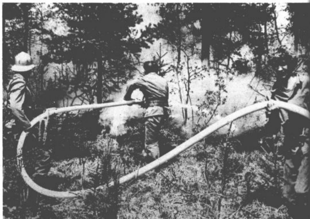
Gasilci Saleške doline imajo v teh lepih majskih dneh izredno veliko dela. Pred dnevi je zaradi malomarnosti začel greti gozd Ležen. Samo njihovem hitremu posredovanju se lahko zahvalimo, da požar ni povzročil še večje materialne škode. Zato predstavniki občinske samoupravne interesne skupnosti za varstvo pred požari opozarjajo vse občane, naj ne kurijo ognja tam, kjer so tudi najmanjša možnost, da laliko izbruhne požar. Le tako bomo obvarovali naše dragoceno bogastvo, kot so gozlove pred uničenjem.