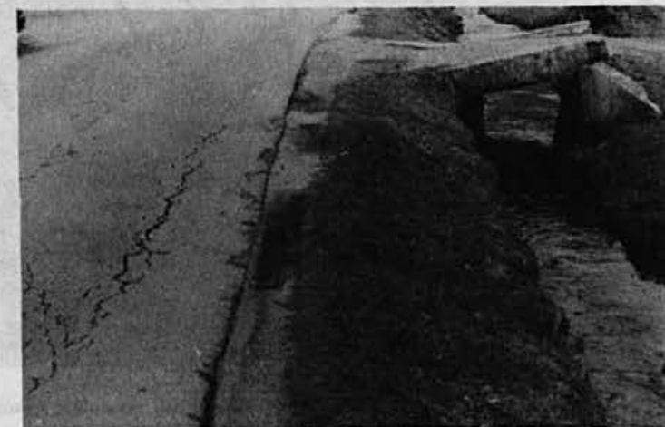
Jezerska ulica je bila med prvimi asfaltirana. Sedaj je cestišče že zelo uničeno, prav tako niso urejene bankine, cesta je ozka, ovinkasta, zlasti je ozko grlo most pri Polixu.