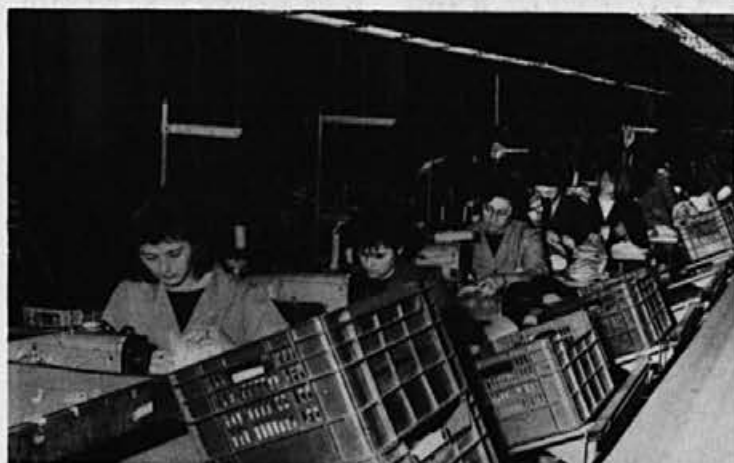
Na Colu so veliko pozornost posvečali usposabljanju delavcev

»Moram reči, da imam kar lepe spomine na tiste čase.