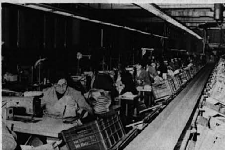
Iz obrata na Colu