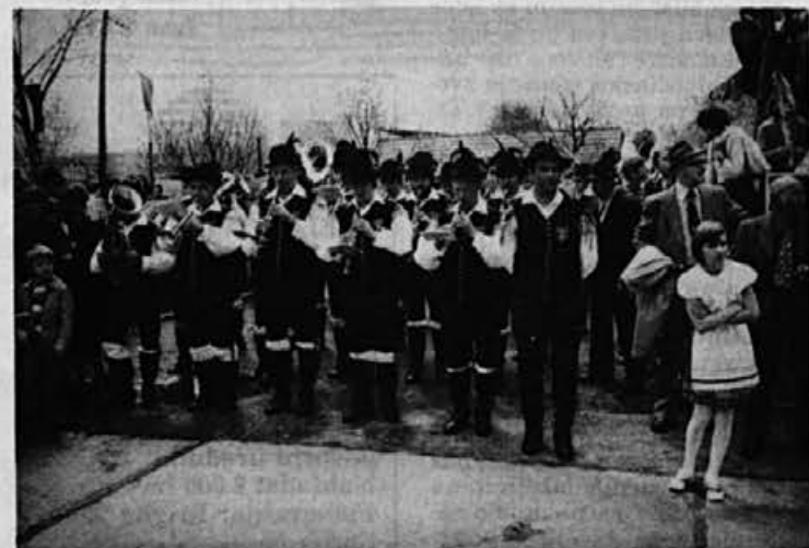
Nastop Pihalne godbe Alpina na Češkoslovaškem ob 1. maju 1978