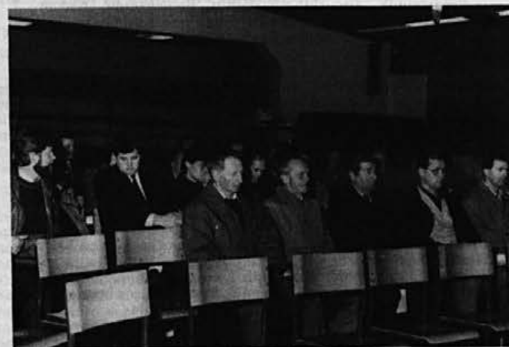
Sestanek z dr. Pučnikom je bila prilika za marsikakšno zanimivo vprašanje.