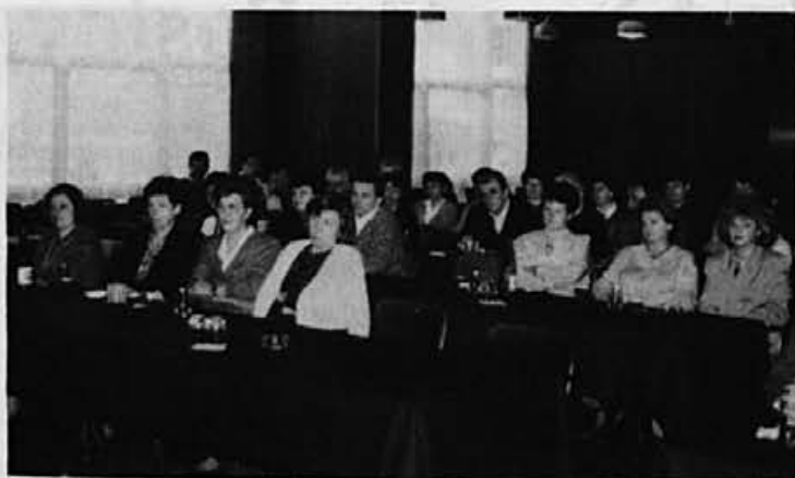
S plenarne razprave na poslovodski konferenci v Varaždinu

V zvezi z zaposlovanjem pa tole: spremenila se je tudi politika na tem področju. Medtem ko