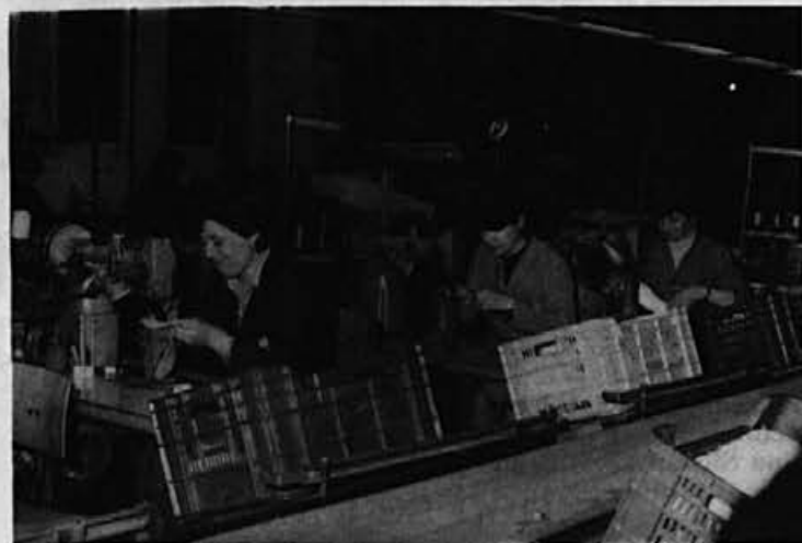
Iz obrata na Colu