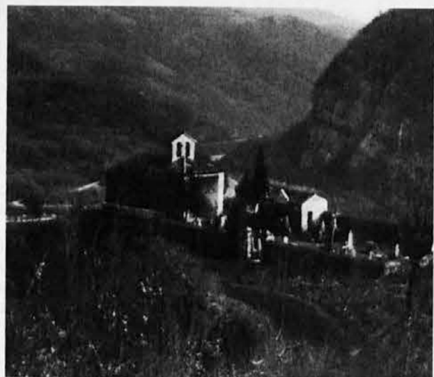
Prilesje pri Plaveh - gotska cerkva sv. Ahaca na gričku tik nad Sočo, v njej krasen obok z gotsko slikarjivo

V smiselno povezavo z veliko ljubljansko razstavo (gl. str. 5), ki zaobjema celotno slovensko ozemlje, se postavlja manjša - a nič manj premrežena z dragocenim kulturnim pomenom - fotografska razstava-potopis Gotske cerkve v Soški dolini in Goriških Brdih (na goriškem gradu od 16. julija do 17. septembra 1995).