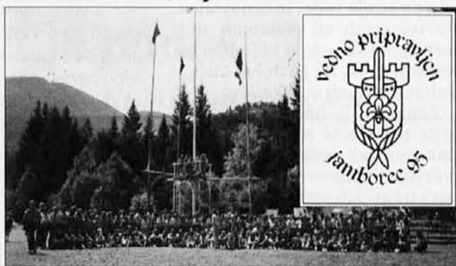
Slika z jamboreeja Globasnica '84 in domiselni znak letošnjega velikega tabora