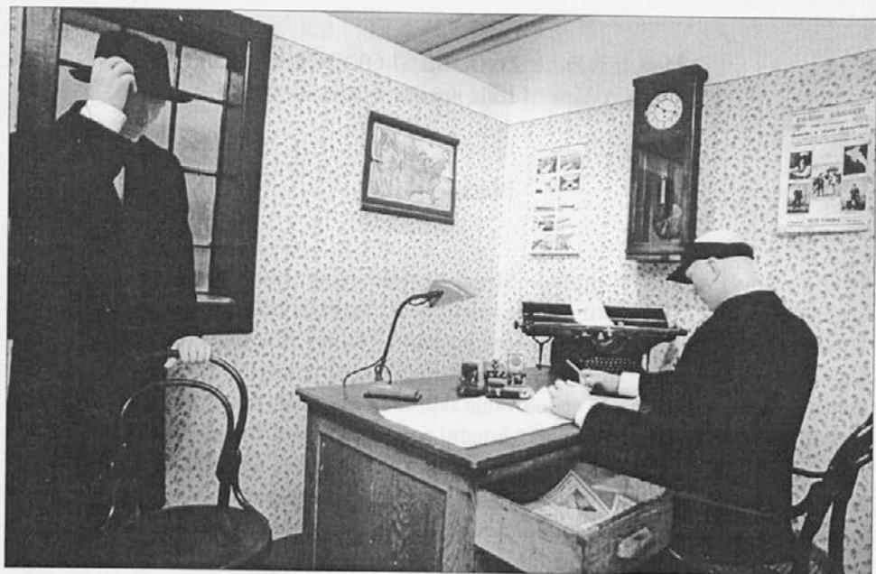
Rekonstrukcija izseljenske pisarne na Kolodvorski ulici v Ljubljani, okrog 1910