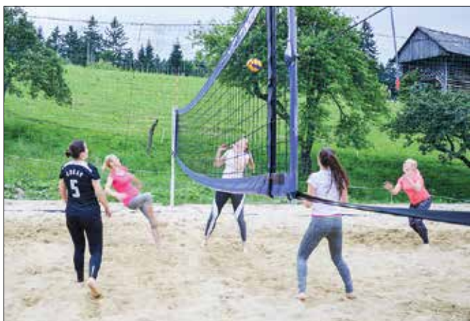
Pred dvema letoma so v Novi Štifti uredili igrišče za odbojko na mivki.