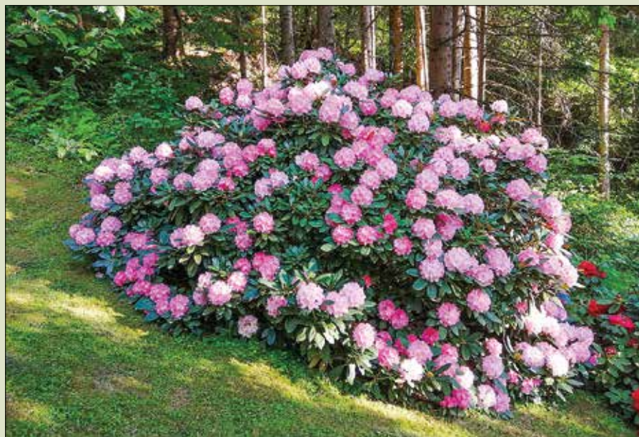
Za rododendron že vrsto let skrbita Greta in Franci Potočnik.