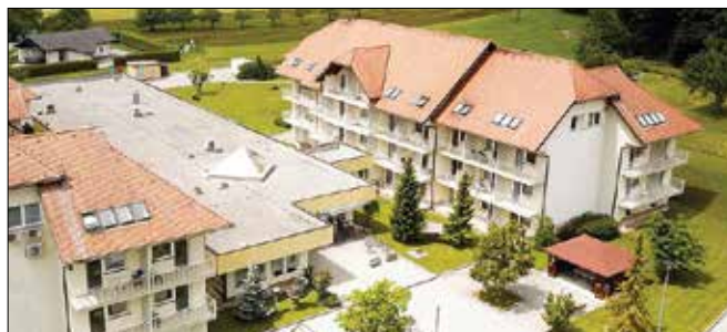
Spremembe se nanašajo tudi glede obiskov stanovalcev v gornjegrajskem centru starejših.

Obiski stanovalcev, ki so samostojni, potekajo zunaj doma brez predhodne najave. Pri tem še vedno prosijo za upoštevanje pravil za preprečevanje širjenja okužb (razkuževanje rok, vzdrževanje razdalje, uporaba zaščitne maske). Za obiske v sobah stanovalcev ali v primerih, kjer je potrebna pomoč osebja centra, je potrebna naj-