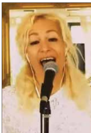
Alya je oboževalce razveselila z mini koncertom v živo.

skupine Up N' Downs so gostovali na online koncertu iz studia Killing Production. Skupaj so na glasbeni sceni že več kot desetletje. Zasedba je v tem obdobju izdala dva studijska albuma. Kot so zapisali, pa so v obdobju karantene razdelali in uredili nekaj svojih še neizdanih glasbenih idej in se tako pripravili na snemanje treh novih singlov, ki