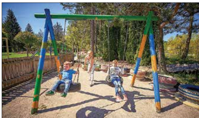
V parku cvetja ob Savinji bodo v soboto odprli novo igrišče.