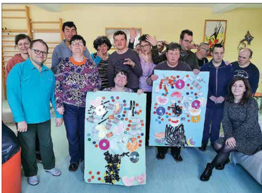
Na srečanju, posvečenem naravi, so udeleženci bralne značke izdelali dva velika plakata iz odpadnih materialov. Tako so v praksi spoznali pomen reciklaže.