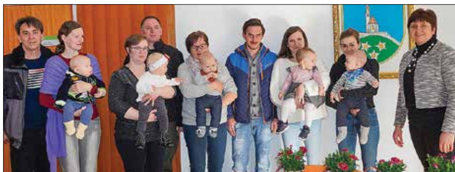
V lanskem letu je postala solčavska občina bogatejša za pet novorojenčkov.