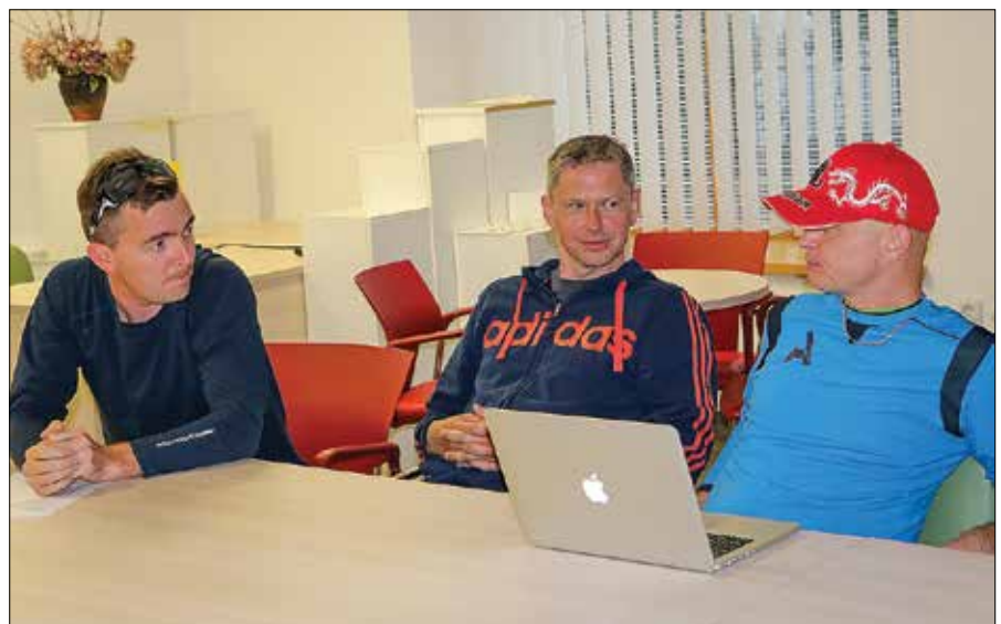
Občni zbor članov Jadralnega kluba Savinja je bil eden prvih zborov v dolini po epidemiji covid-19.