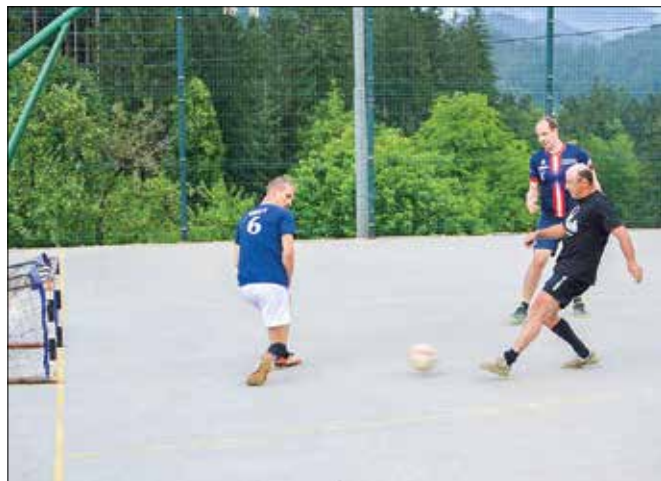
Nogomet je najljubši šport članov Športnega društva Nova Štifta.