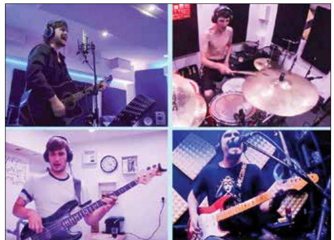
Člani skupine Up N' Downs so gostovali na online koncertu iz studia Killing Production.