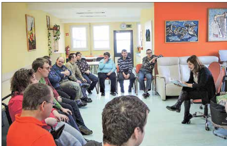
Osrednji dogodek srečanja je bralna urica, ki ji sledi pogovor o prebranem.

Poglaviti namen bralne značke je usmerjen v razvijanje književnih sposobnosti pri osebah s posebnimi potrebami. Strokovni delavci knjižnice pri sodelujočih vzbujajo pozitiven odnos do knjig in knjižnice ter se jim približajo na osebni ravni. To so zelo pristrčni ljudje, ki neizmerno cenijo osebni stik, radi se družijo, radi poslušajo zgodbe, spoznavajo nove stvari, v okviru bralne značke pa jim knjižničarji lahko nudijo vse to. Sodelujoče v projektu so spodbujali k aktivnemu pogovoru o prebranem in odziv je bil zelo dober. Nekaj uporabnikov se je tudi vpisalo v knjižnico.