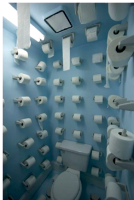
Kako smo preživeli karanteno v sobi za paniko.

- Gorska voda je polna težine, ki životu ne de dobro. Na najtežji način jo omeščamo, da jo oblakom prepustimo. Tako, ki z dol neba pade, je treba samo preko vajna vreti pustiti, vanjo kaj dobrega deti in že je za piti in lepše žveti.