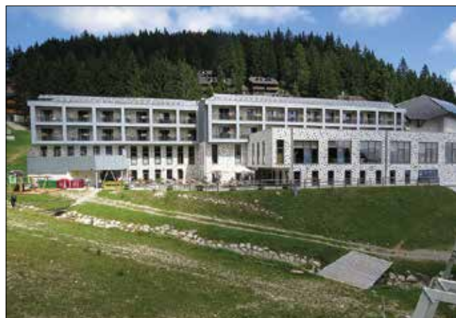
Pričetek poletne sezone na Golteh po korona krizi bo odvisen predvsem od povpraševanja turistov.

»To se je zgodilo potem, ko nismo dobili plač za marec. Ker smo bili na čakanju oziroma v odpovednem roku še aprila, nismo prejeli niti aprilске plače v maju. In rav-