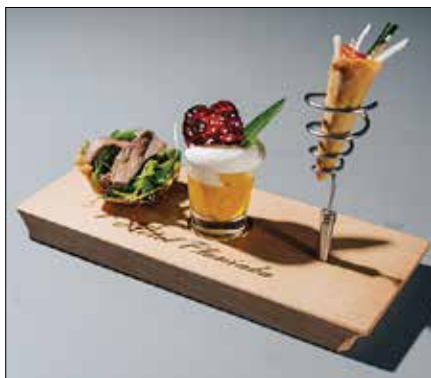
V znak dobrodošlice gostom postrežejo krožnik, imenovan Pozdrav iz kuhinje.

Poleg tega v Sloveniji obstaja tudi Gault&Millau, mednarodni gastronomski vodnik, v katerem smo od ocenjevalcev za leto 2020 preje-