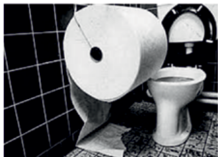
Poenostavljena varianta sobe za paniko.

- Pri soldatih sem vedno na oko ugotovil, ali je bilo zelje prešano od civilistov ali soldatov. V ljudskem zelju pak nikedar ni bilo za najti gojzarjevih šnimcov.