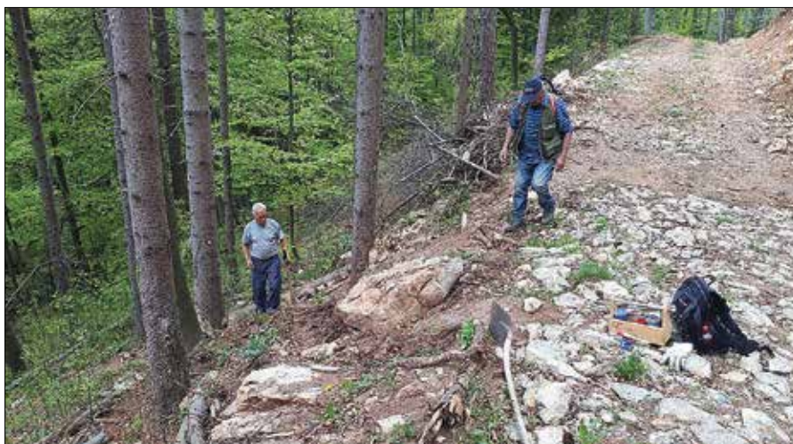
Markacisti Planinskega društva Rečica ob Savinji so opravili vzdrževalna dela na poteh, za katere skrbijo v društvu.

DRUŽINSKI POHOD PO VRHOVIH REČIŠKE OBČINE