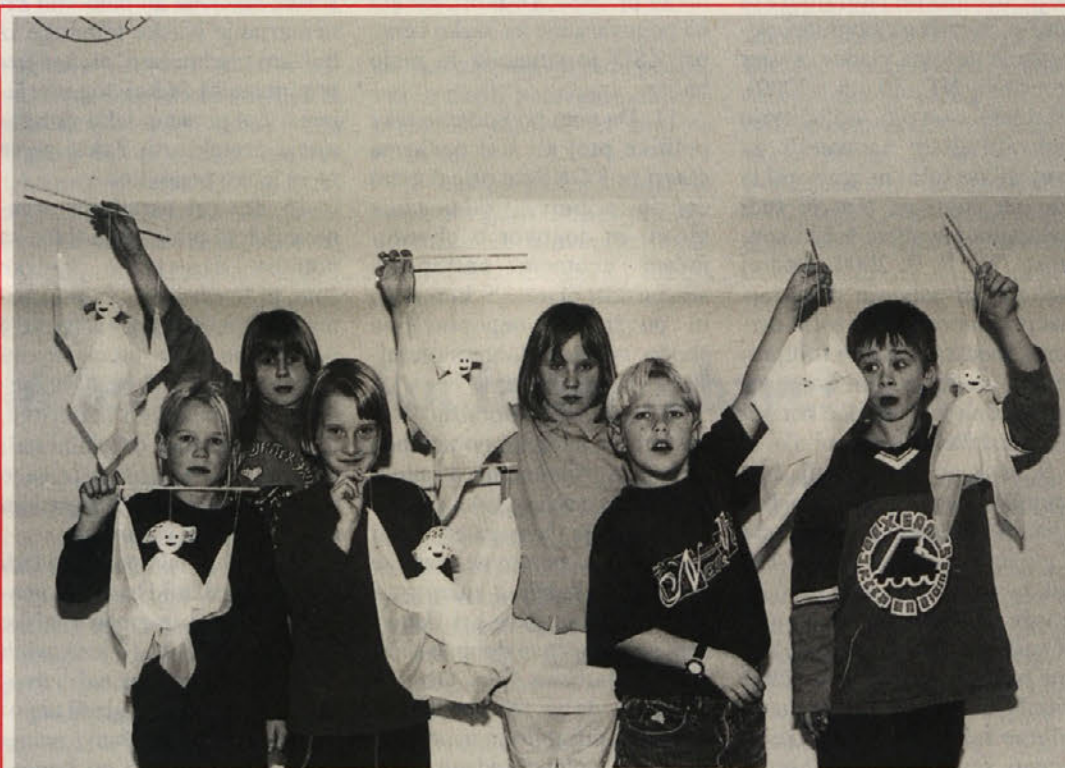
V Žvabeku so v ljudski šoli tudi letos izvedli medkulturni projekt, tokrat na zelo romantično temo »Sanje«. Otroci so risali in se ukvarjali z ročnimi deli in se ob delu spoznavali. Več o tem na strani 5.