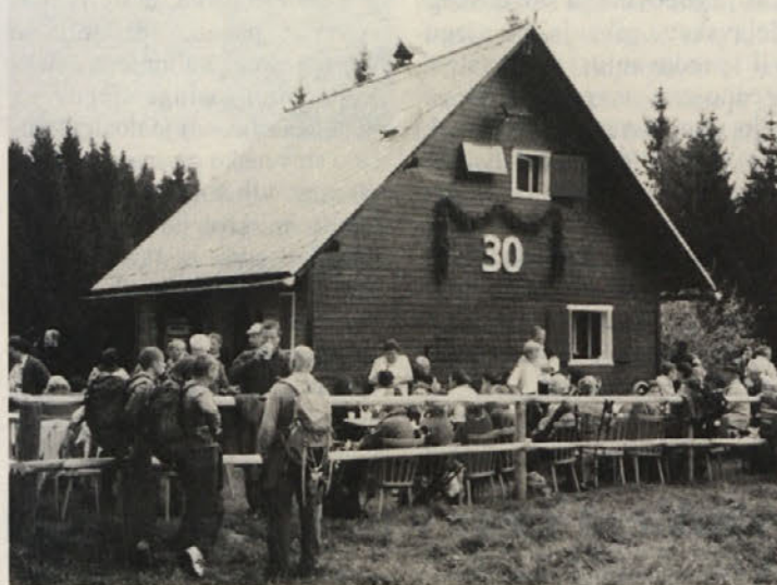
Tudi ob 30-letnici planinske kočje nad Arihovo pečjo je bilo veselo