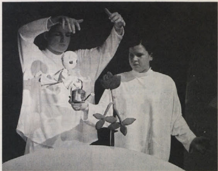
Mali princ in vrtnica