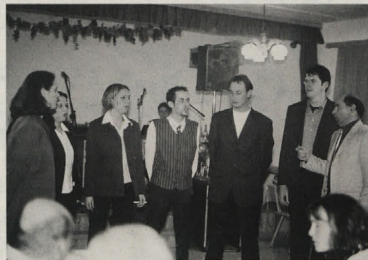
Zapela je vokalna skupina Nomos iz Škocjana

Na martinovanje je vabilo tudi KD »Apače-Šmarjeta«.