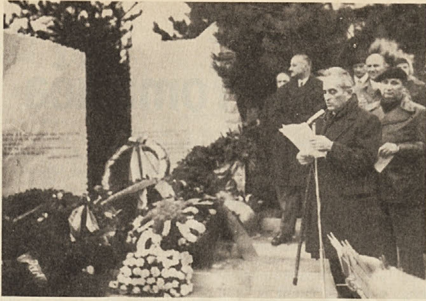
V nedeljo, 28. novembra so na Opčinah odkrili veličasten spomenik padlim borcem in žrtvam nacifašizma. Kljub izredno neugodnemu vremenu se je svečanosti udeležila velika množica. Uresničena je torej dolgoletna želja bivših partizanov in aktivistov in seveda tudi svojcev padlih.

Posebno resno in žaljivo je, po našem mnenju, stališče, po katerem je, kot je zapisano v uradni sintezi predsednikovega govora, vlada pripravljena delovati za zadovoljitev