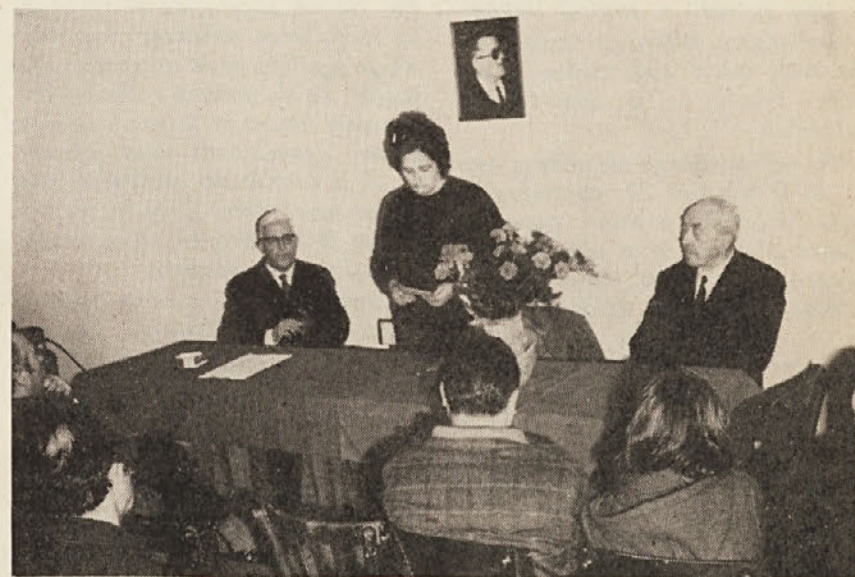
Pobuda sekcije KPI v Barkovljah