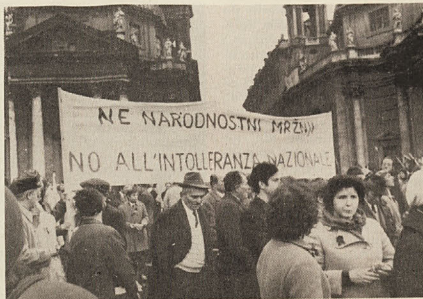
Transparenti s slovenskimi gesli na demonstraciji v Rimu