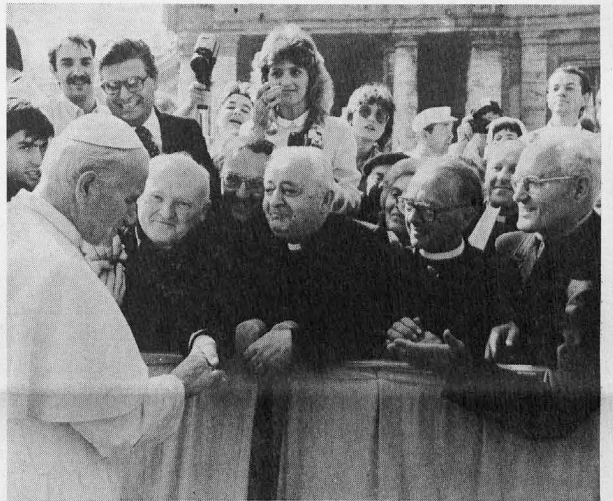
V sredo 7. septembra je papež Pavel Janez II sprejel in pozdravil v materinem jeziku Beneške Slovence, ki so se udeležili petdnevnega simpozija o Ivanu Trinku v Rimu. Več na prihodnji številki.