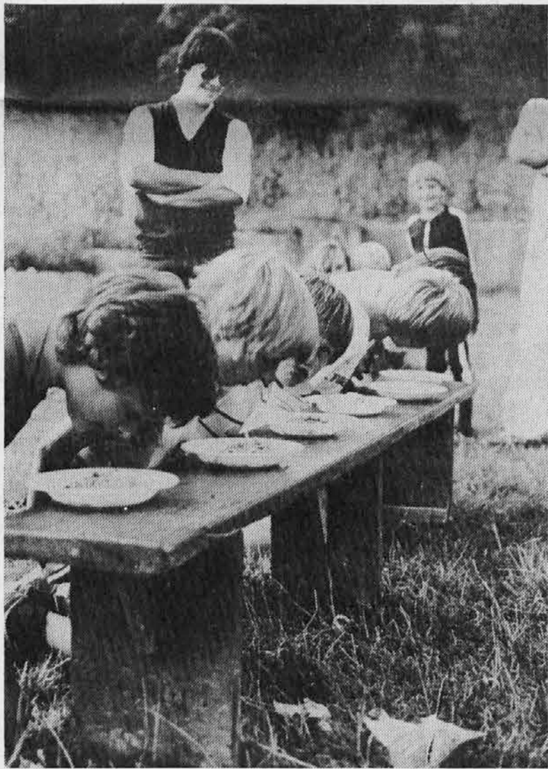
Liepi poletni cajti puni veselja in lepih igri so finili, naš otroc se napravljajo za šuolo.

* Še priet ku se je rodila je pretekla mamu (str. 5)