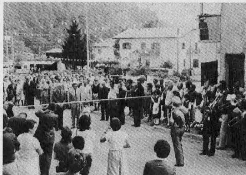
Un momento dell'inaugurazione di Pradielis ricostruita.

Pradielis - Ter nel comune di Lusevera è a distanza di 7 anni dal catastrofe terremoto che ha colpito il Friuli completamente rinnovato. Rimosse le macerie, sanate almeno in parte, le grosse ferite che il sisma ha provocato radendo al suolo il paese, Pradielis, uno dei più grossi centri dell'Alta Val Torre ha ripreso lentamente a vivere.