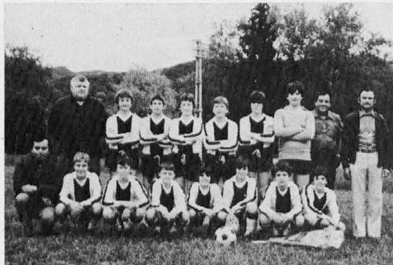
Valnatisone Esordienti classificatasi al 3° posto nel comitato provinciale di Udine.

Visto il successo ottenuto, iniziamo a pubblicare [foto degli anni scorsi.