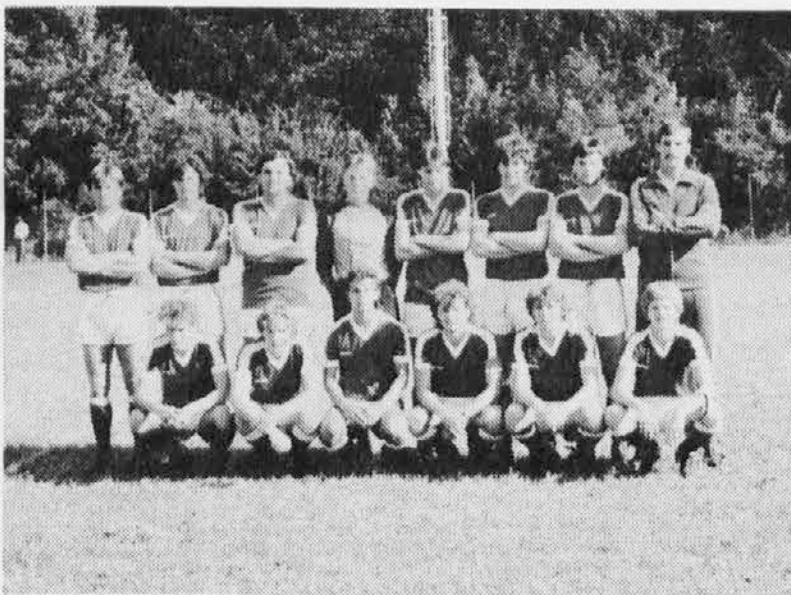
La Valnatisone che ha pareggiato a Savogna, venendo poi eliminata dai calci di rigore.