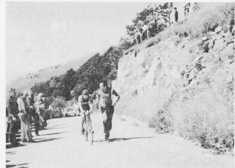
L'arrivo del giovane ciclista del K.K. Soča, con a fianco il presidente che lo incita.