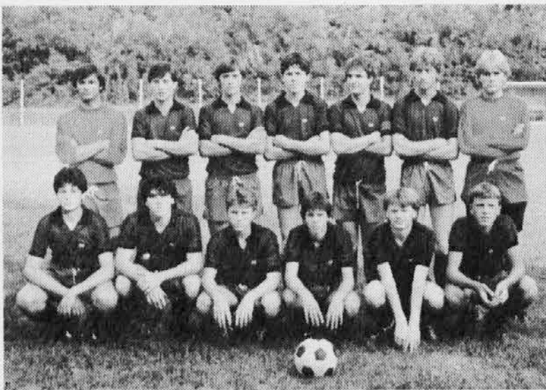
La formazione degli Under che ha perso a Zugliano con il minimo scarto.