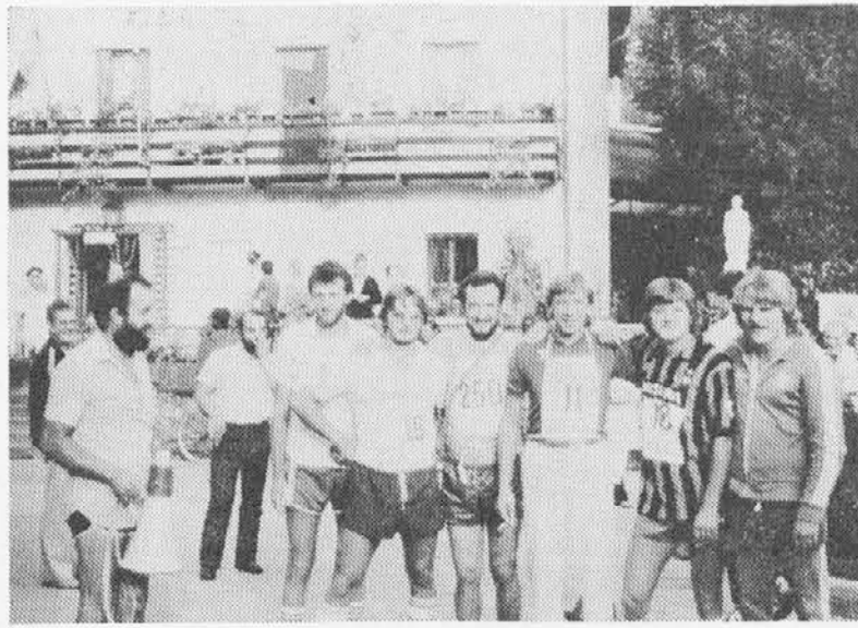
Alcuni concorrenti della marcialonga prima della partenza.