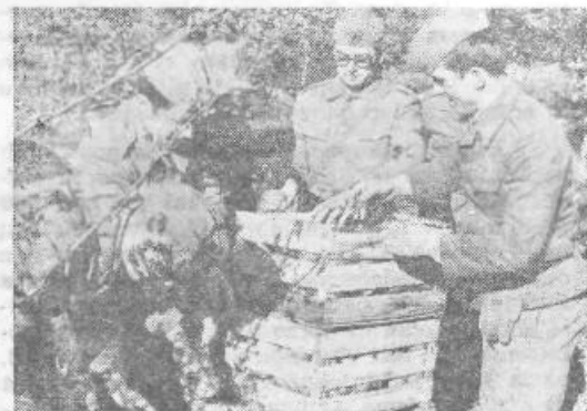
Pomoč pri obiranju sadja

Življenje na karavlah naših graničarjev je nekaj posebnega. Visoka stopnja tovarištva, vsakodnevne obveznosti pri pouku in urjenju, delovne in družbenopolitične obveznosti, kulturno-zabavne aktivnosti jim dajejo značaj specializiranih enot, zelo povezanih z ljudmi v krajih, kjer bivajo. Starešine obmejnih enot so aktivni družbenopolitični delavci v 85 obmejnih občinah. Poznamo pa nešteto primerov medsebojnega sodelovanja graničarjev in prebivalcev obmejnih naselij (prek 2457 vasi in naselij s prek 1,5 milijona prebivalcev).