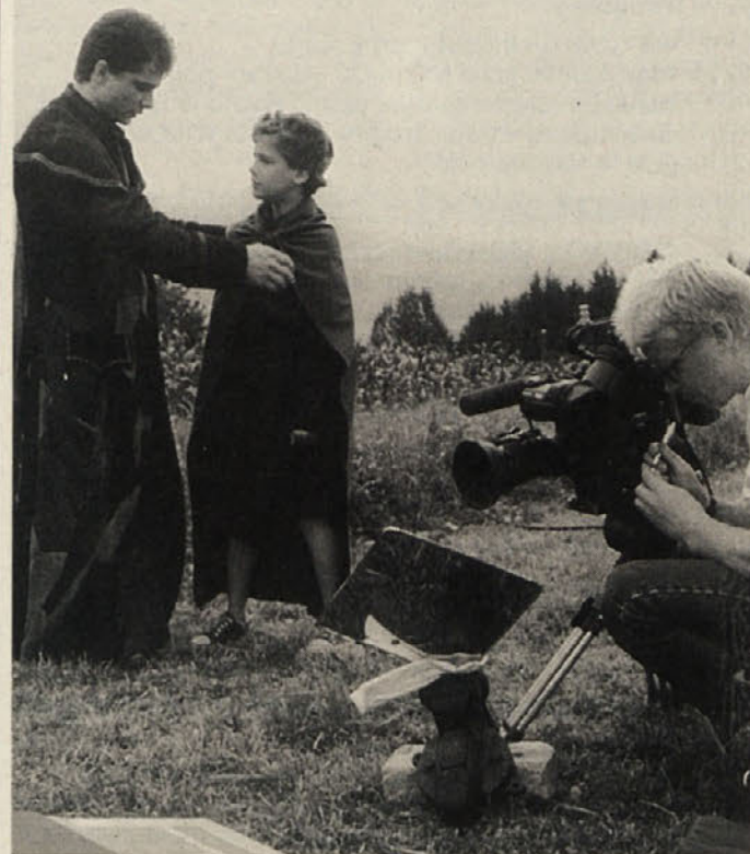
Za vsako sekvenco je potrebno veliko dela

»Film o zgodovini slovenske besede na Koroškem naj bi bil prav za mladino. Važno nam je, da pokažemo in dokumentiramo kontinuiteto slovenske besede«, tako filmska ekipa v pogovoru s Slovenskim vestnikom.