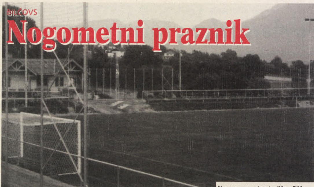
Novo nogometno igrišče v Bilčovsu

Ob slavnostni otvoritvi obnovljenega nogometnega igrišča v Bilčovsu, katere se je udeležilo nad 1500 ljudi, so predvsem bilčovski nogometaši doživeli pravi nogometni praznik.