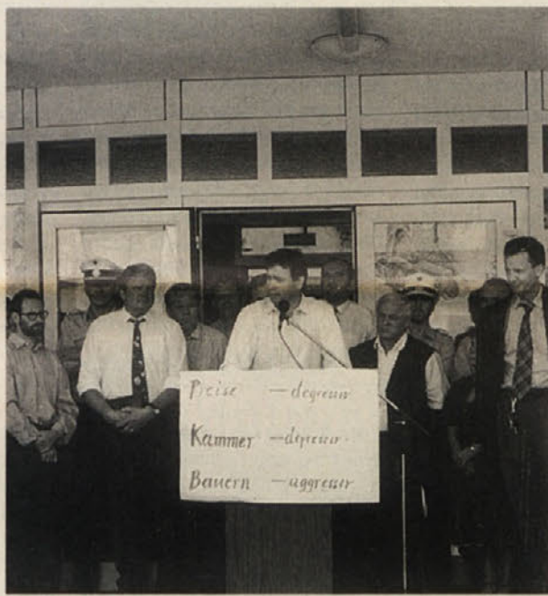
Občni zbor je bil pravzaprav demonstracija