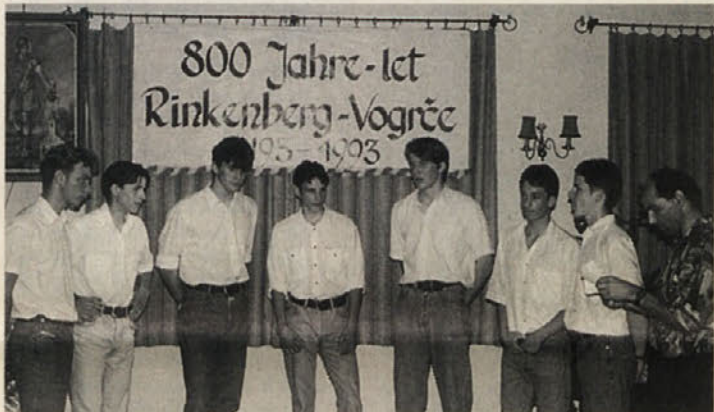
Koroška pesem tudi ob predstavitvi zbornika ni manjkala

Preteklo soboto so se zbrali Vogrjani in gostje »Pri Florjanu« na kulturnem večeru, ki so ga oblikovali domači pevski zbori in tamburaška skupina Novega sela – Gradiščanska. V ospredju večera pa je bila predstavitev zbornika »Osem stoletij Vogrč«.