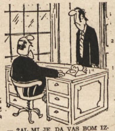
ZAL MI JE, DA VAS BOM IZGUBIL. BELIČ. BILI STE MI KOT SIN: LEN, NESRAMEN IN NEHVALEŽEN!