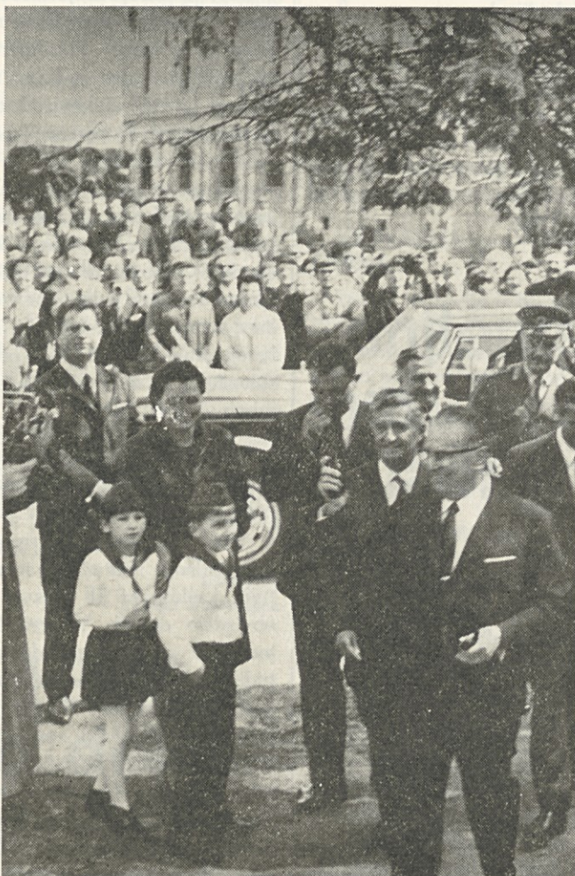
Tovariš Tito na obisku pri nas aprila 1969

državljana v pravicah in obveznostih ne glede na nacionalno pripadnost;