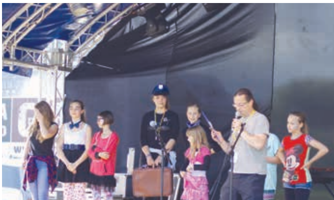
Po končanih nastopih so se vsi nastopajoči zbrali na odru, kjer so prejeli darila.