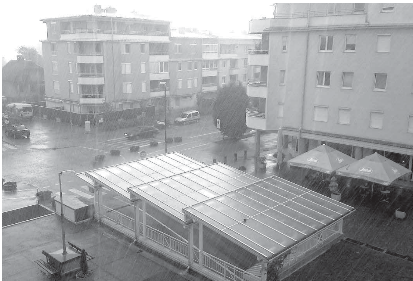
V popoldanskih urah v četrtek, 14. maja 2015, nas je obiskala obilna ploha.

Junjska veselica PGD Trzin je na suhem oziroma pod streho, koga sploh še zanima minulo vreme? Kljub precejšnji urbaniziranosti Trzina, ta je precej bolj kot v miselnosti njegovih prebivalcev prisotna na področju »vizualnega«, torej v podobi kraja (po domače – v tistem, kar vidimo ...), je v našem lepem kraju vendarle še precej ljudi, ki jih zanima vreme. In celo nekaj takih, ki so še vedno v precejšnji meri od njega tudi odvisni, tako od