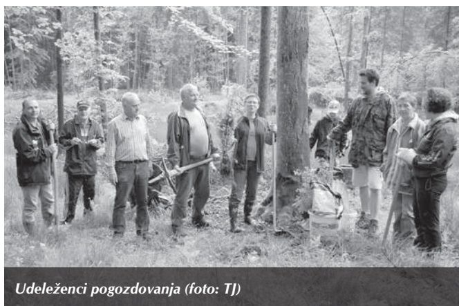
Udeleženci pogozdovanja