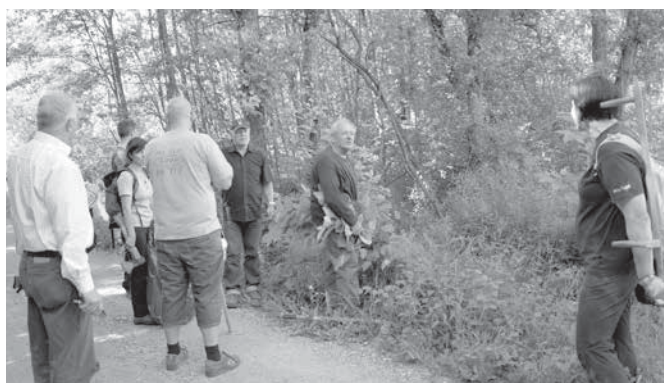
Nekateri udeleženci odstranjevanja invazivk