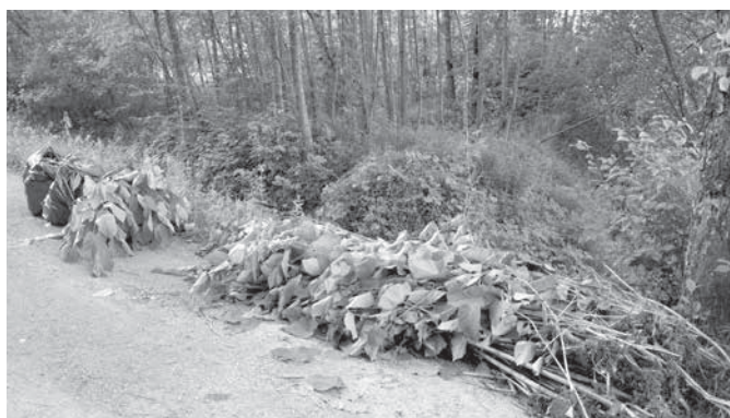
Odstranjeni japonski dresnik

Občina Trzin je v sodelovanju s TD Kanja in PD Onger v petek, 29. maja, organizirala zdaj že četrto akcijo odstranjevanja tujerodnih invazivnih rastlin. Invazivke so odstranjevali na treh območjih gozda: ob makadamski cesti, ki vodi proti Frnihtovemu bajerju, ob bajerju samem in v okolici bližnje začasne deponije. Akcije se je udeležilo nekaj predstavnikov občine ter njenih organov, društev, nekaj občanov in otrok. Skupaj skoraj dvajset ozaveščencev. Vsekakor bi jih pričakovali več, saj predstavljajo invazivne rastline res velik problem, ne samo v Sloveniji, ampak tudi po Evropi.