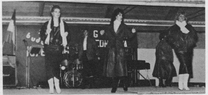
Manekenke su oduševile publiku sa modelima i plesom