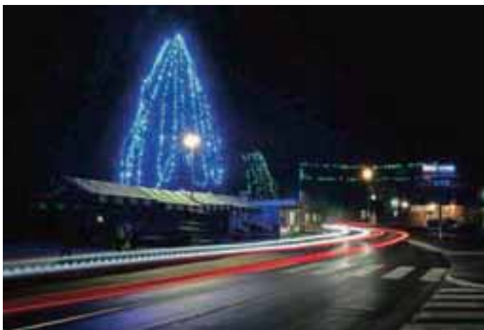
Za okrasitev smreke pri trgovskem centru so porabili štiristo metrov lučk.