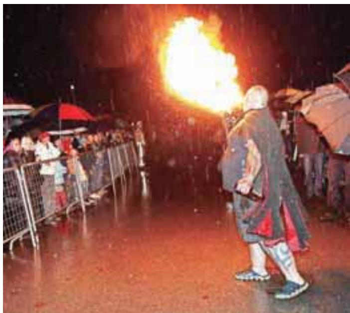
Prireditve v Goričanah je odprl vravec, ki je za to priložnost prišel neposredno iz pekla.