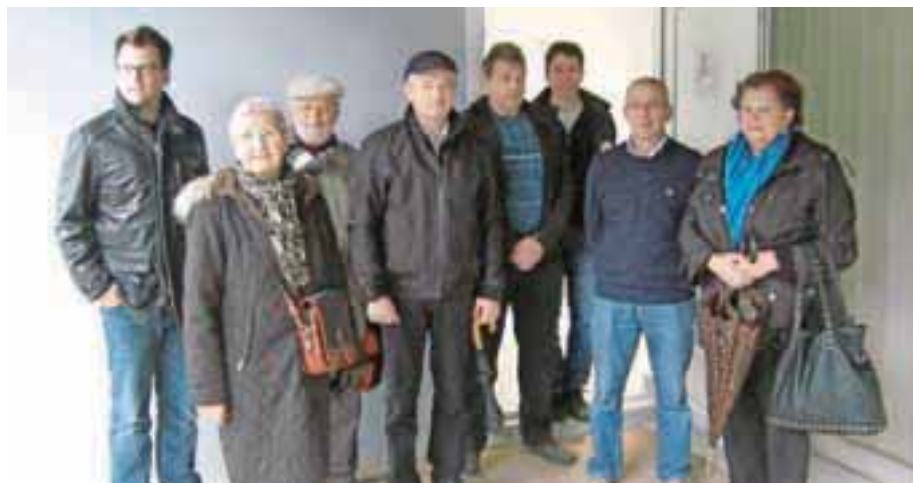
Občinski svetniki pred obnovljenimi prostori krajevne skupnosti

Murnik se je obregnil tudi ob državo, saj so jim pri ministrstvu za kmetijstvo in okolje že pred časom obljubili zadrževalnik vode na začetku vasi, da potok Ločnica ob nalivih ne