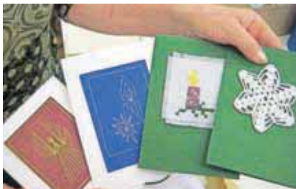
Voščilnice so krasili umetelni okraski.

sledi tudi »modnim« smernicam, zato vsako leto doda kaj novega.