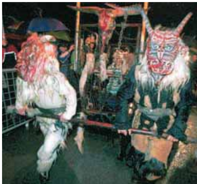
Iz lesene kletke goričanskih parkeljnov so preplašeno gledali ugrabljeni otroci.