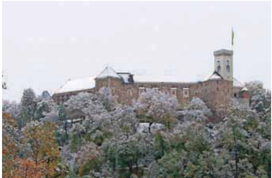
Kdo bo na prvi novoletni dan tekkel od Mestne hiše do Ljubljanskega gradu?

Novoletni tek na Ljubljanski grad bo organiziran v obliki kronometra z začetkom ob 12. uri. Tekaču bo organizator dodelil uro štarta. Prihod na štart je vsaj pet minut prej. Štartni interval bo določili glede na število prijavljenih tekmovalcev. Tekači bodo izpred Mestne hiše štartali v smeri Stritarjeve ulice preko Ciril-Methodovega trga. Po Vodnikovem trgu trasa zavije na Študentsko ulico in se nadaljuje po cesti Za ograjami do Razgledne steze in Ljubljanskega gradu. Slab kilometer dolga proga je tako speljana po zaprtih poteh in se strmo vzpenja v hrib. V primeru ledu bo štart ob vznožju ceste na grad ob rampi, trasa pa bo potekala po cesti na grad. Najboljši tekmovalci v absolutni moški in ženski kategoriji bodo prejeli nagrade, čeprav osnovni namen ni tekmovalen. Namen organizatorja je, da na prvi dan leta združi tekače, ne glede na njihovo sposobnost in čas, da se družijo, storijo nekaj zase in del dneva po najdaljši noči v letu preživijo na drugačen način. To bo priložnost, da