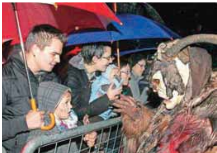
Varovalne ograje so dajale lažni občutek varnosti ...