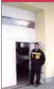
NOVA SODOBNA DELAVNICA