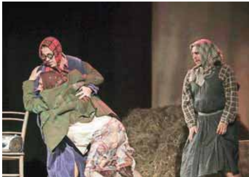
... tak'le pa naš' mal' preoblečen' fantje.

Po treh uspešnih predstavah v preteklih sezonah so v mladem medvoškem gledališču KUD Fofite ustanovili sekcijo za ljudski oder in za začetek uprizorili besedilo domačega avtorja Simona Goričana z naslovom Anže an Micka. V predstavi se, kot ljudski igri pristoji, seveda govori v žlahtni gorenjščini, še kako domače pa je tudi dogajanje na odru. V dveh urah se zgodi cel kup takih in drugačnih ljubezni, ki sprva niso, a bi bile, pa se potem le nekako zgodijo. Duhovito besedilo in prepričljiva igra nas tudi po dveh urah moških in ženskih skušnjav, peripetij in zmešnjav, zapletanj in odpletanj ne dolgočasita. Igra je običajno preprosta, ljubitelj-