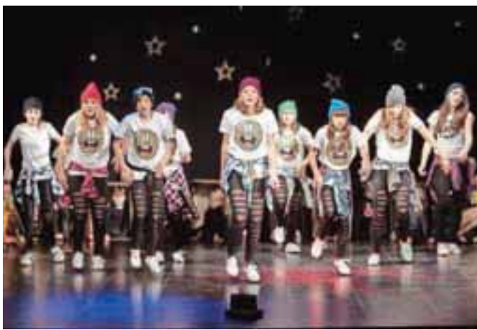
Hip hop mladinska skupina