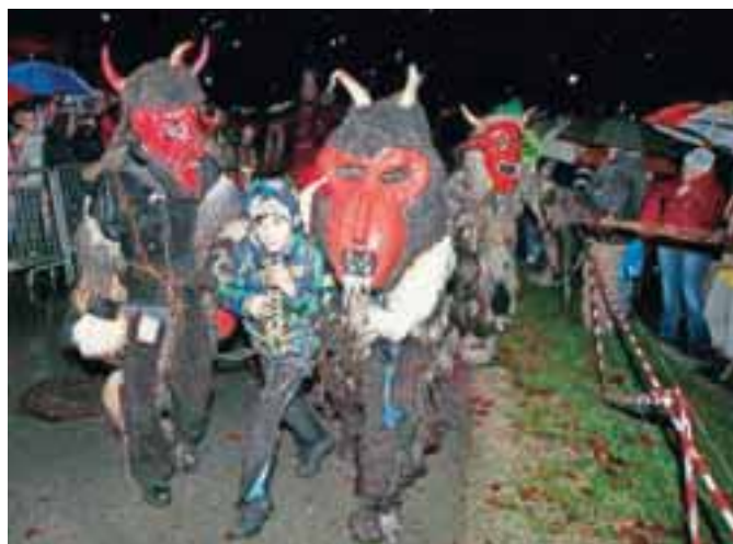
Sorške hudobe so pokazale, kaj se zgodi s porednimi otroki.