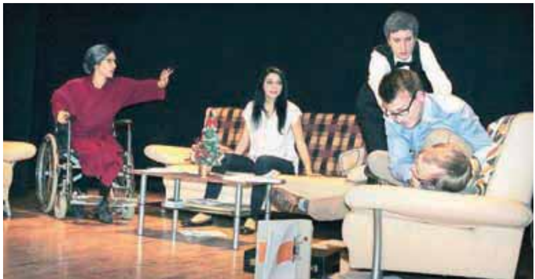
Goljufivi poslovnež se je fizično lotil davčnega inšpektorja, ki je prišel na zasebni obisk ...

Zgodba pripoveduje o uspešnem poslovnežu, kateremu je nekoč davkarja po pomoti pripisala ena ga otroka. Zgrabil je priložnost ... Potem pa se je napovedal davčni inšpektor in vse, kar si je spretni poslovnež pripisal, je bilo treba utemeljiti in dokazati ... Dramatik je očitno dobro poznal psihologijo takih goljufov, saj je vse sodelujoče dobro okarakteriziral z vsem pretiravanjem pri tem početju. Seveda je v dogajanje vpletena tudi ljubezen. V komediji je kar nekaj nepričakovanih preobratov,