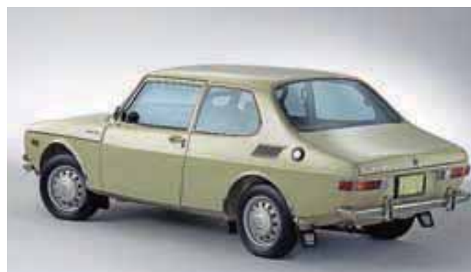
SAAB 99, avto, ki so ga za svojega vzeli visoko izobraženi ljudje.