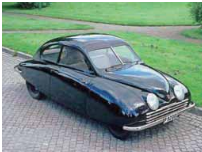
SAAB 92, prvi avtomobil, ki so ga naredili letalski inženirji.