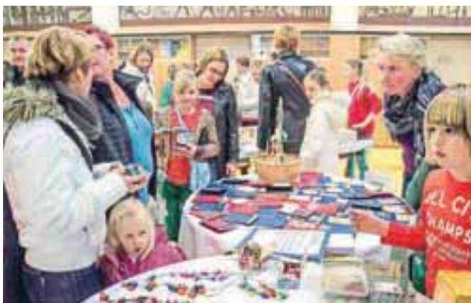
Praznični sejem so pripravili tudi v Osnovni šoli Simona Jenka Smlednik.