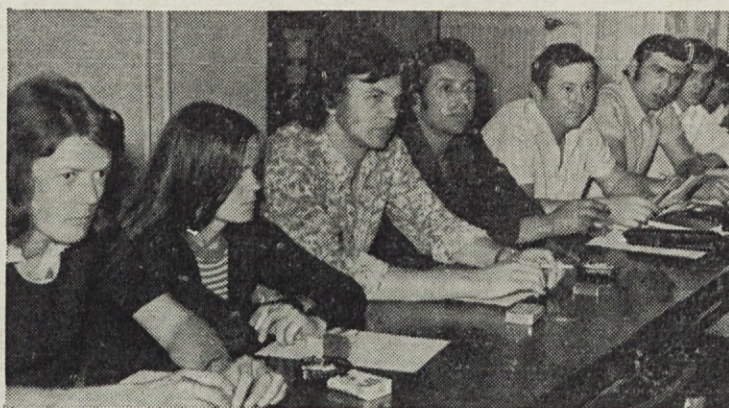
O pomembnejših odločitvah razpravljajo poleg delovnih skupin tudi družbeno politične organizacije. Na sliki: Sindikalni delavci so se zbrali k razpravi o kriterijih za določanje dolžine letnega dopusta