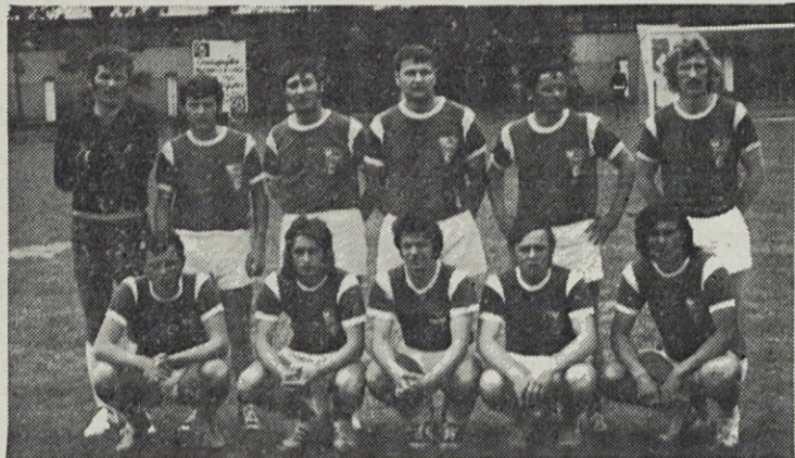
Nogometarji Save pred pričetkom tekmovanja