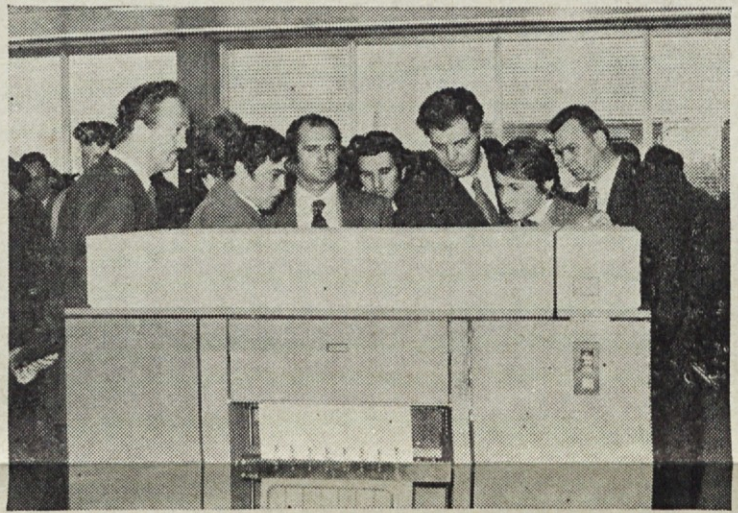
Gostje na ogledu v računskem centru

Izobraževalni center Industrije gumijevih, usnjenih in kemičnih izdelkov »SAVA« Kranj