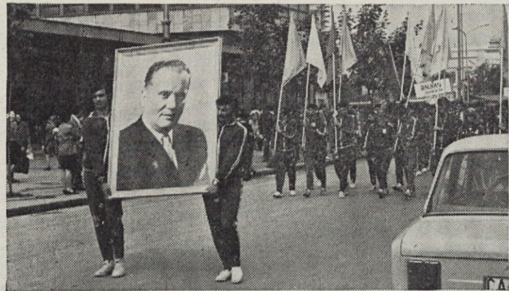
Na čelu povorke so gumarji iz vse Jugoslavije ponesli simbol bratstva in enotnosti — sliko tovariša TITA

približno uri zamude je vlak le odpeljal. Hitro smo se razmestili v svojem vagonu, potegnili na dan rekvizite za krajsanje časa: tarok, športne časopise, karte, nekateri bolj zaspani pa so še malo zadremali. Šahisti so organizirali brzo-turnir in ga po štirih urah igranja zaključili.