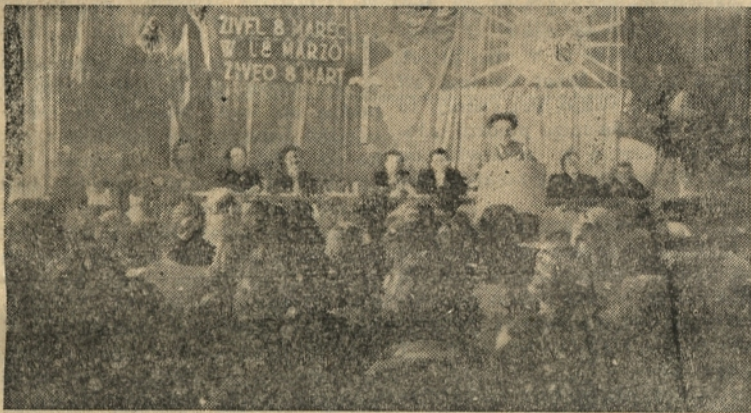
Delegatke so z zanimanjem sodelovale pri delu Kongresa

Iz referata tov. Reschitzove smo spoznale žalosten in težak položaj, v katerem se danes nahaja delovno ljudstvo v Trstu. V družinah vladata beda in lakota, kajti, kjer gospodar dela, njegov zaslužek od daleč ne zadostuje potrebam. Slovenski jezik je preganjan in zaničevan, kot se je to zgodilo v času fašistične Italije. Slovenske šole, kjer sploh še obstojajo, so potisnjene v najslabše prostore. Prav tako so preganjani in izpostavljeni napadom terorističnih tolp vsi oni, ki v Trstu nadaljujejo borbo za doseg