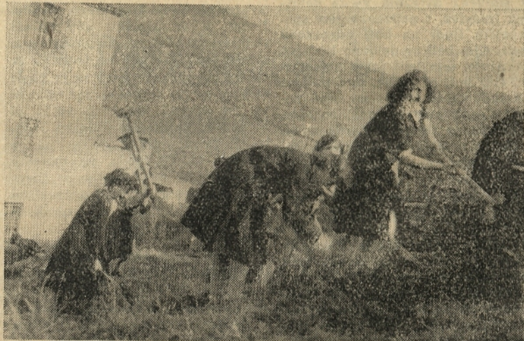
Naše žene so z delom praznovalе svoj praznik — 8. marec