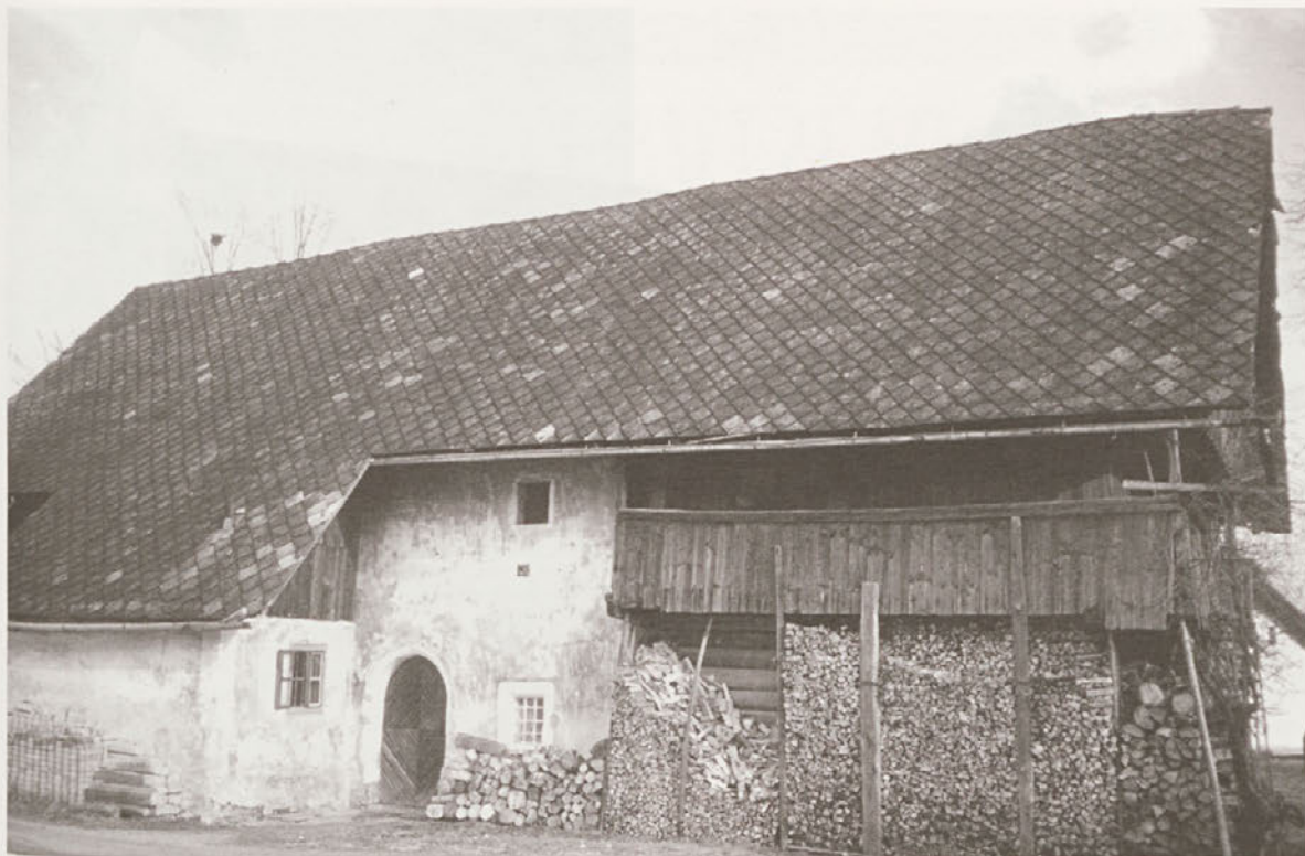
Dolinčkova hiša v Dolu pri Sori pred prenovo

novi problemi in dileme. Do leta 2001 je bilo obnovljeno ostrešje, položena nova kritina cementnega špičaka, rekonstruiran je bil gank, zidani del je pa bil saniran z injektiranjem, z delnim podbetoniranjem sten in z novim zaglajenim ometom. Tudi kamnita portala in okenski okviri so bili restavrirani. Večje težave so bile v pritličnem lesenem delu hiše z vertikalno položenimi bruni, katerega južna stran je bila poškodovana in se je zaradi povečave oken in pod težo nadstropja in strehe že močno posedala. Mnenja statičnih strokovnjakov so zahtevala novo leseno konstrukcijo, na katero bi se pritrdila obstoječa impregnirana in sanirana bruna. To bi seveda pomenilo popolno odstranitev ostrešja in lesenega nadstropja in tako rekoč popolno rekonstrukcijo. Raje smo se odločili za restavratorske posege, ki so predvidevali vgraditev železnih sider in utrjevanje lesa.