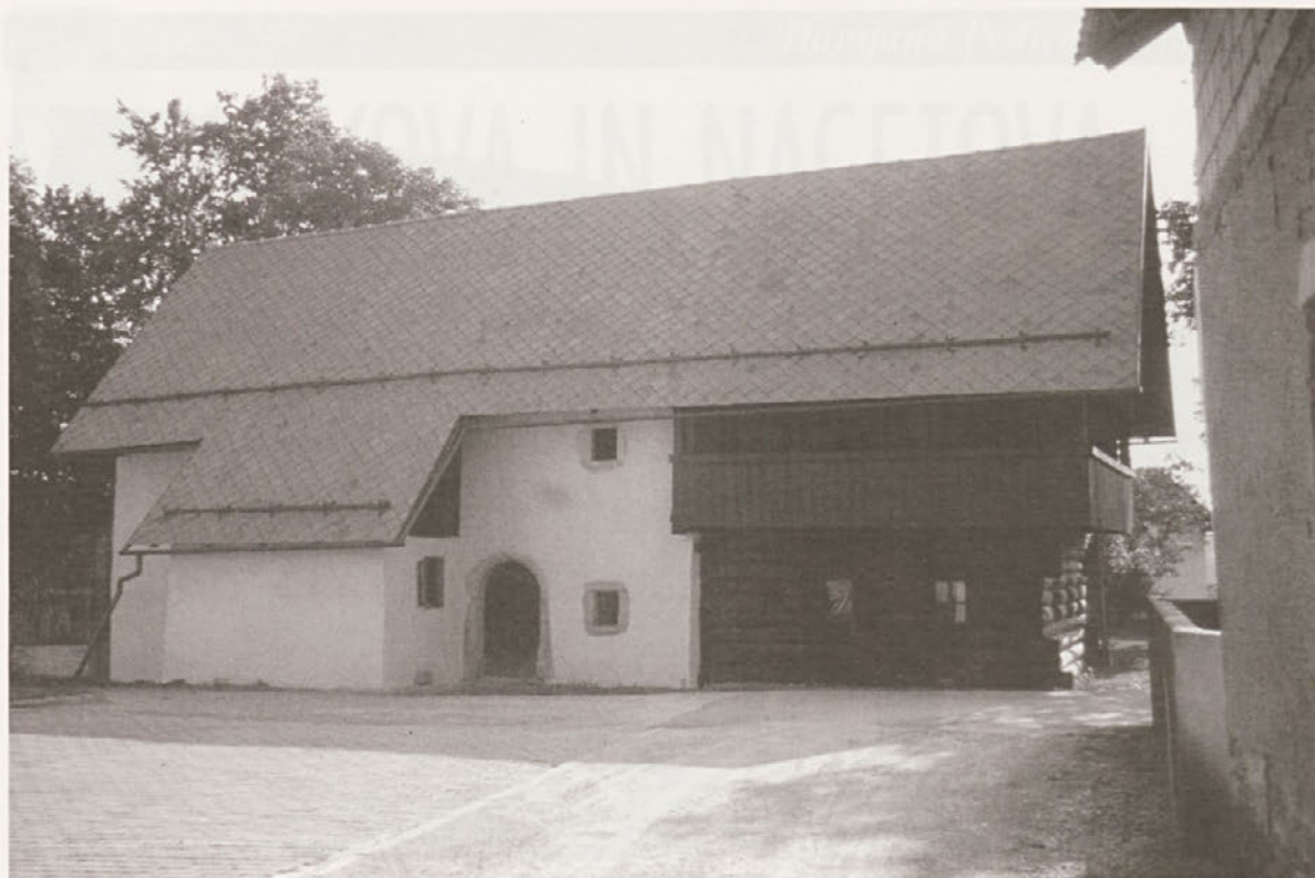
Dolinčkova hiša v Dolu pri Sori po prenovi, foto: Damjana Pediček-Terseglav