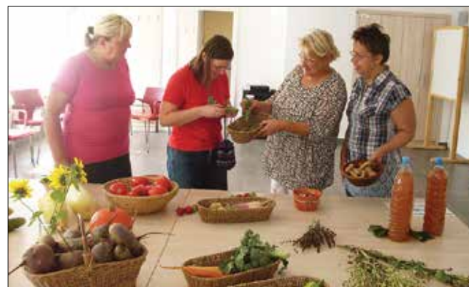
Udeleženci Zelemenjave so si izmenjali tudi ideje in navdihe, povezane z domačim vrtom.

Tokrat so jo pripravili v začetku septembra v prostorih Medgen borze. Poteka vsaj enkrat letno, osnovna ideja pa je, da obiskovalci prinesejo kakšen svoj pride-