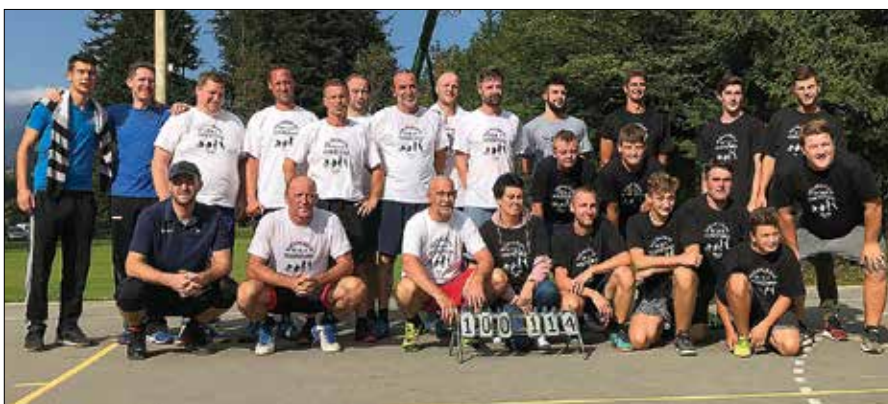
Ekipe Mladi in Stari sta se pomerili v košarki.

je bil rezultat košarkarske tekme, na kateri je ekipa Mladi premagala ekipo Stari.