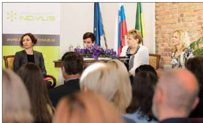
Pobudo je oblikovalo dvanajst regionalnih stičišč nevladnih organizacij iz vse Slovenije.

Stičišča nevladnih organizacij so pobudo Šola za župane prip-