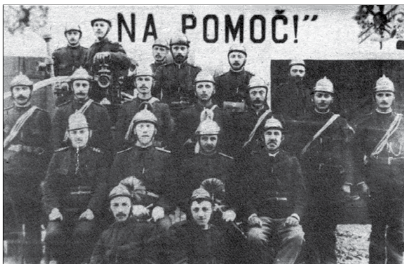
Rečiški gasilci pred mnogimi leti

Takšen je torej bil začetek pozneje zelo uspešnega gasilskega društva na Rečici. Seveda bi bilo odveč naštevati, kako so se z leti bolje opremili. Zaradi hitre rasti društva je kmalu nastala prostorska stiska in rotovžu, zato so leta 1896 zgradili lasten dom. Leta 1958 so ga razširili, 100-letnico društva pa so leta 1982 proslavili z odprtjem novega in sodobnega gasilskega doma v kraju.