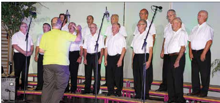
Člani Moškega pevskega zbora KD Mozirje so ob glasbeni spremljavi premierno izvedli pesem, posvečeno Mozirju.