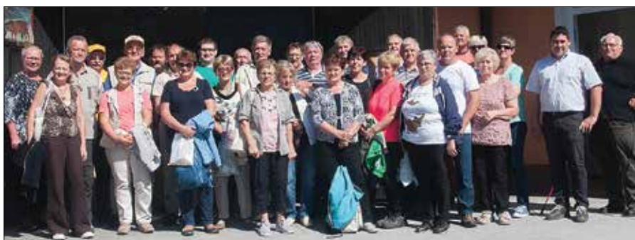
Člani Čebelarke družine Kokarje so si poleg drugih znamenitosti ogledali tudi Čebelarstvo, lectarstvo in apiturizem Šolar v Laškem.