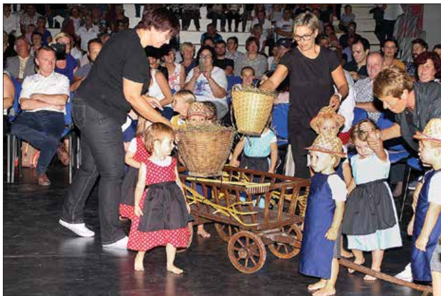
Povezava sedanosti in preteklosti gre najlažje od rok najmlajšim, tokrat otrokom domačega vrtca, ki so z vzgojiteljicami zapeli in zaplesali.