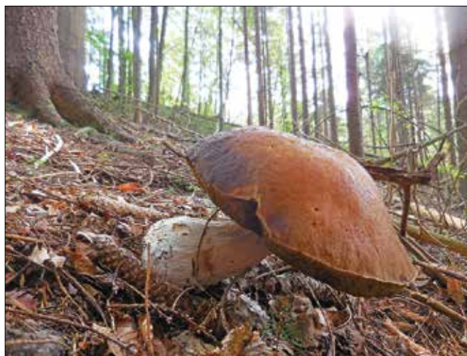
Goban, ki je preživel nabiralce.

Temu sledi evforija na spletnih družbenih omrežjih. Poglejte, koliko smo »jih« nabrali, pod »jih« so seveda mišljeni jurčki, je skupni imenovalac teh hvalisavih objav. Fotografije prikazujejo polne mize gobanov, kot na kakšni veletržnici. Gobarji, ki poznajo težo jurčkov glede na velikost, lahko hitro ocenijo, koliko članov bi morala šteti