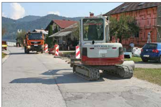
Dela na izgradnji pločnika so v polnem teku.

V sklopu tokratnih del bo izvajalec uredil pločnik od križišča Lesarske ceste s cesto Pod Slatino v dolžini okoli 175 metrov. Pripravili bodo še stojna mesta za javno razsvetljavo, ki bo izvedena v