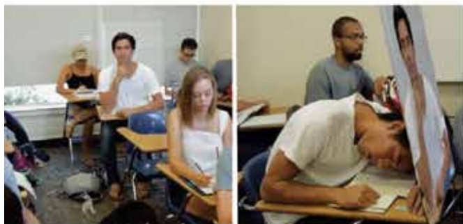
Ne bodite v skrbeh zanj, tako se je prebil skozi srednjo šolo.

Zvedavež: „Takole čez palec bi jih vam dal en par po riti, ker ste izropali mojo „gošo“. Ker sem dobra duša, bi pa vam dal še eno ali dve okoli ušes za „trinkelt“.“