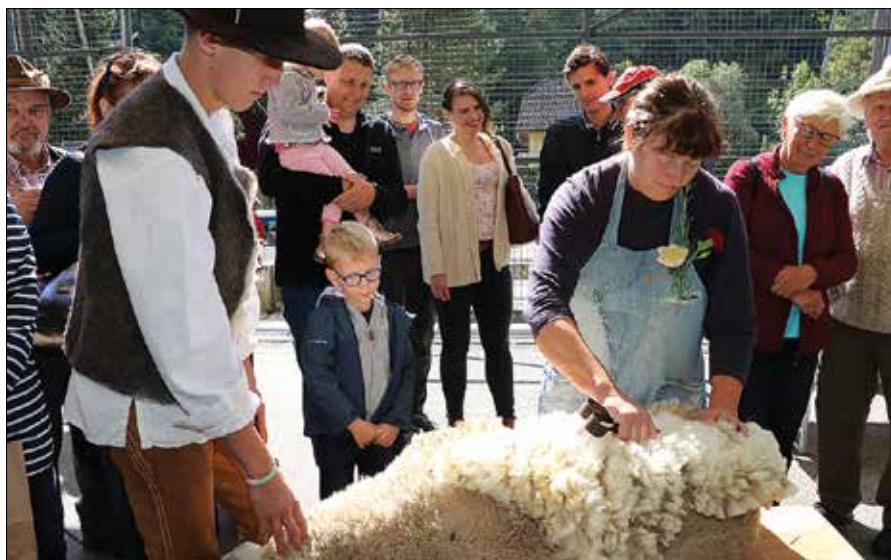
Prikazali so tudi striženje ovce na tradicionalen ročni način.