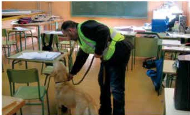
Išči plonk listke, Runo, išči!

Študent: „Letos bom pa težko izdelal letnik.“