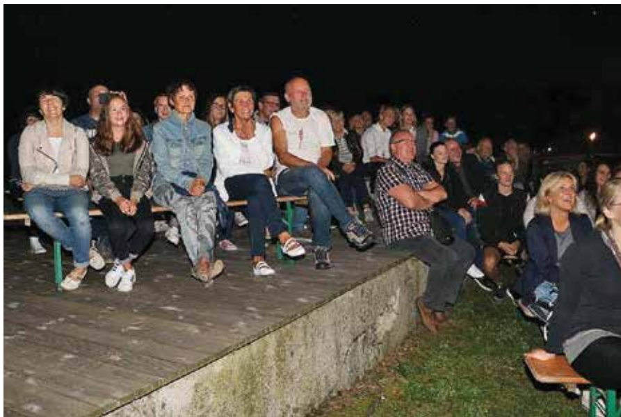
Prireditev je bila darilo občanom ob njihovem občinskem prazniku.