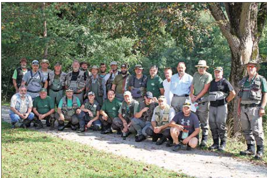
Ribiči so v času počitka med dvema polčasoma izmenjali izkušnje, vmes pa stopili tudi pred fotografski objektiv.