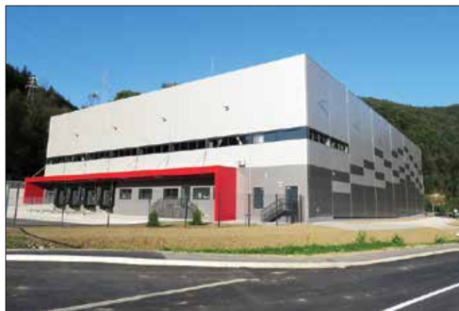
Zgradba novega skladiščno-logističnega centra že kaže svojo končno podobo.

do upravljali z novimi procesi skladiščenja.