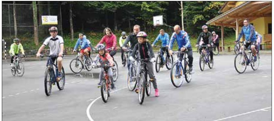
Trim kolesarjenja se je udeležilo 56 kolesarjev.