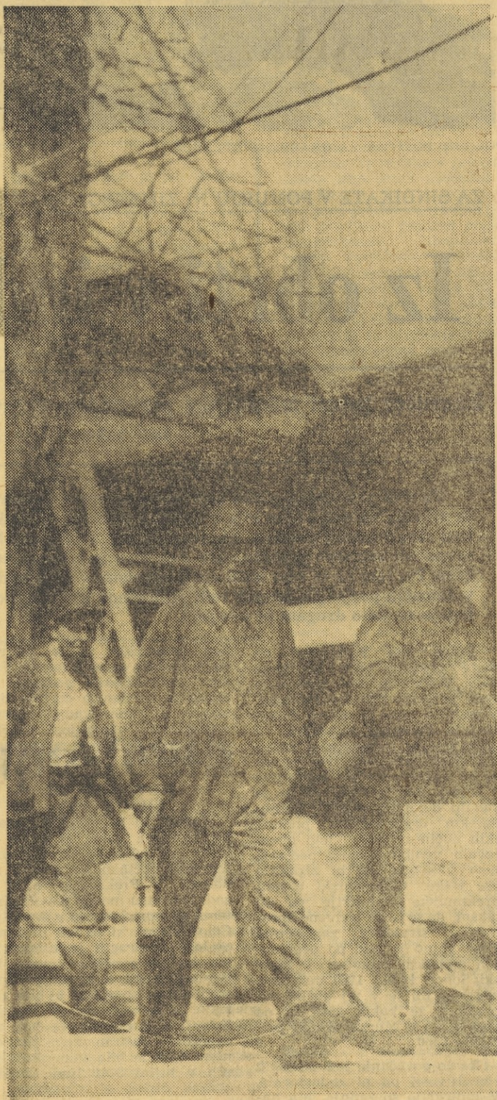
ZADNJI SIHT ZA VELENJSKE KNAPE