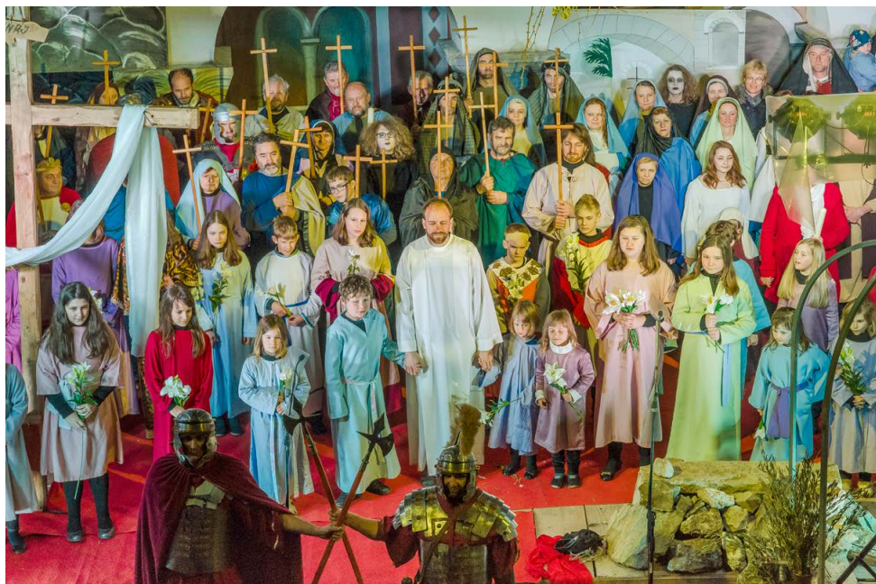
Zaključni prizor s slovesno zapeto Händlovo Alelujo . Župnijski atrij, 2015.