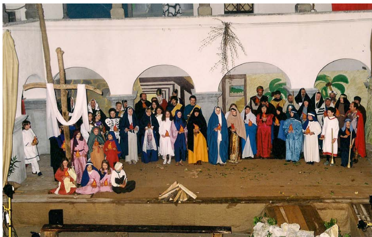
Zaključni prizor z binškojnimi ognji v rokah. Župnijski atrij, 2000.