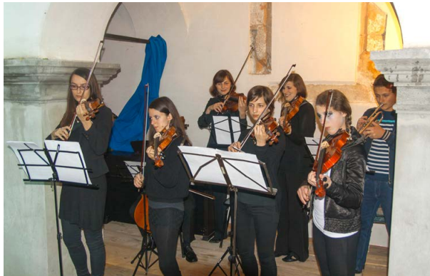
Pasijonski orkester. Župnijski atrij, 2014.