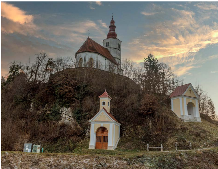
Marija Gradec pri Laškem, 2021.