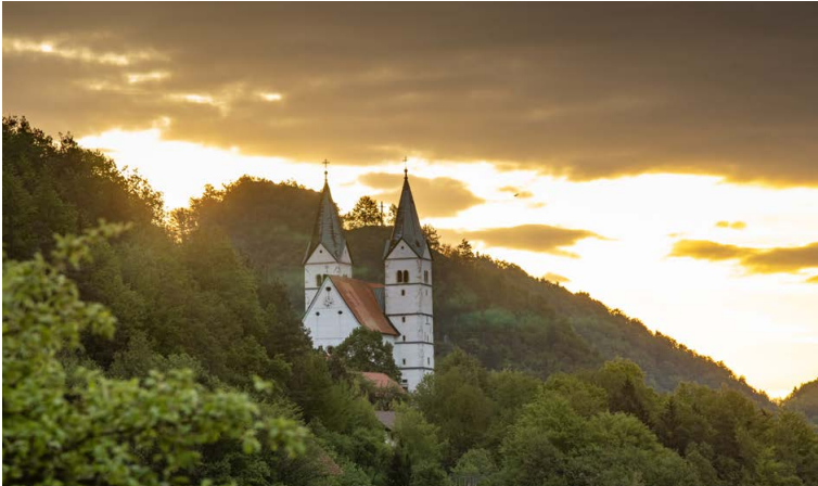
Šmihel nad Laškimi, 2021.