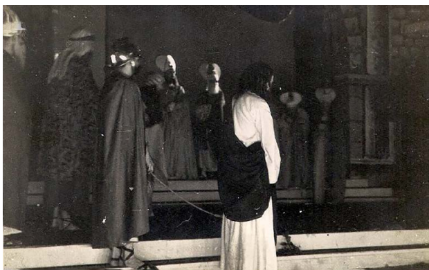
Gregorinov pasijon v Laškem leta 1936