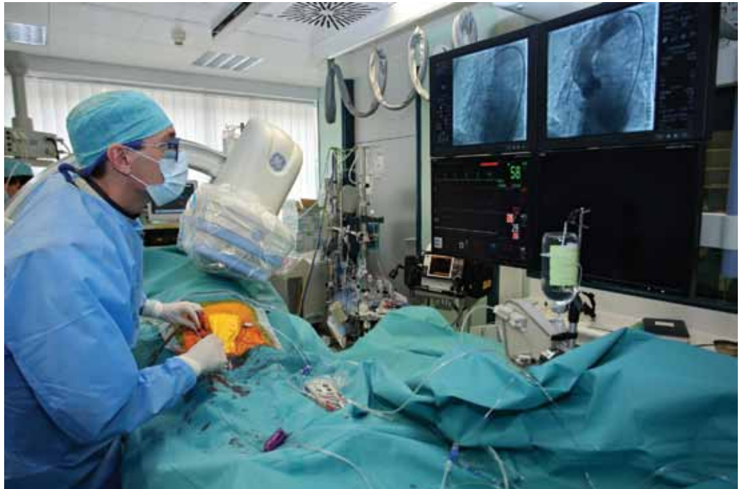
Slika 3: Katetrski laboratorij. Poseg poteka v sterilnih razmerah ob uporabi rentgenske diaskopije. Desno prikaz po uspešni vstavitvi perkutane zaklopke.

prekatom in aorto (t.i. gradient „peak-to-peak“) je znašala 68 mmHg. Aortna zaklopka je bila videti močno kalcinirana in slabo gibljiva. Levi prekat je bil normalno velik z dobro sistolno funkcijo. Desnostranska srčna kateterizacija ni bila narejena. Selektivna koronarna angiografija ni pokazala zožitve na koronarnih arterijah. Pri bolnici bi bila zaradi hude simptomatske stenoze potrebna kirurška zamenjava aortne zaklopke. Euroscore za oceno operativnega tveganja je znašal 8 oz. logistično 9,52 %. Bolnica je bila zaradi pridruženega karcinoida in posledične večje verjetnosti medoperativnih krvavitev zavrnjena za klasični operativni poseg. Dodatno smo opravili še CTA (računalniško tomografijo–angiografijo) medeničnih arterij za izmero premera stegenskih in iliakalnih arterij, ki je znašal 8-10 mm na desni in levi strani, kar omogoča perkutani poseg. Izbrana je bila za perkutano vstavitve aortne zaklopke.