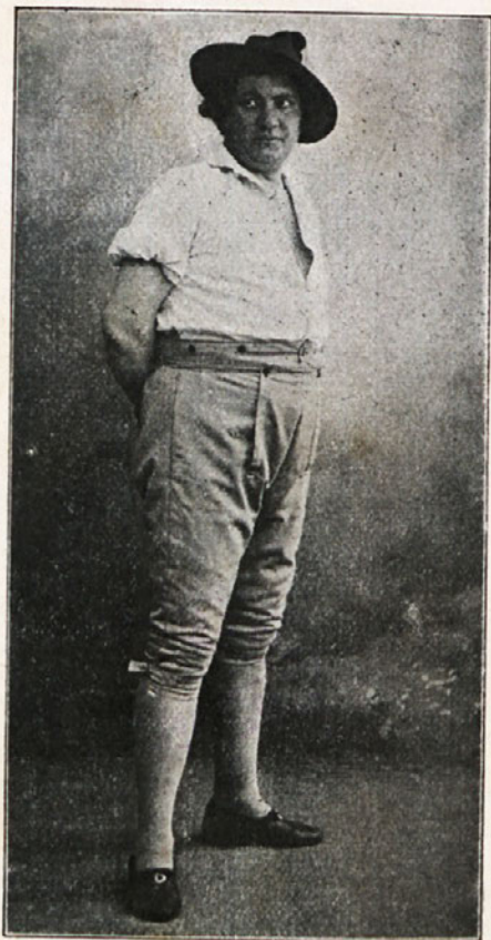
MARTIN KRPAN: A. Verovšek.