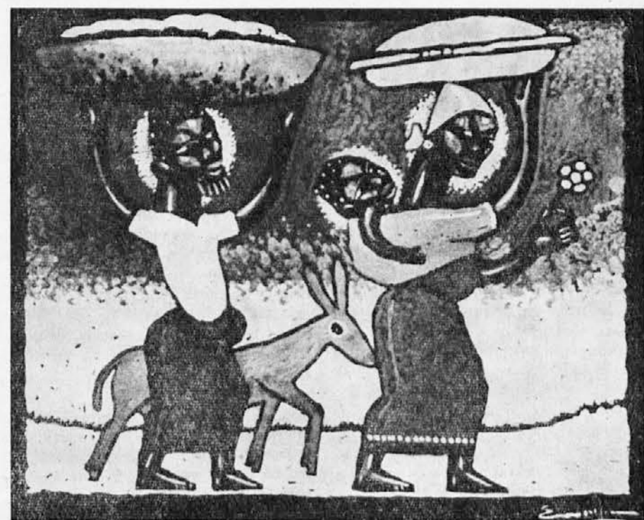
Primitivna črnska umetnost: Beg v Egipt

Kino je tipičen jezik, različen od književnega: prvega sestavljajo podobe, drugega besede. Tudi podoba je prav tako kot beseda znak: hoče torej nekaj izraziti, kar gre preko tega znaka. Beseda je znak neke ideje, nekega pojma, medtem ko kaže podoba vse konkretne vidike ne-