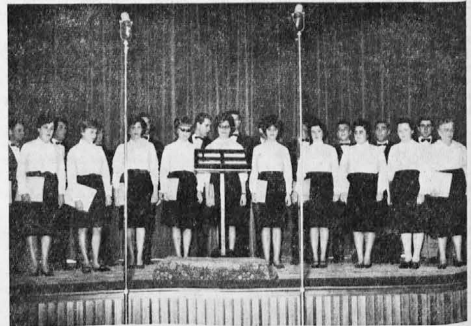
Skedenjski cerkveni pevski zbor pri nastopu mestnih pevskih zborov v Trstu