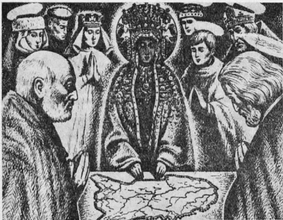
Čenstohovska Marija sredi poljskih svetnikov. Pred seboj ima zemljevid svobodne Poljske, čigar meje predstavlja rožni venec