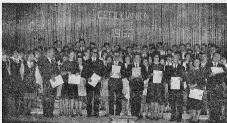
Združeni pevski zbori in posamezni pevovodje na letošnji Cecilijanki v Gorici

Nagrade: Ocenjevalna komisija, ki so jo sestavljali priznani strokovnjaki iz naše in iz sosednih pokrajin, je nagrade tako določila: V skupini moških zborov si je pridobil prvo mesto zbor »Giuseppe Verdi« iz Ronk. Drugo mesto zbor »Solvay« iz Tržiča in tretje mesto zbor »Antonio Illesberg« iz Trsta. Nagrade mešanim zborom pa so bile tako razdeljene: prvo nagrado je odnesel zbor »Tartini« iz Trsta, drugo nagrado zbor »Novo coro Montasio« iz Trsta, tretjo pa zbor »Sv. Ignacija« iz Gorice. Nagrade so bile dobro razdeljene,