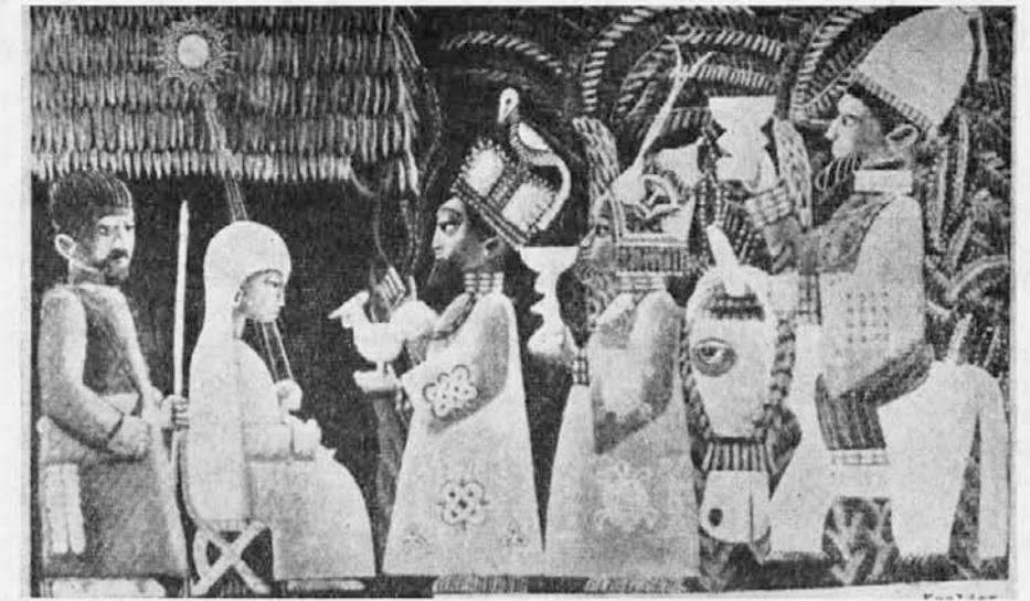
Neznan umetnik iz Nigerije: Poklonitev Treh kraljev