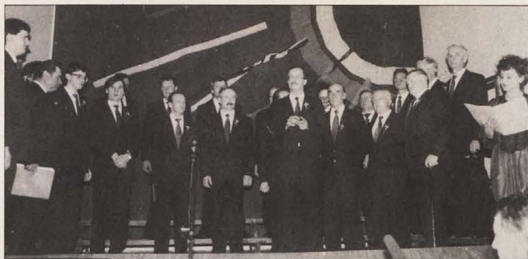
Društveni zbor med koncertom; nekaterim pevcem so izročili tudi priznanje za dolgoletno sodelovanje