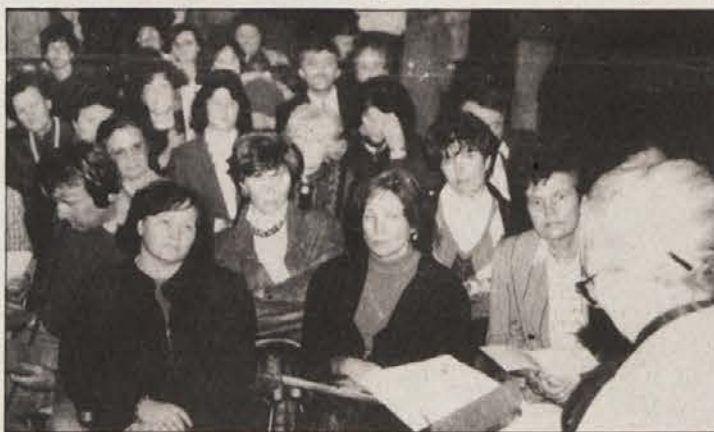
Udeležence so pozorno sledile referatu predsednice ZSZ