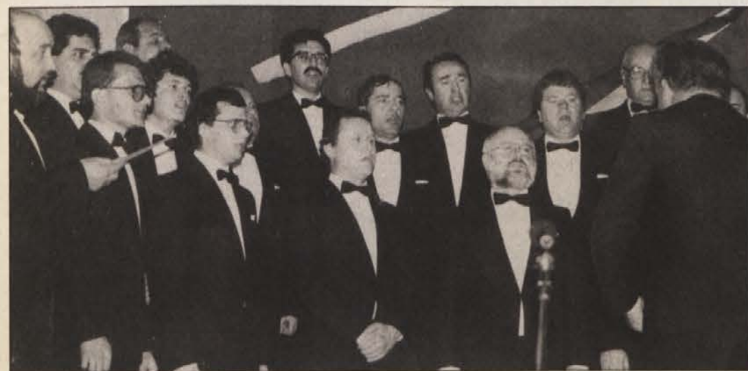
Pevski zbor „Vres“ s Prevalj z zborom „Foltej Hartman“ goji tesne prijateljske vezi