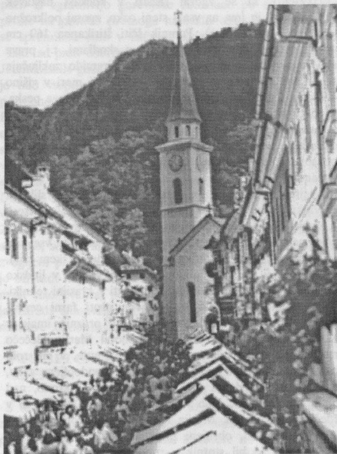
Pogled na glavno tržiško ulico v času Šuštarške nedelje.