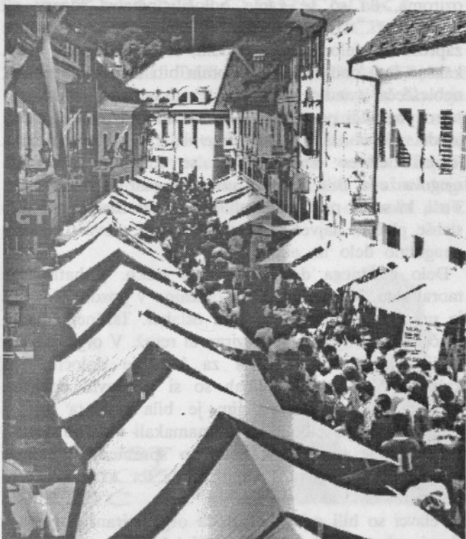
Pogled proti južnemu delu tržiškega »pvaca« na Šuštarstvo nedeljo.

Z izgradnjo solidne ceste iz Jelendola se je spremenil tudi način transporta. To ni bila več večinoma volovska vprega, ampak pravi dvoosni voz s konjsko vprego z enim ali dvema konjema. Kdo so bili furmani iz doline in okolice. Večinoma so bili Bornovi hlapci in hlapci večjih posestnikov iz Doline in okolice pa tudi sami