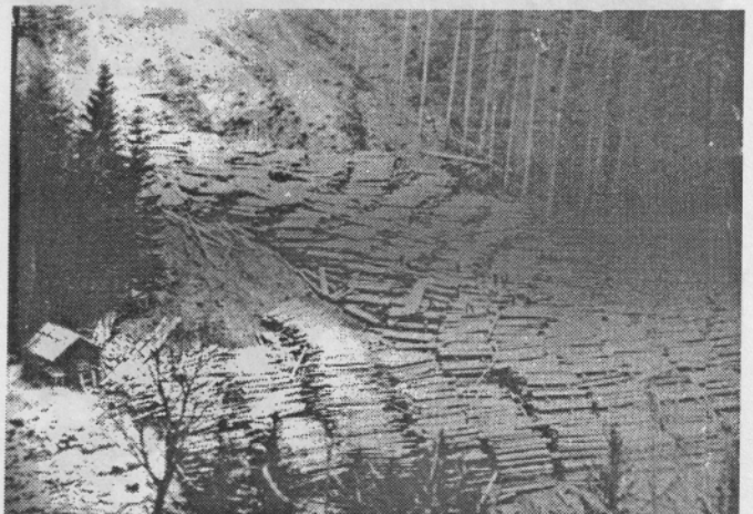
Skladišče hlodov v Jelendolu pred 1. svetovno vojno.