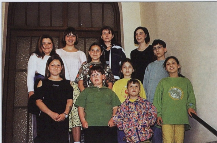
Šolarji so spet začeli s poukom.