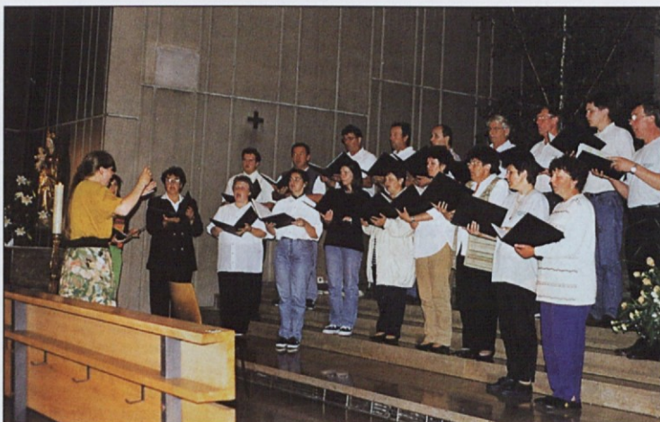
MePZ sv. Mihael iz Olševka je zapel po maši še v prezbiteriju.