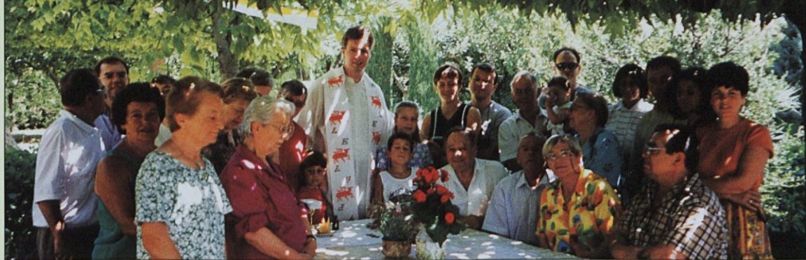
Boga smo slavili pod zeleno streho "cerkve" v naravi.