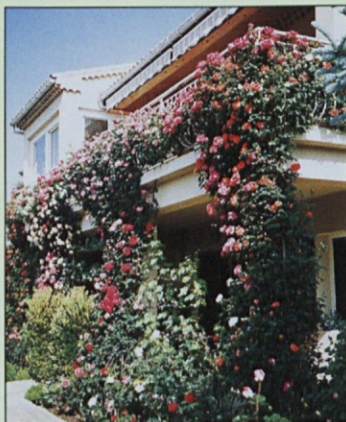
Ferjančičev dom v Pertuisu je hiša cvetja.