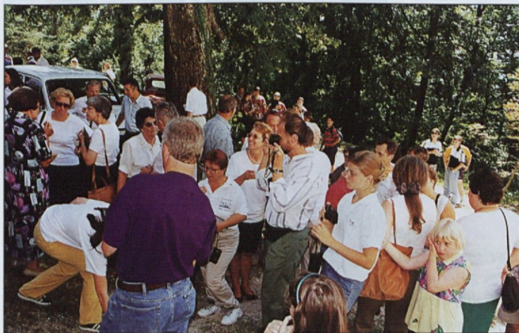
Pred cerkvijo na Brinjevi gori je bilo zelo živo.

Kar nekaj rojakov je v tem času obiskala tudi bolezen in nekateri so