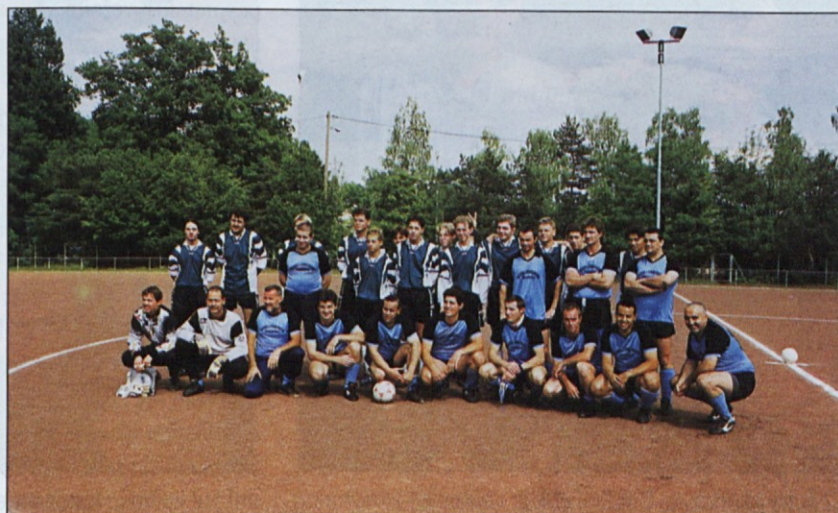
(Stuttgart) Prijateljska nogometna tekma Slovenija–Stuttgart: Urugvaj–Sindelfingen

Odšla sta in krenila proti župnišču. Gospodinja, župnikova sestra, je bila lepih hrušk silno vesela. Tevžu je