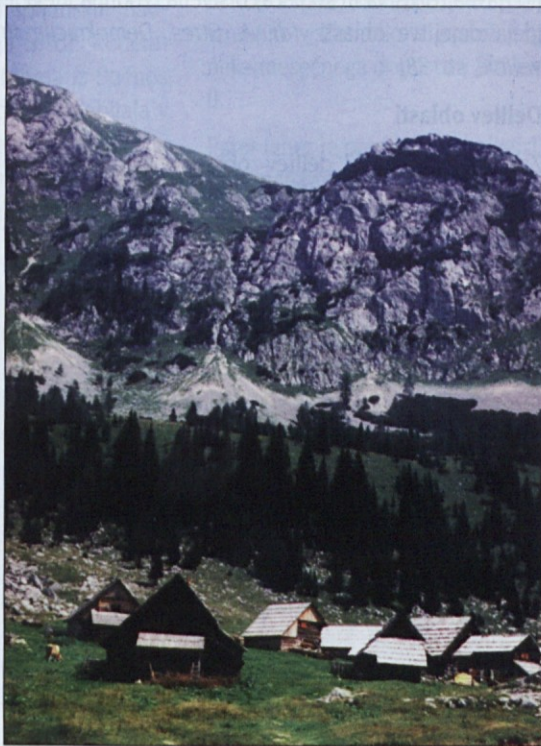
Planina Laz nad Bohinjem

Prihodnosti ni mogoče graditi na neresničnih zgodovinskih domnevah, na poneverjanjih in lažeh.