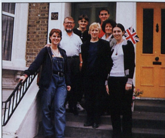
Prijetni Brežičani med počitnicami v Našem domu