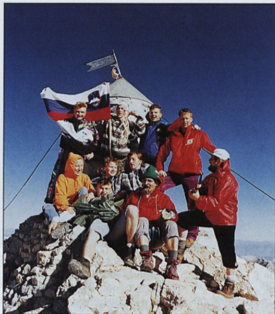
Del letošnje odprave na vrhu našega očaka