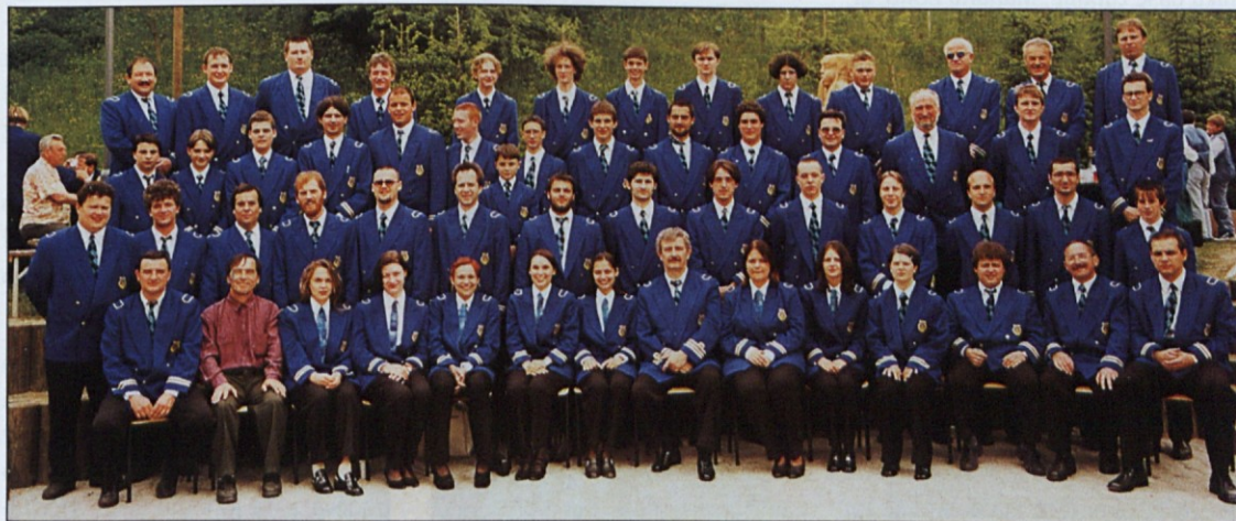
Pihalni orkester železarjev Ravne (trikratni svetovni prvak) je obiskal Slovence v Berlinu.