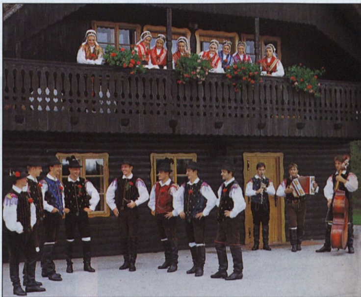
Na Slovensko oziram se stran.

Za seboj imate 20 let uspešnega dela. SLOVENSKA SKUPNOST v GRADCU vam ob tem jubileju prischčno čestita in izreka zahvalo za duhovno, kulturno in gmotno pomoč.