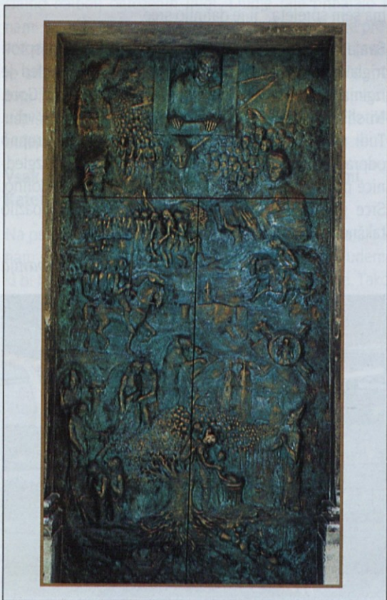
"Slovenska vrata" – glavna vrata v stolnico sv. Nikolaja v Ljubljani

Ime skupnosti je zaživelo v krščanski tradiciji torej tudi kot obče ime za tiste zgradbe, v katerih se zbira krščanska občina k obhajanju evharistije in k podeljevanju zakramentov in v katere prihajajo tudi posamezni molivci, da častijo Kristusa, pričujočega v tabernaklju pod podobo kruha.