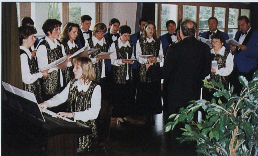
(Amoiswil) Mešani pevski zbor Sv. Jakob iz Jakoba pri Šentjurju blizu Celja

Zdaj je piranski župan naposled sprejel sklep o pričetku postopka oddaje naročila za gradbena in obrtniška dela za ureditev te pešpota. Dela bodo tekla v dveh fazah. Prva faza bo obsegala zaustavitev plazov ob poti, ureditev podpornih zidov in zidov za zadrževanje hudourniškega kamenja. Pot, ki bo v celoti tlakovana, bo dolga 1,2 kilometra, širina pa je različna: pri vhodu pri župnišču bo