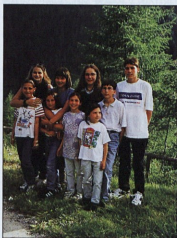
Utrinek s šolskega izleta