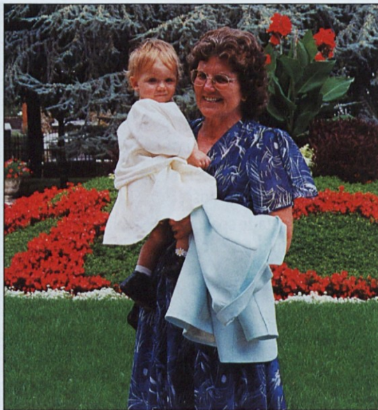
(Pariz) Fabčičeva stara mama z vnukinjo

Sem od Golice je pihal hladen veter ter pred sabo podil odpadlo rumeno listje. Naznanjal je, da se bližajo kratki dnevi in dolge noči. Od slane ozeble senožeti so zaspano samevale, kot bi se v svoji nemoči pogrezale v počasno umiranje. Nič se ni ganilo, nobeno živo bitje, samo jate lačnih vran so se podile čeznje ter se končno