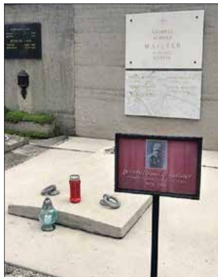
Maistrov grob na Pobrežju v Mariboru

V času svoje vojaške kariere v Avstro-Ogrski je Rudolf Maister dobil tri odlikovanja. Prvega - jubilejno medaljo - leta 1898, ob 50-letnici vladanja cesarja Franca Jožefa. Ob 60-letnici vladanja istega cesarja je prejel jubilejni križec. Med prvo svetovno vojno je dobil še bronasto vojaško zaslužno medaljo. Navedena avstroogrška odlikovanja niso imela prav velike teže, a bolj žalostno je, da v novi državi, ki ji je prabil pomemben del ozemlja, ni dobil velikih odlikovanj.