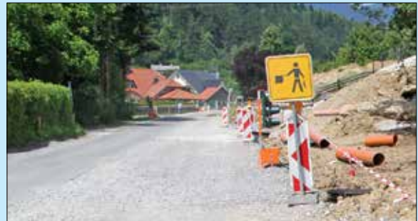
Topovski projektil so našli delavci pri gradbenih delih na Šmihelski cesti v Mozirju.

Mozirje: 29. maja ob 14.58 so na Šmihelski cesti v Mozirju pri gradbenih delih delavci našli topovski projektil, premera 150 mm iz obdobja druge svetovne vojne. Pripadnika Državne enote Civilne zaščite za varstvo pred neeksplozivnimi ubojnimi sredstvi zahodnoštajerske regije sta projektil izkopal in prepeljala v začasno skladiščenje.