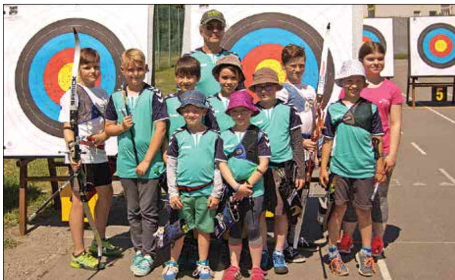
Posamični in ekipni državni prvaki z gornjegrajske šole