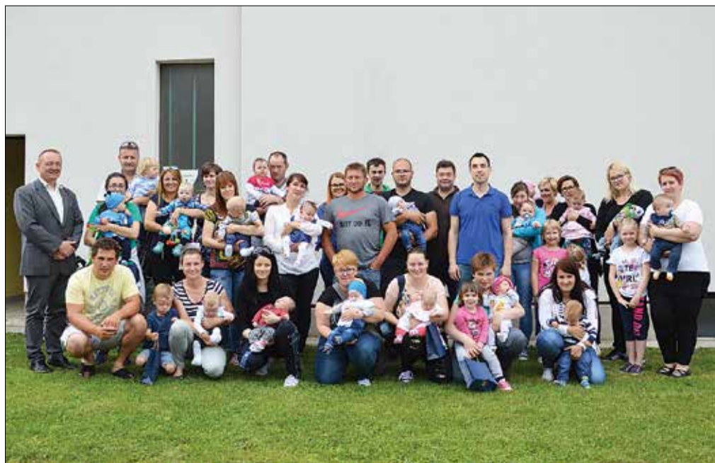
Mlade družine, ki so lani ali v prvih letošnjih mesecih dobile naraščaj, so se zbrale na sprejemu, ki ga je pripravila občinska uprava.