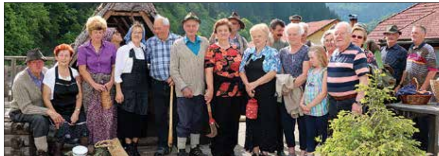
Lučki upokojenci ob skorjevki v »zgornji vesi« pred selitvijo na novo lokacijo