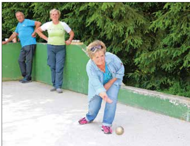
Na balinišču se je pomerilo devet žensk in trije moški.