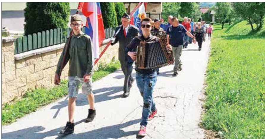
Na pohod se je podalo preko sedemdeset udeležencev.