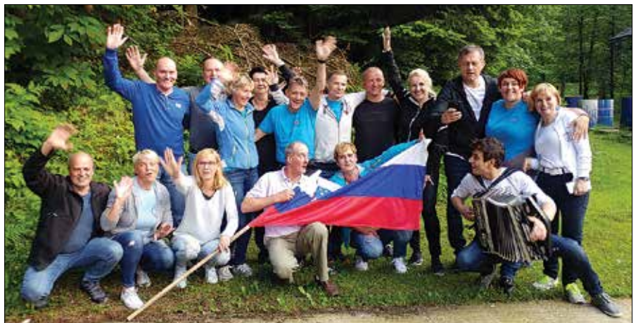
V Račneku se že pet let na nekdanji dan mladosti zberejo »mladinci« iz vrst nekdanjih pionirčkov.