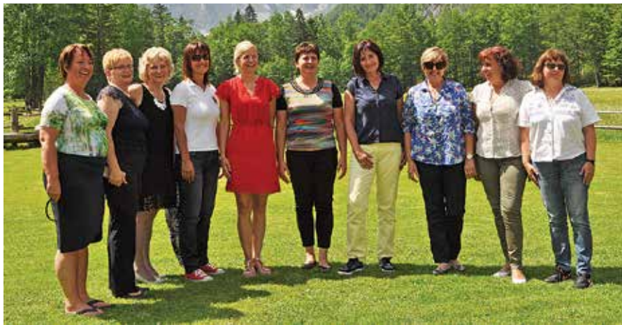
Slovenske županje so v penzionu Ojstrica v Logarski dolini na okrogli mizi govorile o zelenem javnem naročanju.