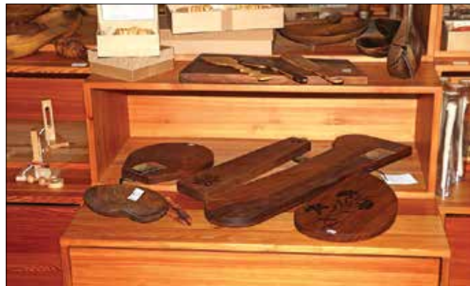
Uporabni izdelki iz lesa so bili okrašeni tudi z različno ornamentiko.

Na razstavi si obiskovalci lahko ogledajo umetnine in uporabne izdelke iz lesa različnih avtorjev vse