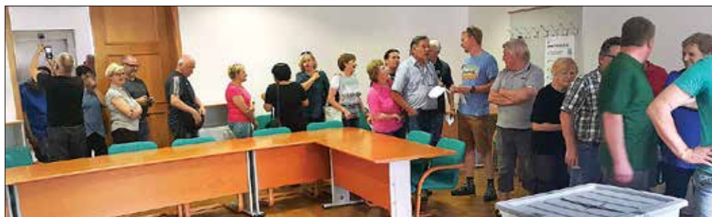
Krajanje Nizke in Varpolj so se množično napatili na predčasno glasovanje na sedež okrajne volilne komisije v Mozirju.