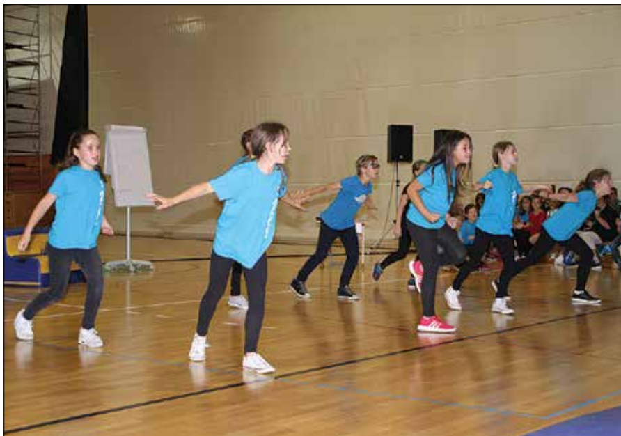
Plesalci so pokazali dobro obvladovanje ritmov različnih glasbenih stilov.