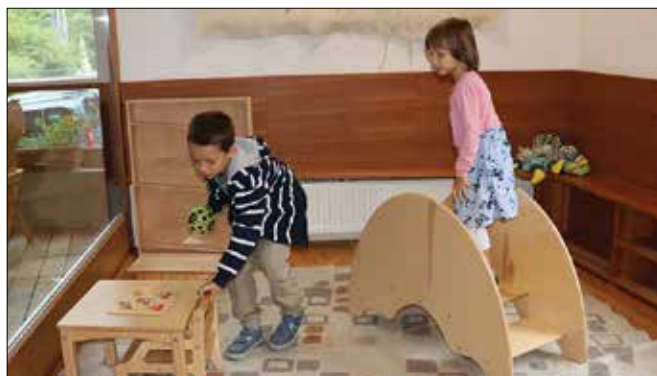
Izdelke LESeK narejene po montessori pedagogiki so z zanimanjem preizkušali tisti, ki so jim namenjeni – otroci.

Da je les v Solčavi še kako uporabljen, pričajo tudi umetnine izdelane z motorno žago. Te so na ogled postavili kiparji z motorno žago društva Carving Team Logarska dolina.