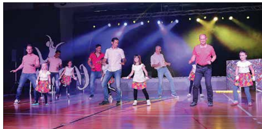
Očetje so s hčerkami odplesali twist.

čani,« pravi Štancarjeva, ki se koreografij nauči prva in jih nato predaja svojim plesalcem. Prepričana je, da le tako lahko pomaga otrokom pri ustvarjanju plesnih zgodb, in jih spodbuja, da tudi sami pripravijo svoj program.