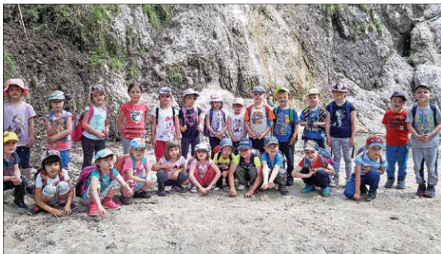
Varovanci vrtca Ljubno pri slapišču Palenk

Naslednji dan nas je po zajtrku obiskal gozdni pedagog g. Marko, ki nas je popeljal v gozd in nam razložil pomen gozda in življenja v njem. Gozd smo začutili tudi z vsemi čutili (tip, vonj, okus, sluh, vid). Z njim smo se igrali razne igre, kot so Fotograf, pogled v krošnjo s pomočjo ogledala, Netopir in vešče, ki je bila otrokom zelo všeč. Otroci so aktivno sodelovali in uživali.