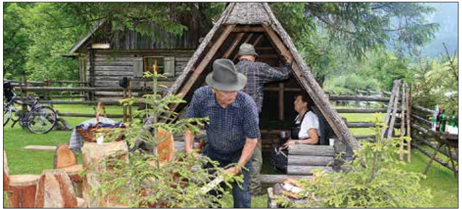
Skorjevka, v kateri se bodo družili upokojenci, je našla prostor v nastajajočem muzeju.

Ideja o izgradnji skorjevke so dobili pred še-