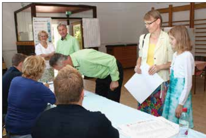
Volivci v Šmihelu so ponosni na svojo številčno udeležbo na volitvah ali referendumih.

Sledijo SMC s 6,43 odstotka, Leвица je zbrala 5,97 odstotka, SD 4,77 odstotka, DeSUS je zbral 4,32 odstotka, SNS 4,18 odstotka, SAB 3,76