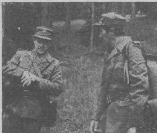
Dogovor pred akcijo

Odločujoči dejavnik za njihov uspeh pa je tudi pripadnost, ki jo člani enote čutijo do tega dela Ljubljane, saj večina v njem tudi živi in dela. Mnogi izmed njih so pripadniki te enote že več let in ljudje, zlasti v hribovskih predelih naše občine, jih že kar dobro poznajo. So kmetije, pravijo, kjer se že počutimo kot doma.