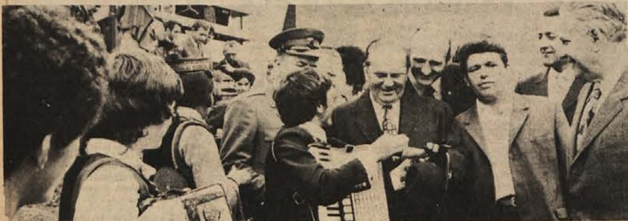
Tovariš Tito je bil borec v vojni in je borec v miru – vedno prežet s humano mislijo za dobro človeka, za blagor delavskega razreda, kateremu je vedno zaupal in šel z njim skozi najhujše preizkušnje