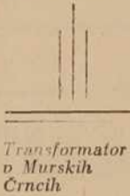
Transformator v Murskih Črncih

Okrajni odbor SZDL je zadalžil na tej seji okrajni svet za gospodarstvo, da čim prej skliče posvetovanje zastopnikov našega, mariborskega in ptujskega okraja na širše