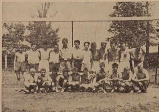
Pionirsko nogometno moštvo iz Beltincev skupaj s pionirji iz M. Sobote

čutiti predvsem v naših podeželskih partizanskih društvih. Razen tega tudi na splošno telesno vzgojo pre-