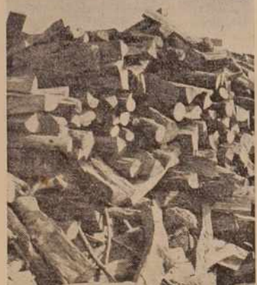
Mar. je res samo les edina »aktivna« postavka v delovnanju kmetijske zadruge?