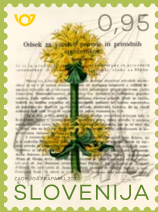
Priložnostna znamka, ki jo je Pošta Slovenije izdala ob 100-letnici Spomenice .

Spomenica je zgleden primer, kako napisati sporočilo politikom: najprej je na eni strani povzeto sporočilo v zgoščeni in jasni obliki ter v nadaljevanju pribito s konkretnimi, a izvedljivimi predlogi. For children and ministers , kot so pred leti tak način pisanja označili avtorji ruske publikacije o biotski raznovrstnosti. To ne pomeni omalovaževanja ministrov, ampak upoštevanje dejstva, da imajo praviloma ministri zelo široko delovno področje in potrebujejo za odločitev, ki jo morajo sprejeti v kratkem času, kristalno jasne strokovno utemeljene predloge.