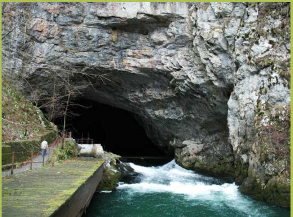
Posebno pozornost so pripravljavci Spomenice posvetili varstvu jam in jamske favne. Planinska jama (na sliki) je zaradi velikega števila troglobiontov in zlasti razmeroma lahke dostopnosti že od nekdaj v središču pozornosti biologov in tudi zbirateljev. Planinska jama je sicer po podpisu Rapalske pogodbe , sklenjene 12. XI. 1920 med Kraljevino SHS in Kraljevino Italijo, pripadala slednji.

V luči nastajajoče države postane poudarjanje pomena varstva narave za državotvornost razumljivo, hkrati pa je to tudi utrjevanje pomena in vloge matične