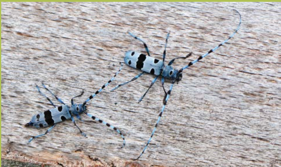
Prvi predlogi za zavarovanje niso temeljili na podatkih o ogroženosti, ampak predvsem na posebnem odnosu do posamezne vrste. To velja tudi za alpskega kozlička ( Rosalia alpina ), ki je to posebno mesto ohranil na prilogi Direktive o habitatih .