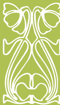
Secusijski okrasek na koncu originalnega besedila Spomenice .