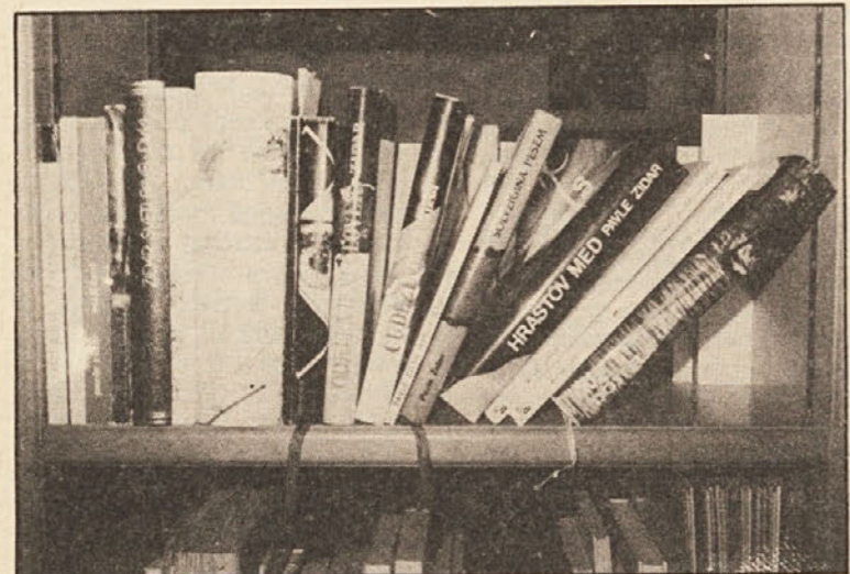
Slovenski pisatelj Pavle Zidar je doslej objavil šestinpetdeset knjig. Na sliki vidite izbor najboljših del prozaista, ki je bistveno obogatil naše slovstvo.