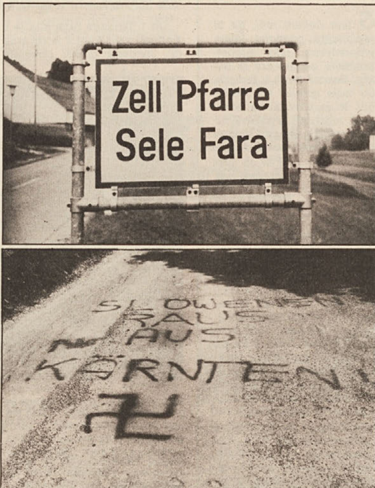
Zgornja slika: dvojezični selski krajevni napis: žandarmerija je odstranila sledove mazaške akcije še v jutranjih urah. Spodnja slika: na Koroškem se spet pojavljajo protislovenske hujskaše parole.

Selski izgredi dobijo predvsem potem zelo hud prizvok, če pomislimo, da je ta kraj pod nacifašizmom najbolj trpel in je terjal trinajst nedol-