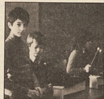
Otroci imajo veselje z glasbili.

govorne in glasbene vaje — predvsem z govorom imajo nekateri težave. Otrok pa se hitreje nauči pesmice in jih tudi bolj čustveno posreduje,“ nam je rekel. Za zaključek seminarja pa so udeleženci staršem in obiskovalcem igrali dve glasbeni pravljici: eno o petelinčku, ki je najboljši pevec na svetu, drugo pa o gumbu.