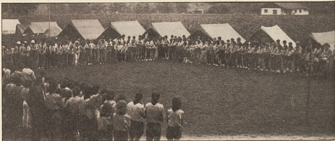
„Nova Globasnica“: štiristo skavtov se je zbralo v Podjuni

Slovenski Koroški skavtje praznujejo letos petindvajsetletnico. Ta jubilej so praznovali zadnjih štirinajst dni na taborenju v Globasnici. Skupno s Slovenskimi koroškimi skavti so taborili tudi prijatelji iz Gorice in Trsta. Ko smo se pripeljali v Globasnico, smo domačine povprašali, kje da taborijo skavtje?