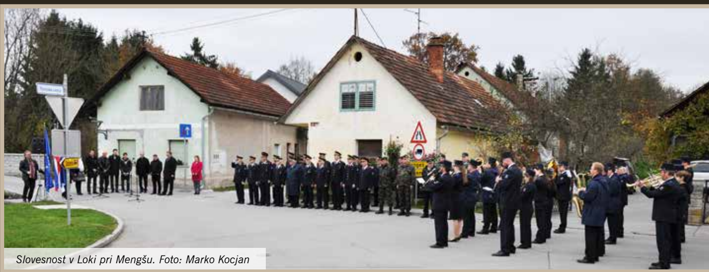
Slovesnost v Loki pri Mengšu.