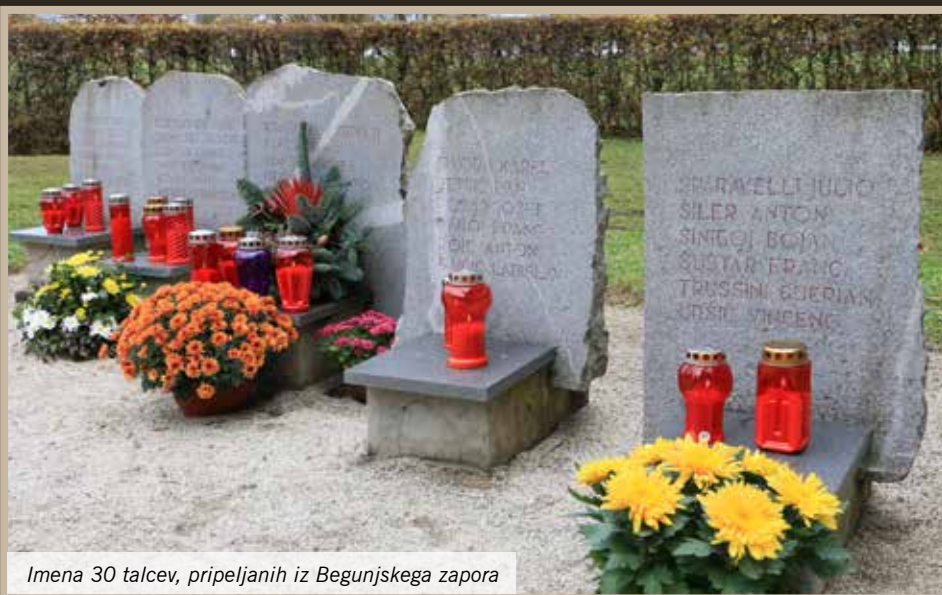
Imena 30 talcev, pripeljanih iz Begunjskega zapora