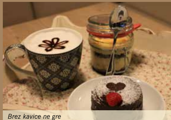
Brez kavice ne gre