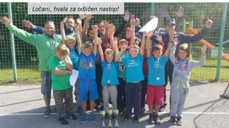
Ločani, hvala za odličen nastop!