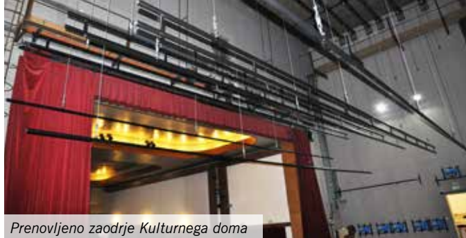
Prenovljeno zaodrije Kulturnega doma