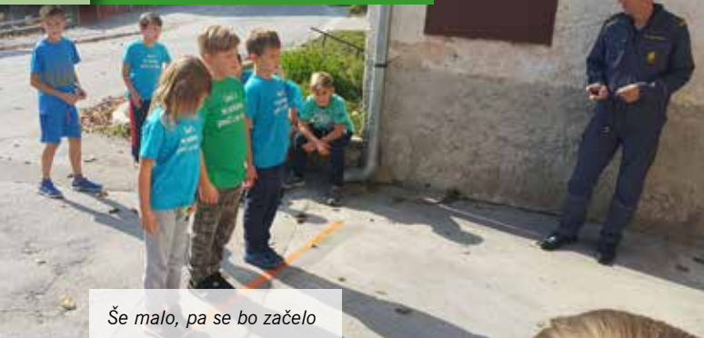
Še malo, pa se bo začelo