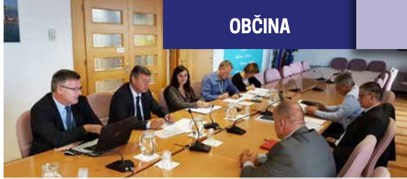
Manjkajoči del obvoznice naj bi bil po predvidevanjih dokončan v letu 2018

Besedilo in foto: Občinska uprava Foto: Urban Kolar