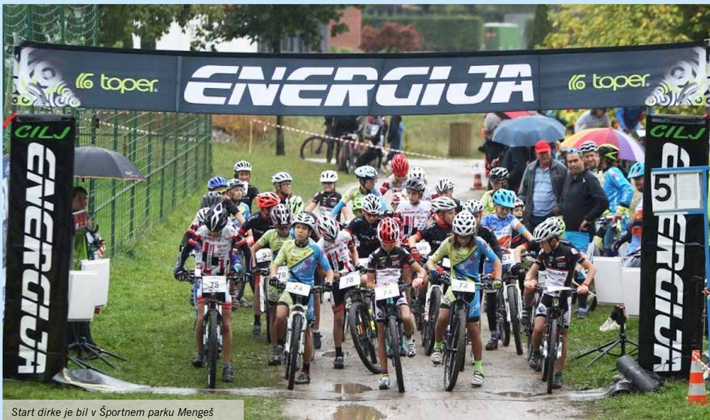
Start dirke je bil v Športnem parku Mengeš