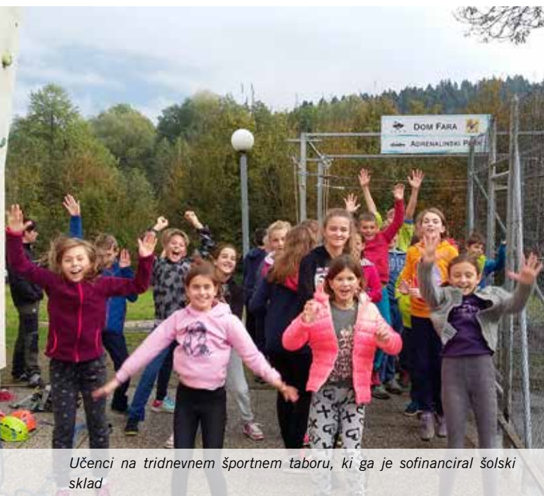
Učenci na tridnevnem športnem taboru, ki ga je sofinanciral šolski sklad