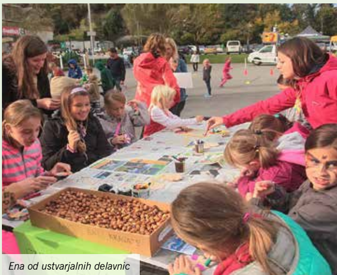
Ena od ustvarjalnih delavnic

Od 3. do 9. oktobra 2016 smo v Sloveniji zaznamovali Teden otroka. Gre za projekt, ki je pod okriljem Zveze prijateljev mladine Slovenije in vsako leto poteka na začetku meseca oktobra. Vsako leto ima tudi osrednjo temo, ki jo na srečanju državnega otroškega parlamenta izberejo otroci sami. V letošnjem letu bodo učenci slovenskih osnovnih šol razmišljali o temi »Svet, v katerem želim živeti«. Na naši šoli bodo učenci temo obravnavali na sestankih skupnosti učencev šole in na razrednih urah, v mesecu februarju pa bodo o njej razpravljali še na šolskem otroškem parlamentu, na katerega bodo povabili tudi predstavnike lokalne skupnosti.