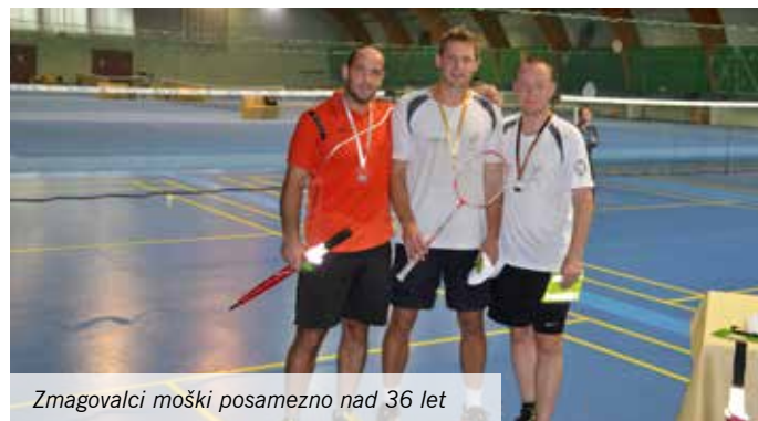
Zmagovalci moški posamezno nad 36 let

Liga je sestavljena iz štirih turnirjev; na turnirjih se izmenično igrajo igre dvojic (ženskih, moških, mešanih) in posameznikov. Tokrat je potekal turnir posameznikov in Mengšani so se odlično odrezali.