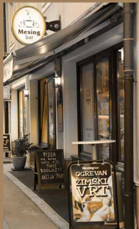
Mesing bar praznuje 18 let obstoja

V našem baru sta tabu temi politika in zasebne zadeve.