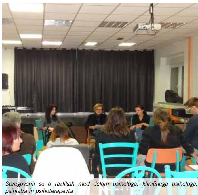
Spregovorili so o razlikah med delom psihologa, kliničnega psihologa, psihiatra in psihoterapevta

11. oktobra smo v AIA - Mladinskem centru Mengeš pripravili pogovorno srečanje v okviru projekta "Vidim prihodnost". Tokrat smo predstavili študij in poklic psihologa in psihoterapevta.