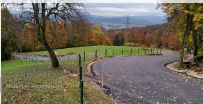
Na novo urejena cesta bo izboljšala prometno varnost na Dobenu