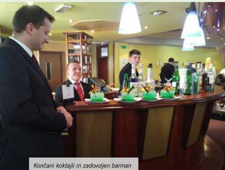
Končani koktajli in zadovoljen barman