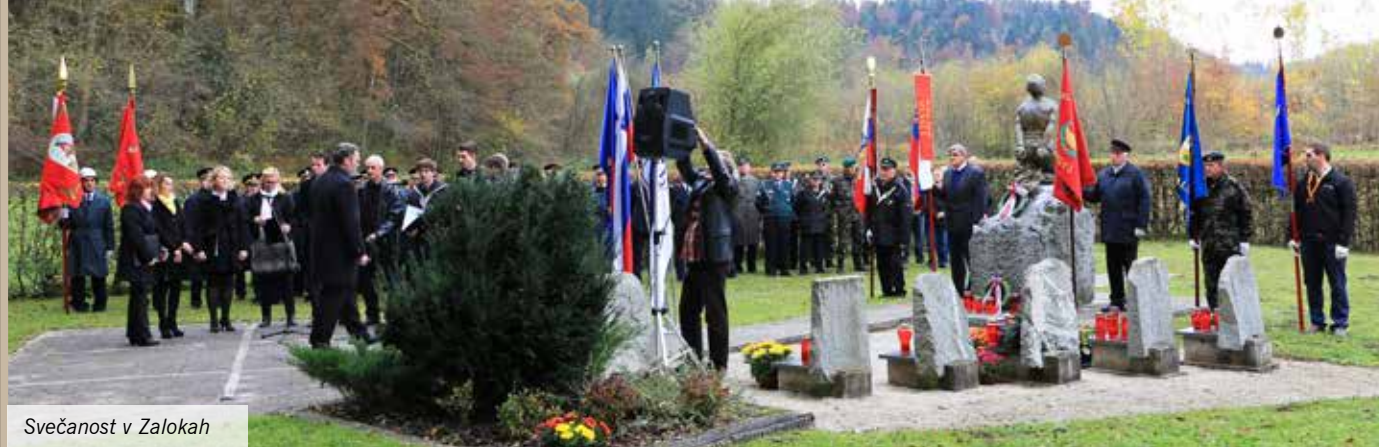
Svečanost v Zalokah