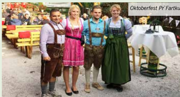
Oktoberfest Pr` Fartku