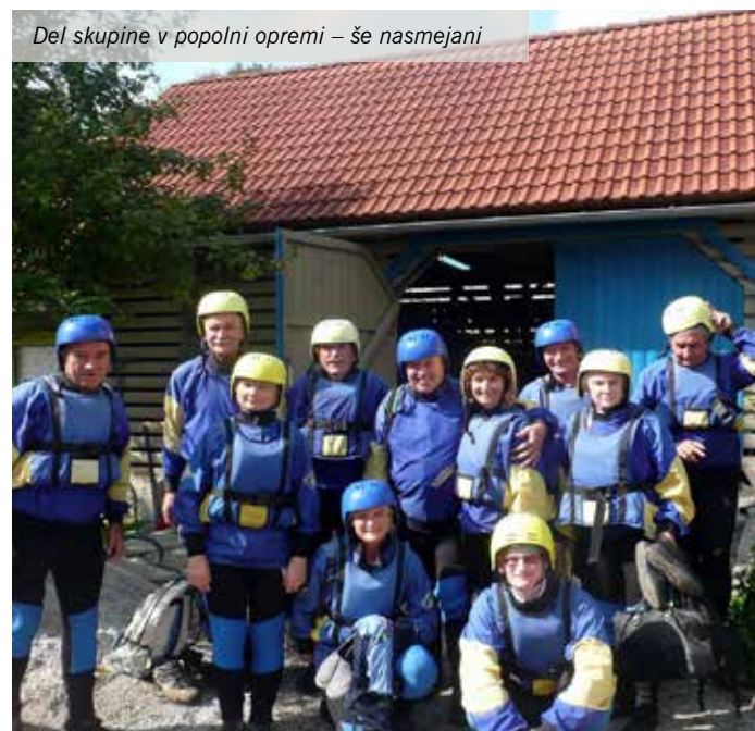
Del skupine v popolni opremljeni – še nasmejani