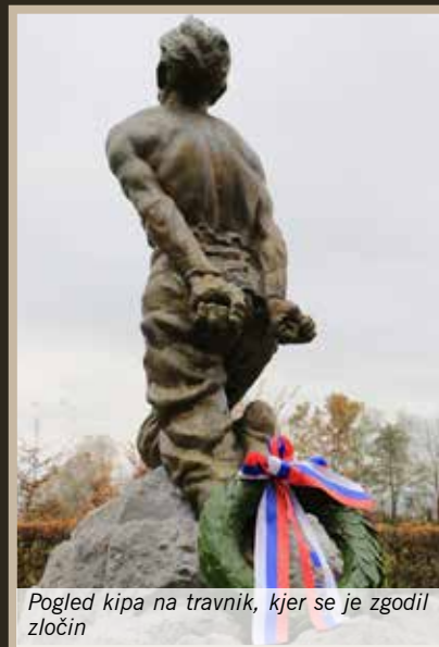
Pogled kipa na travnik, kjer se je zgodil zločin