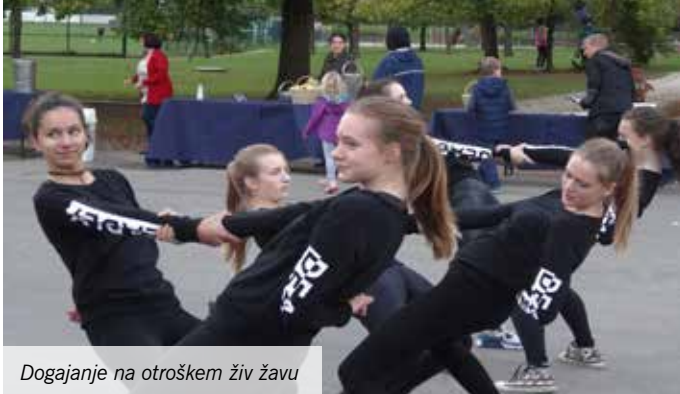
Dogajanje na otroškem živ žavu