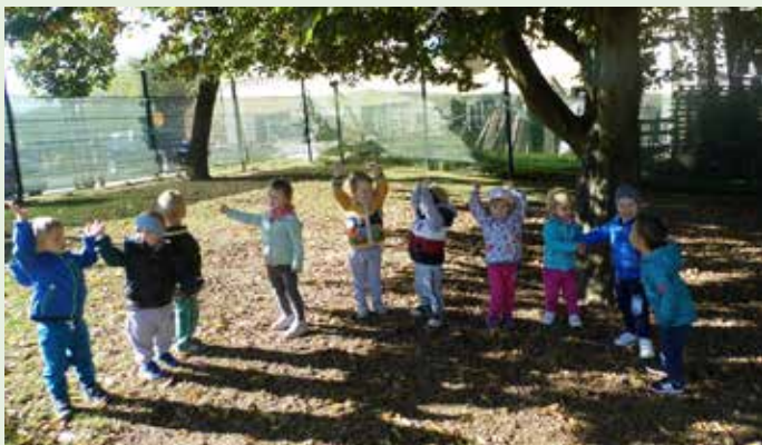
Ustvarjamo svet, ki bo boljši, bolj prijazen, bolj povezan

V tednu otroka, ki se je pričel s prvim ponedeljkom v mesecu oktobru, smo imeli v enoti Sonček še posebej obogaten program z različnimi dogodki in dejavnostmi. Otroci so se s konjsko vprego popeljali po Mengšu in tako doživeli izkušnjo, ki jo v današnjem času le redki otroci. Še posebej je bila naša hiša polna otroškega smeha in veselja, ko smo vzgojiteljice pripravile presenečenje za otroke – v avli jih je pričakal napihljiv grad, ki vse do zadnje možne minute ni sameval.