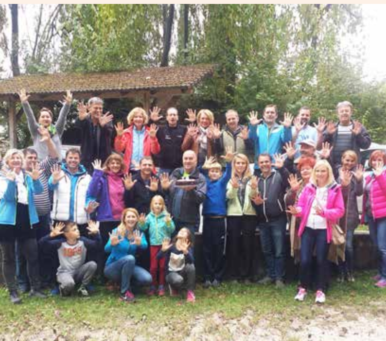
Naše vodilo in naši cilji so usmerjeni k kakovosti bivanja ter zadovoljstvu naših občanov in občank