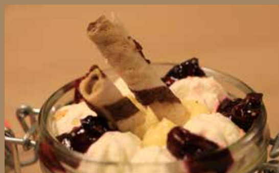
Sladica v lončku