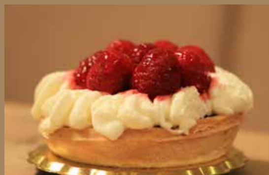
Veliko različnih sladici