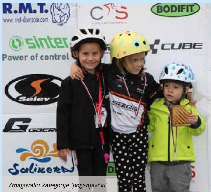
Zmagovalci kategorije 'poganjavčki'