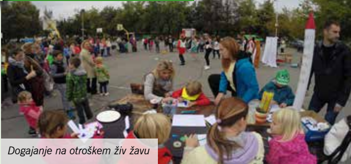
Dogajanje na otroškem živ žavu