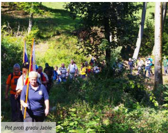
Pot proti gradu Jable