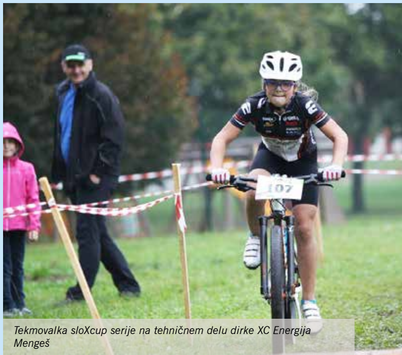
Tekmovalka sloXcup serije na tehničnem delu dirke XC Energija Mengeš

Besedilo: Tina Drolc