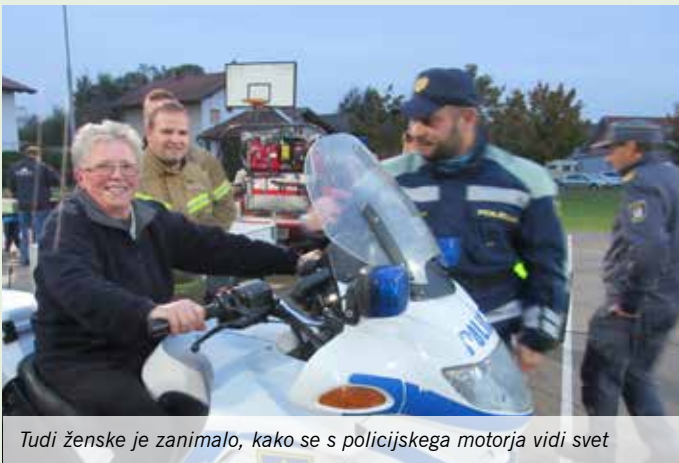
Tudi ženske je zanimalo, kako se s policijskega motorja vidi svet