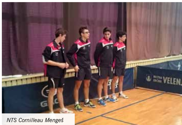
NTS Cornilleau Mengeš