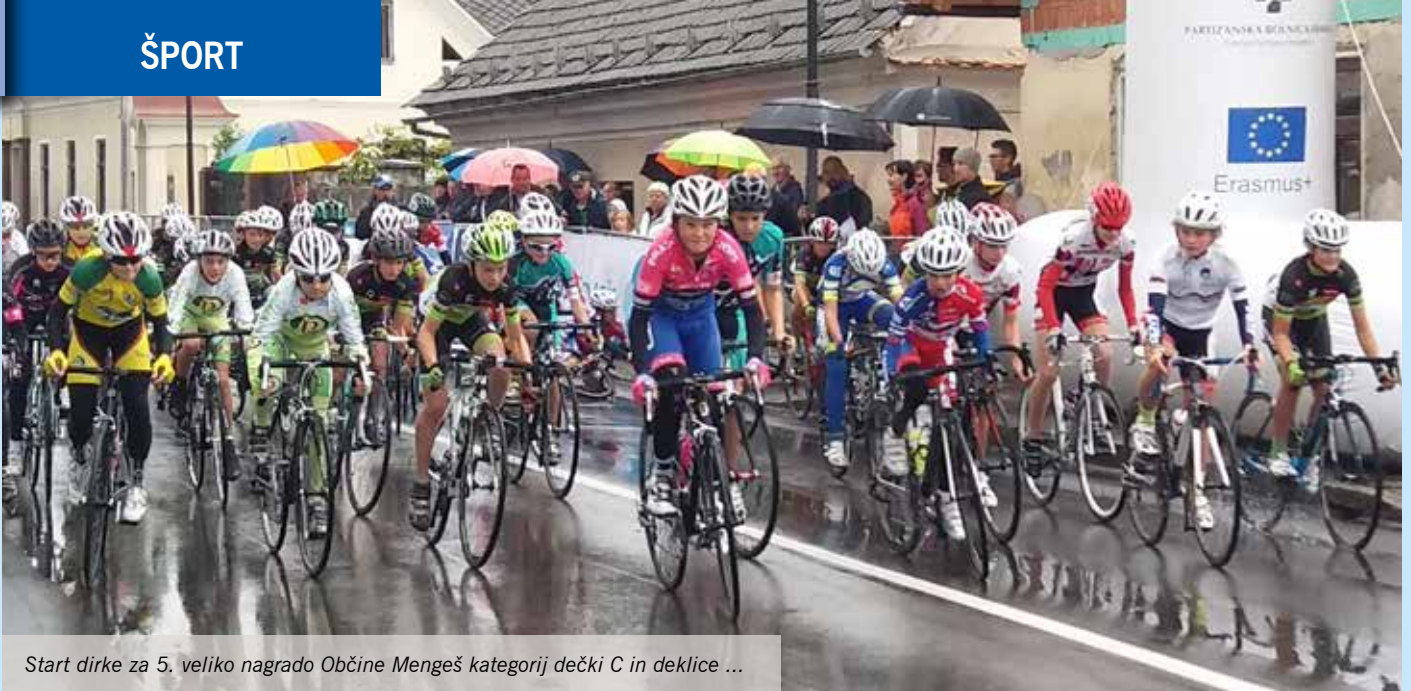
Start dirke za 5. veliko nagrado Občine Mengeš kategoriji dečki C in deklice ...