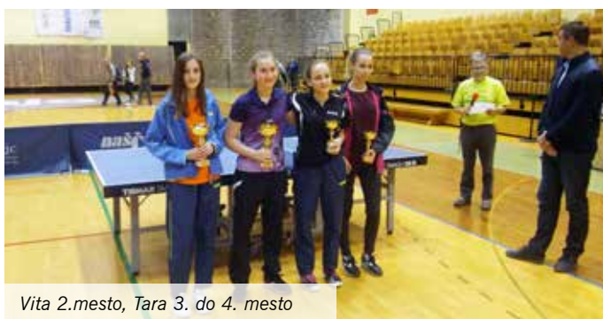
Vita 2. mesto, Tara 3. do 4. mesto