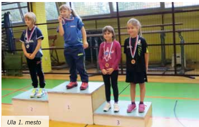
Ula 1. mesto

9. oktobra je bil v Cerknici drugi odprti turnir ljubljanske regije za učence in dijake v namiznem tenisu. Na turnirju je nastopilo 99 tekmovalcev in tekmovalk iz petnajstih klubov ljubljanske regije. Mengeš je zastopalo 23 tekmovalk in tekmovalcev, ki so bili tudi tokrat uspešni.