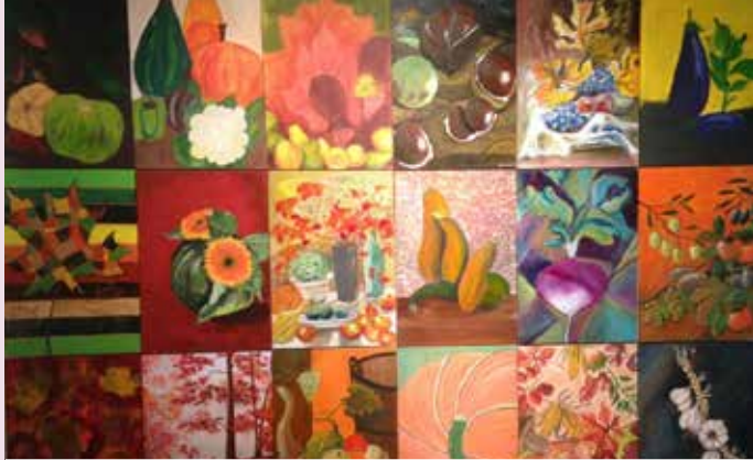
Vsak avtor je ustvaril eno ali več slik za sestavljanko oziroma kolaž slik