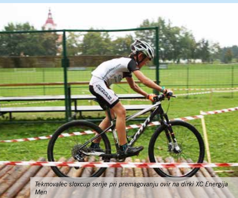
Tekmovalac sloxcup serije pri premagovanju ovir na dirki XC Energija Men

V nedeljo, 2. oktobra 2016, je v Športnem parku Mengeš potekala dirka v gorskem kolesarstvu serije sloXcup, mladi, XC Energija Mengeš. Dirke se jo je udeležilo 127 tekmovalcev, ki so sezono zaključili s prijetnim druženjem ter obljubo, da se prihodnjo sezono spet srečajo. Dirko je zaznamovalo deževno vreme, ki je v času dirke sicer prenehalo, proga pa je ostala blatna in spolzka. Na podelitvi je tekmovalke, tekmovalce, trenerje in vodje ekip skoraj presenetilo sonce.