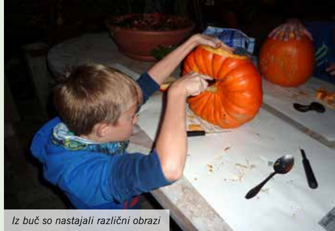
Iz buč so nastajali različni obrazi