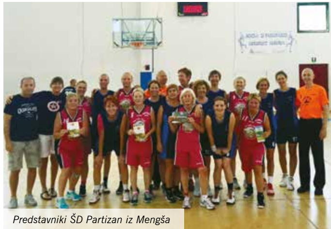
Predstavniki ŠD Partizan iz Mengša

Že deveto leto zapored smo se košarkarice iz ŠD Partizana Mengeš udeležile mednarodnega košarkarskega turnirja za veterane v Alassiu, obmorskem mestu na Ligurski obali.