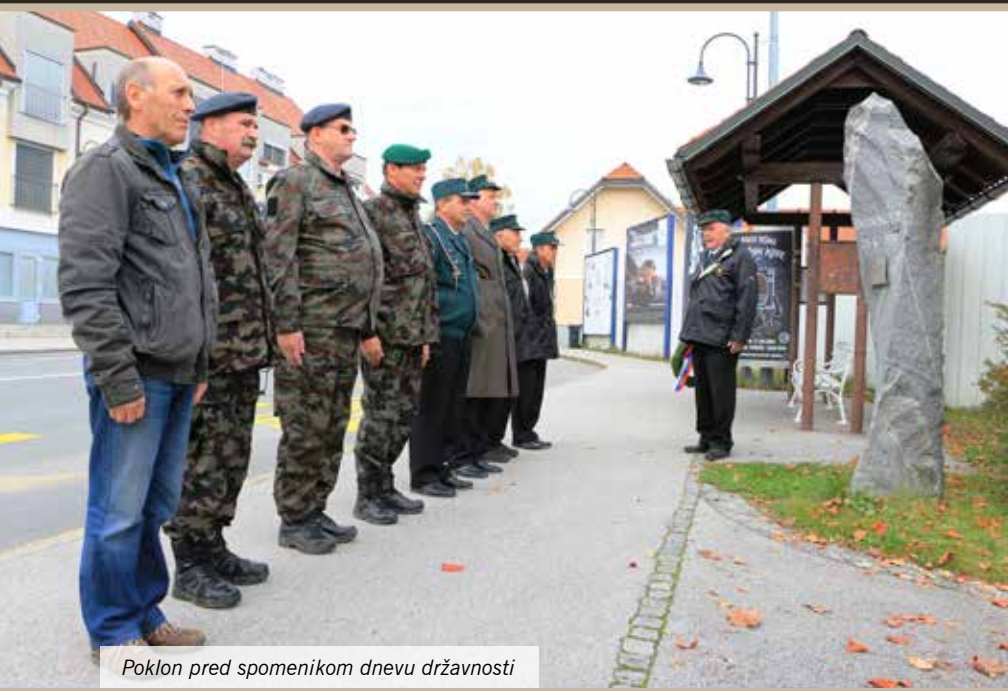
Poklon pred spomenikom dnevu državnosti