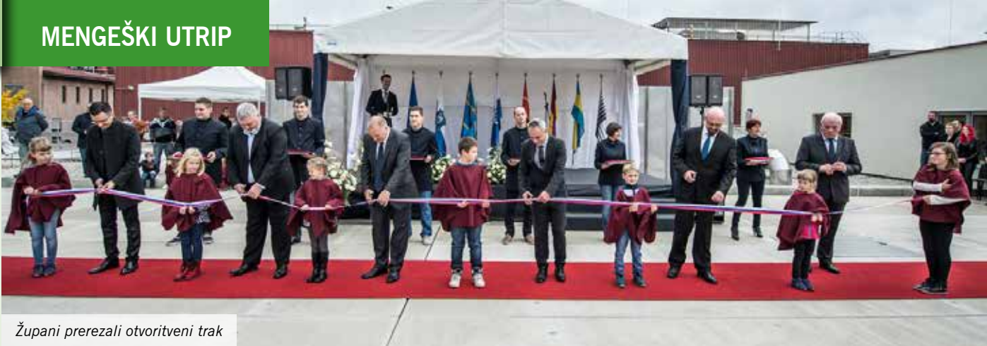
Župani prerezali otvoritveni trak