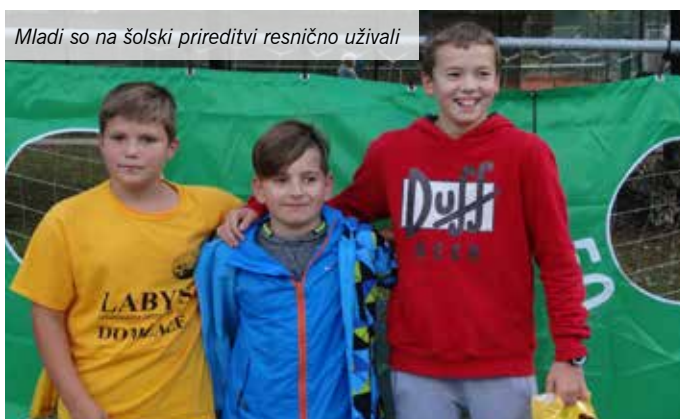
Mladi so na šolski prireditvi resnično uživali