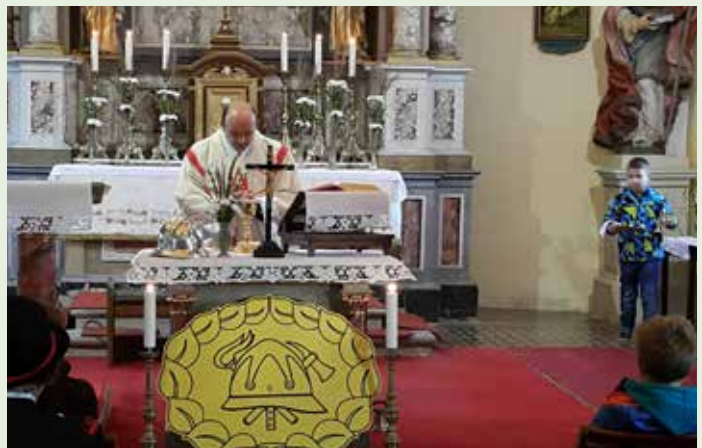
Sv. maša za pokojne gasilce je najlepši spomin na nekdanje sotovariše