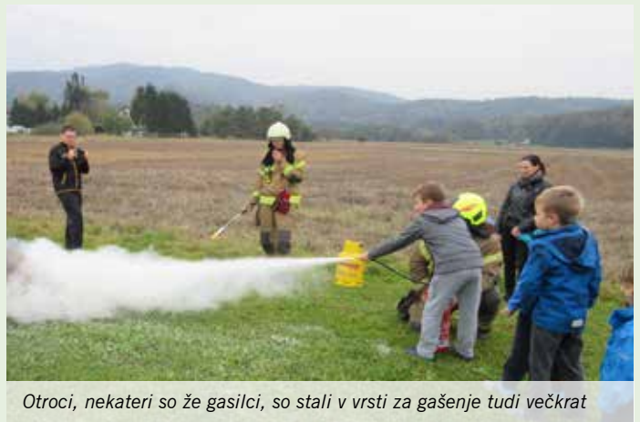
Otroci, nekateri so že gasilci, so stali v vrsti za gašenje tudi večkrat