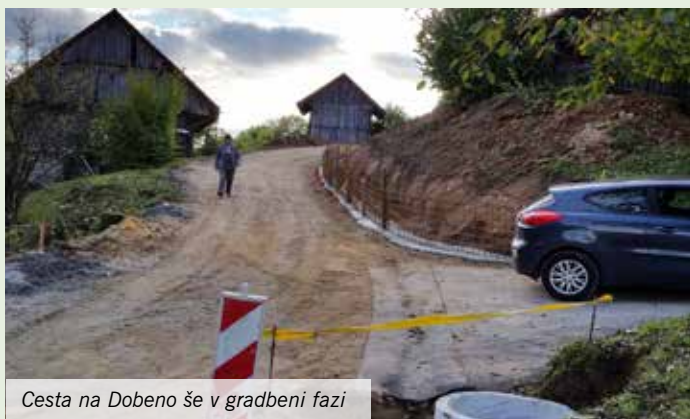
Cesta na Dobeno še v gradbeni fazi

Na osnovi soglasnega dogovora krajanov, da se Dobenu namenjeni del sredstev iz občinskega proračuna za leto 2016 nameni nadaljevanju rekonstrukcije najbolj zahtevnega dela ceste na Zgornje Dobeno, se je ta zaradi daljše postopkovne procedure na občini pričela precej kasneje, kot lani. Gorenjska gradbena družba, ki je bila izbrana, za izvedbo rekonstrukcije, je z deli pričela 3. oktobra 2016.