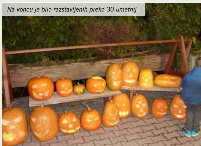
Na koncu je bilo razstavljenih preko 30 umetnij