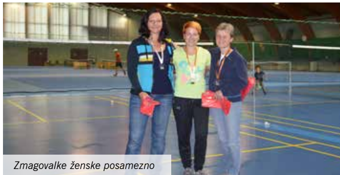
Zmagovalke ženske posamezno

Sezona badmintona je odprta in prve medalje so tudi že tu. V nedeljo, 16. oktobra, so se zanje borili na prvem turnirju Lige Komenda.