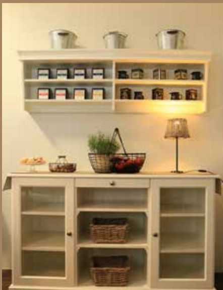
Prenova lokala je družinski projekt

Brez osebnega odnosa ne gre. Osemdeset odstotkov naših gostov hodi na kavo vsak dan, zato morajo zaposleni biti pri meni nekaj let in ne le dva meseca, da se razvije ugoden odnos med zaposlenimi in gosti.