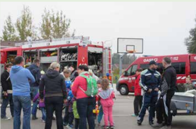
Odlična oprema in vrhunska usposobljenost loških gasilcev vnašata med vaščane zadovoljstvo in mir