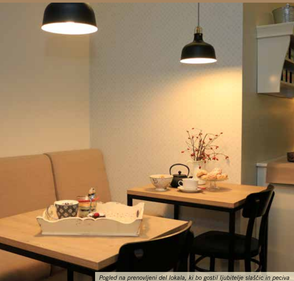
Pogled na prenovljeni del lokala, ki bo gostil ljubitelje slaščic in peciva