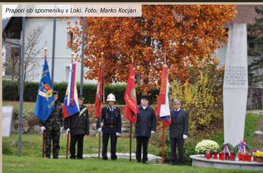
Prapori ob spomeniku v Loki.