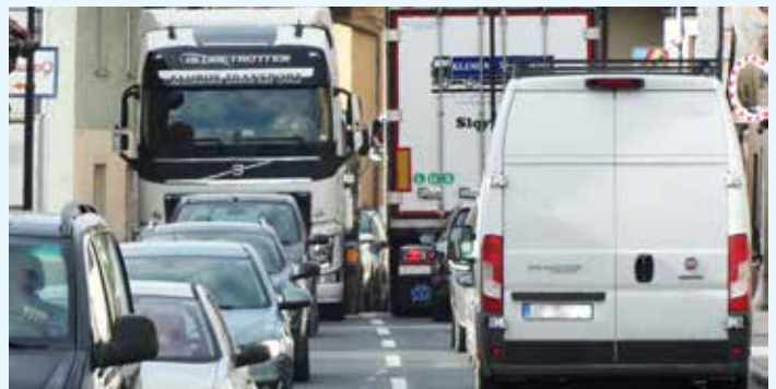
Prometni kaos na Prešernovi: absurdno, a resnično. Za ljudi pa ni prostora.

Je to zaključek črne gradnje? Bosta občina in država kar požrli klofuto?