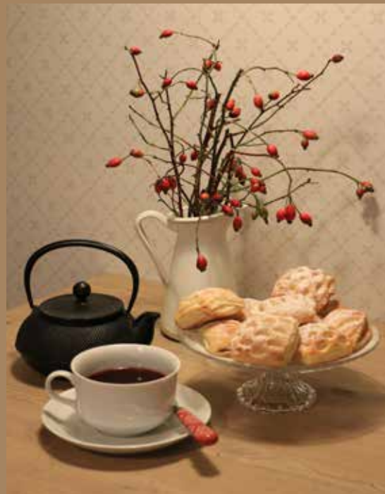
V ponudbi bo tudi pestra izbira priznanih čajev