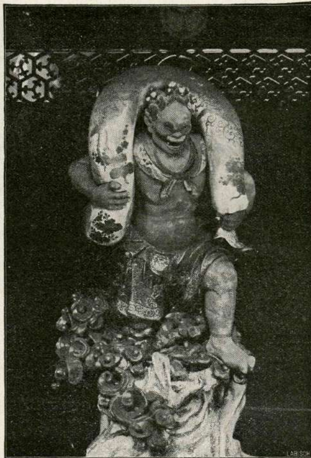
Bog vetrov pred Buddhovim templjem v Nikku.