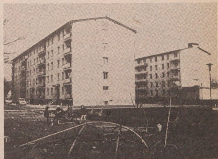
Stanovanje v naši občini, to je želja in življenjska potreba mnogih, zlasti še mladih družin. Cene so bile že doslej astronomske. Kako bo mogoče priti do stanovanj v prihodnje?