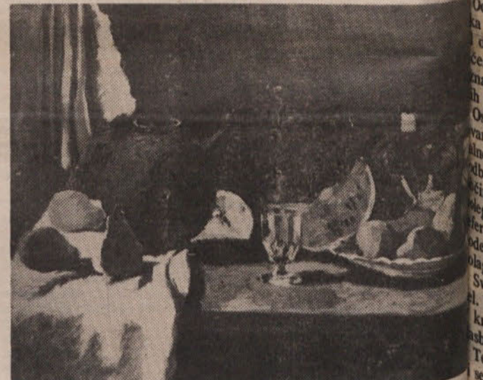
Kregar Stane, Tihožitje z vrčem, olje, 1939.

Slovenska barvna skala. Je ali je ni? Kregarjeve slike so derne, vedno so bile. Bile so nadrealistične, bile so lirično in bile so abstraktne in realistične, bile so pristopne in težje gledalca, a te slike so nam domače. Nekaj že mora biti v Kregarjevem slikarstvu tako našega, da moraš razmišljati na tak način.