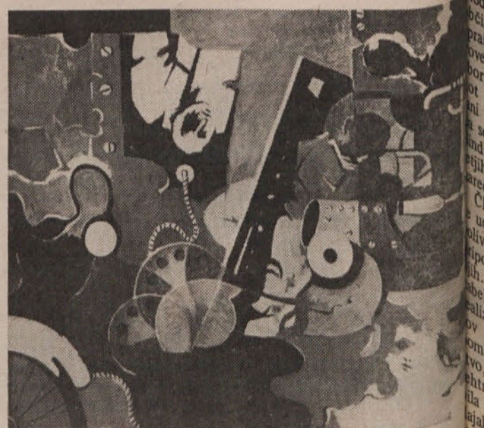
Kregar Stane, Mehanična delavnica, olje, 1968

„Svet pošlaja majhen, vseeno imajo ljudje po vsem svetu bleme – človeška radosti in težave ostajajo. Zanimivo je, da nimajo radi na slikah oseb.“