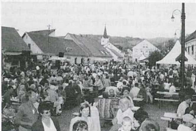
Na Ta malem plac se je trlo obiskovalcev