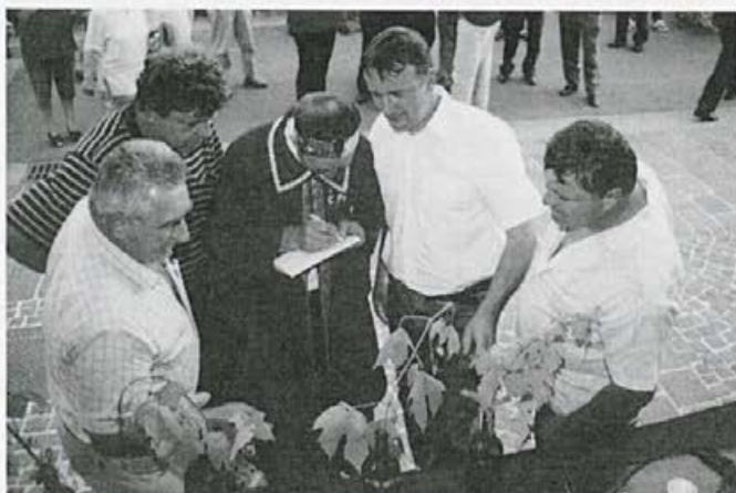
Vinogradniške igre, ekipa Kostanjevice na Krki