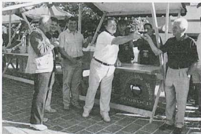
Stojnica vinogradniškega društva Podbočje