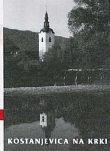
KOSTANJEVICA NA KRKI