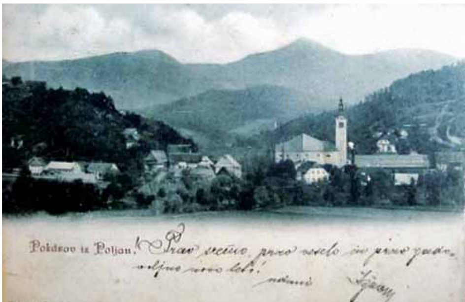
Poljane okoli leta 1900.