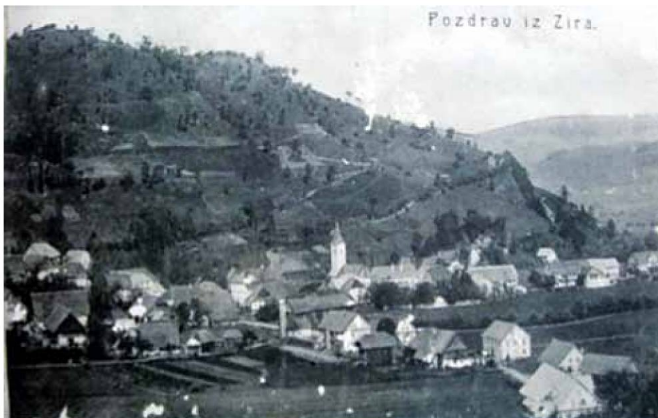
Žiri okoli leta 1900. (v privatni lasti)