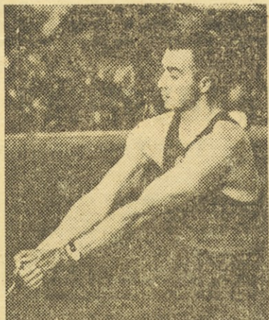
To je mož, ki se bolj in bolj bliža daljini 70 metrov: svetovni rekord v metu kladiva, ruski atlet Mihail Krivososov

Italijanski metalec krogle Meconi je dosegel v Formiji nov italijanski rekord z odličnim rezultatom 17,12.