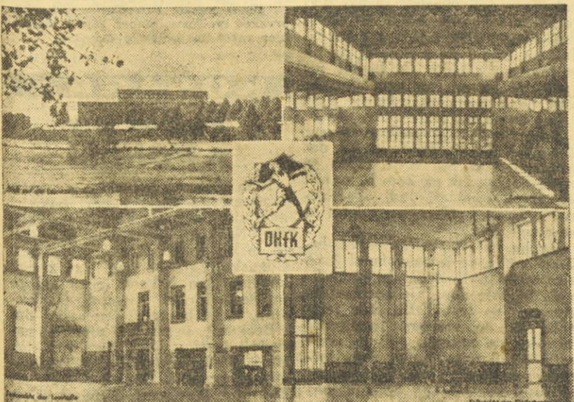
Visoka šola za telesno vzgojo v Lipskem je ena največjih tovrstnih ustanov v Evropi. Zgoraj vidite del glavnega poslopja (levo) in dvorano za atletiko (desno), spodaj pa glavno telovadnico (levo) in dvorano za telovadbo otroških oddelkov (desno). V sredini je znak te šole s črkami DHFK (Deutsche Hochschule für Körperkultur)

Iz navedenih podatkov je razvidno, da so v tem delu Evrope že v teh kratkih povojnih letih zelo veliko storili za dvig telesne vzgoje in želeli je, da poizkušamo iz teh skušenj izluščiti kaj poučnega tudi za naše pričetno delo. Tudi mi črpano znanje iz naprednih tradicij naše telesnovzgojne preteklosti, iz izkušenj desetih povojnih let, iz pridobitev osvobodilnega boja, nekoliko premalo pa iz mednarodnih izkušenj na tem polju. Nismo pa seveda za slepo kopiranje tujih metod, kajti naša zemlja in naše ljudstvo diha in živi po svoje.