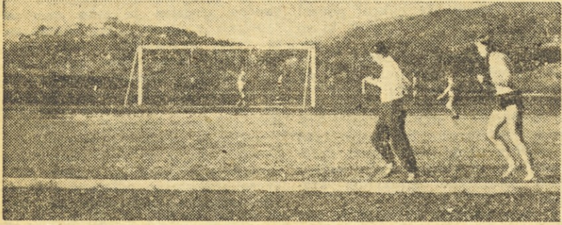
Pogled na velenjski stadion

Kot mnogi naši klubovi, je tudi velenjski Rudar zaradi relativno hitrega vzpona svojega prvega moštva posvečal vso pozornost le njemu, zanemarjal pa je mladino. Vendar pa je klubska uprava letos temeljito spremenila svoj odnos do naraščajočih in ji je uspelo dvigniti število aktivnih nogometašev na preko 70, od tega nad 40 pionirjev. Star — vendar že preživljeni odnos Rudarjevega odbora do mladine — je vzpodbudil nekatere krajevne faktorje k reorganizaciji nogometa in telesne vzgoje sploh. Z delom