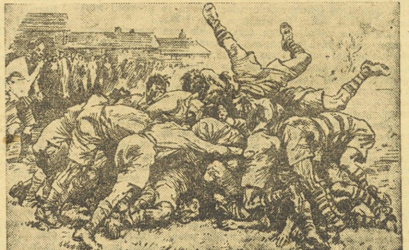
»Fantje, prenehajte vendar, saj je bila tekma končana že pred tremi minutami!...«

OPOMBA: 1.—4. I. conska nogometna liga, 5.—7. varaždinsko-mariborska nogometna liga, 8.—12. ljubljansko-primorska liga.