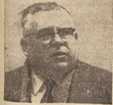
Ob 60-letnici življenja in 40-letnici šolnikovanja me zanima, kako gledaš danes na pedagoško delo in na svojo prehojeno pot med obema vojnama?

Obiskal sem jubilarja na njegovem domu v Mariboru z namenom, da mu zastavim v zvezi z njegovim delom nekoliko vprašanj in posredujem naši pedagoški in prosvetni javnosti — namesto običajnega jubilejnega članka — nekatere njegove misli.