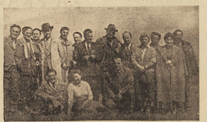
Udeleženci seminarja za prosvetne svetovalce na Polževem

Udeleženci seminarja so v Šentvidu pri Ljubljani imeli posvetovanje s predstavnikmi občine,