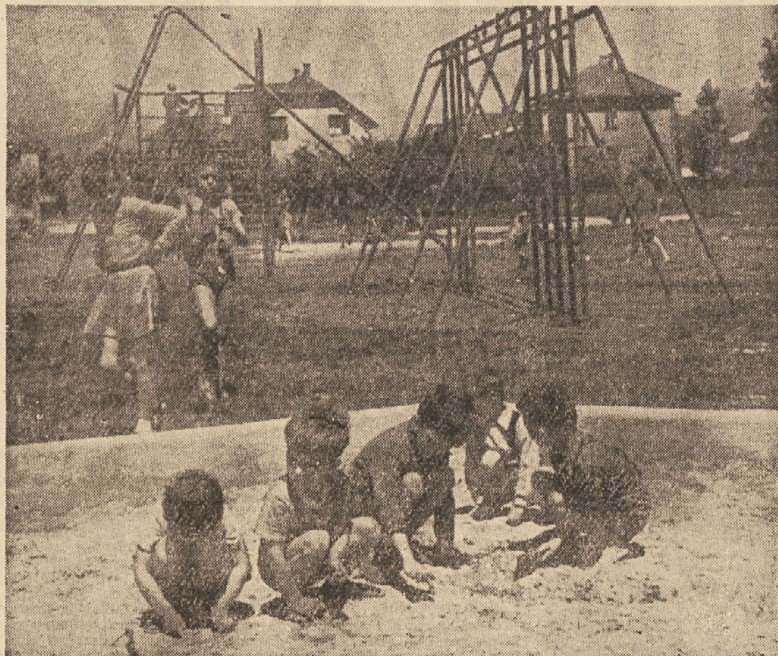
Otroška igrišča — kraj prijetne zabave za najmlajše