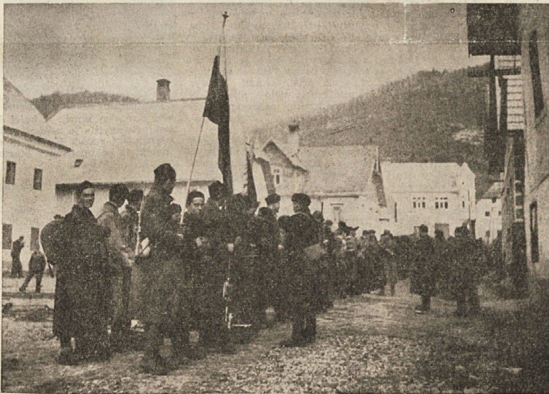
Brigada NOV Slovenije v Koprivniku na Kočevskem