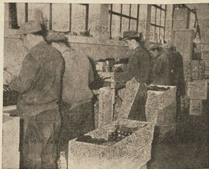
Predelava lesa v Sodražici

pustila značilen pečat. To »samostojnost« je spremljalo neprestano negodovanje o pomanj-