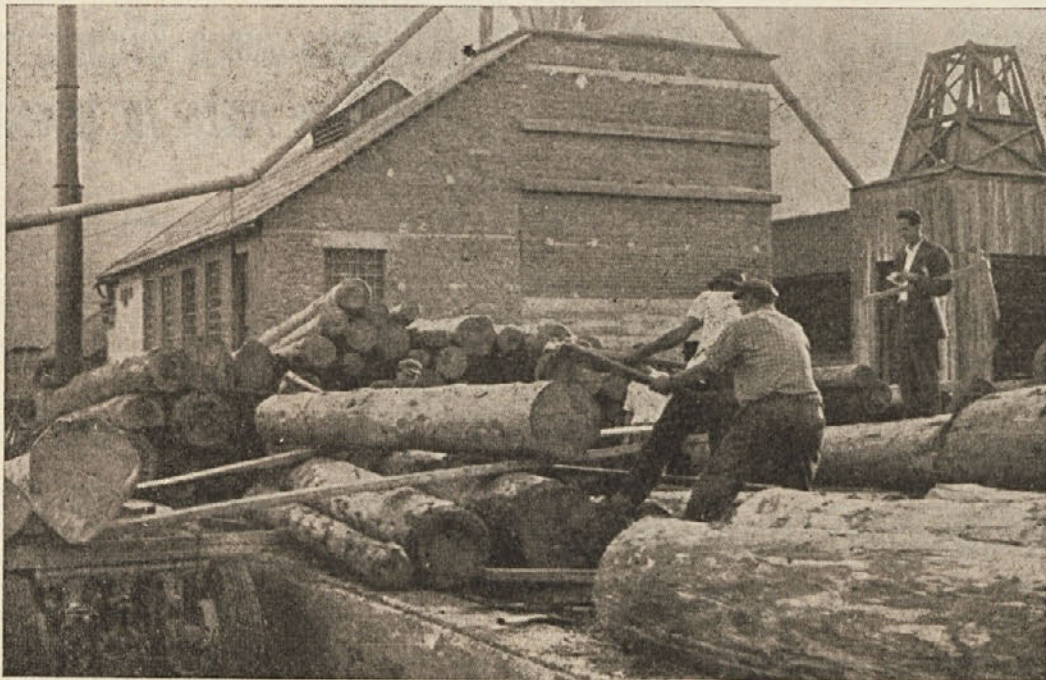
Na skladišču lesne industrije v Kočevju

no podjetje, bo mogoče marsikaj storiti za modernizacijo tega ali onega obrata, kar je bilo sedaj otežkočeno. Nov lesni kombinat bo ustvaril letno za okrog 2 milijardi 500 milijonov din vrednosti bruto proizvodnje. To pa za naše razmere že precej pomeni.