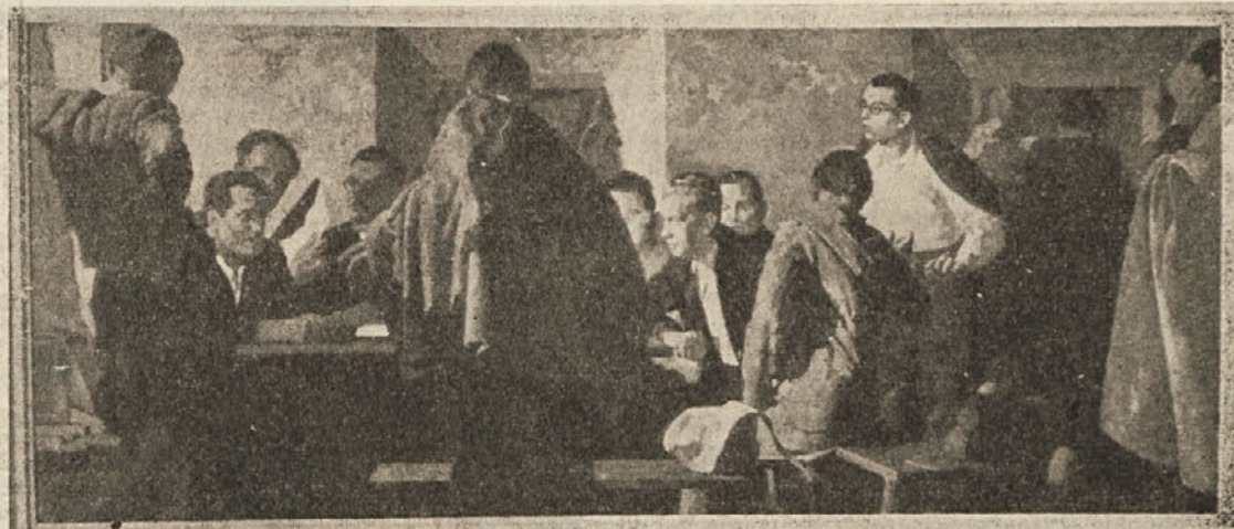
Ustanovni kongres KPS na Čebinovem pri Zagorju ob Savi l. 1937

Komisija je v svojem poročilu podrobno analizirala delo večjih delovnih kolektivov občine Kočevje, kar so v razpravi še dopolnili. Problemi produktivnosti in modernizacija proizvodnje ter gospodarjenje so v posameznih gospodarskih organizacijah različno obravnavali, kakor so se v to poglobile sindikalne organizacije. Čeprav je analiza gospodarskih organizacij, ki jo je pripravila komisija, precej obširna, še vedno ni mogla zajeti vseh problemov, ki po delovnih kolektivih obstojajo. Ta pregled