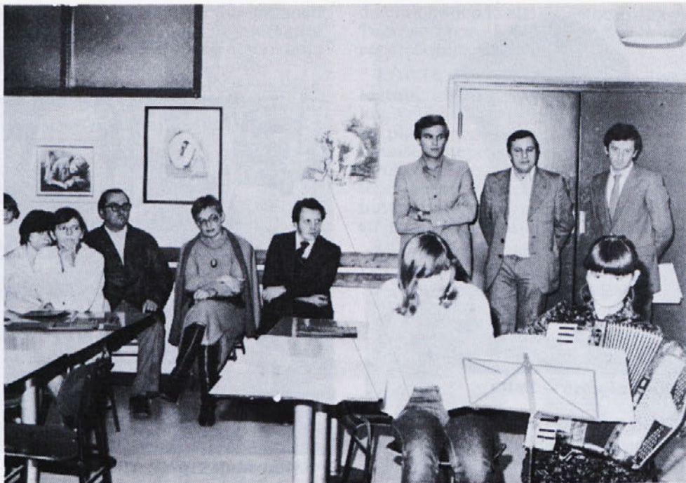
Posnetek je star deset let. Nastal je na otvoritvi našega 1. ex-tempora, letos pa poteka že jubilejna prireditev — 10. po vrsti. Zaključek te bo 22. oktobra, ko bo tudi otvoritev razstave letošnjih najboljših del.

Da ne bom ostala le na ravni čustvenega upora proti maličenju našega jezika, naj spodbudim vse, ki govorno besedo prenesejo na papir, posebno še tiste, ki jim je to primarno delo in je njihov izdelek hkrati tudi predstavitev Laboda v javnosti, da posvetijo več pozornosti na oblikovanje dopisov, predvsem pravopisu, oblikoslovju, besedotvorju in slogu.