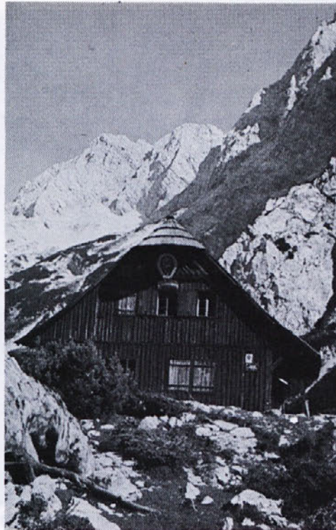
Letos je prišlo na uredništvo precej planinskih pozdravov. Ta je s Češke koče nad Jezerskim.

Pri tej neprijetnosti pa ima svoje tudi »sindikalni« denar. Ponekod je šel za izlet, drugod za piknik. Pri denarju se pa vse neha, kot pravi stara modrost, in kar vse bolj velja. Toda čim je bila odločitev za piknik potrjena, bi morali udeležbo spodbuditi in jo v čim večjem številu tudi omogočiti.