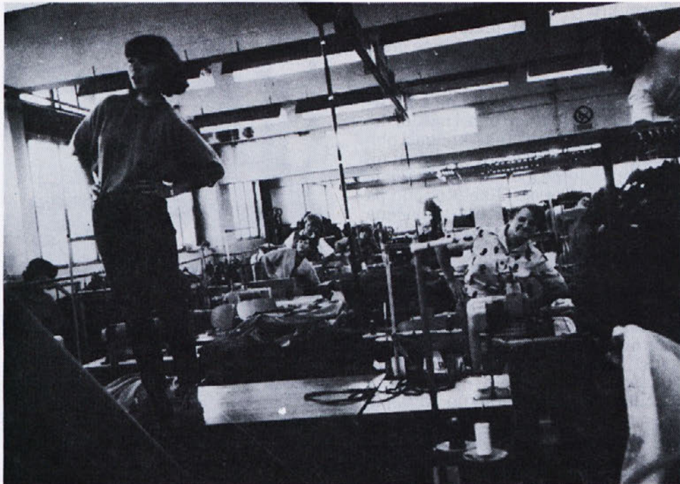
Po dopustih je rekreacija v tozdih ponovno zaživela. Posnetek je sicer od pomladi, nastal pa je v Temenici, gotovo pa ni nič manj veselo, zabavno in koristno tudi v tem jesenskem času...

Odgovori anketiranih delavcev kažejo na velik pomen, ki ga pri svojem obveščanju pripisujejo zboru delavcev. Domnevamo, da je to posledica bolj ali manj celovitih informacij o delu in gospodarjenju ter načrtovanju ob sprejemanju zaključnih računov in periodičnih obračunov, dodatnih informacij, razprave na zborih, ustne komunikacije, ki poteka na zborih ter večje pozornosti navzočih. Vendar pa s pripravo oziroma izpeljavo zborov delavci niso zadovoljni: informacije na (za) zboru delavcev so jim premalo razumljive, zanimive in resnične, njihova dolžina ni povsem ustrezna. Udeležba na zborih ni najboljše. Delavci, ki delajo na terenu, in delavci, ki