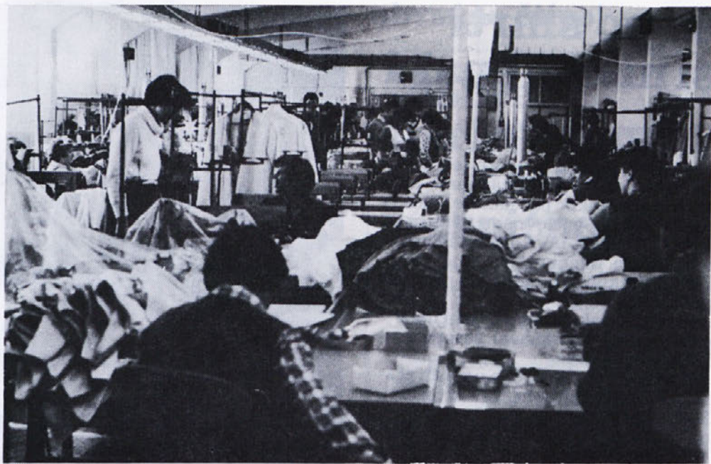
V proizvodnji Tip-topa.