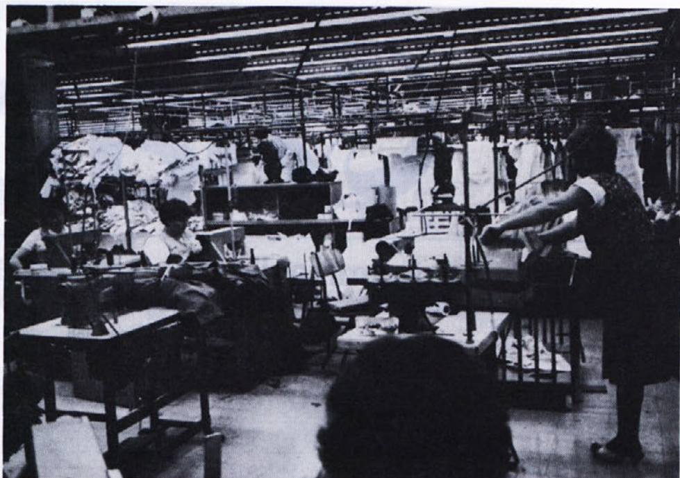
V Delti, našem največjem tozdu.

Od vseh zgoraj navedenih podatkov ima Jugoslavija še to prednost, da ima fleksibilno tehnologijo.