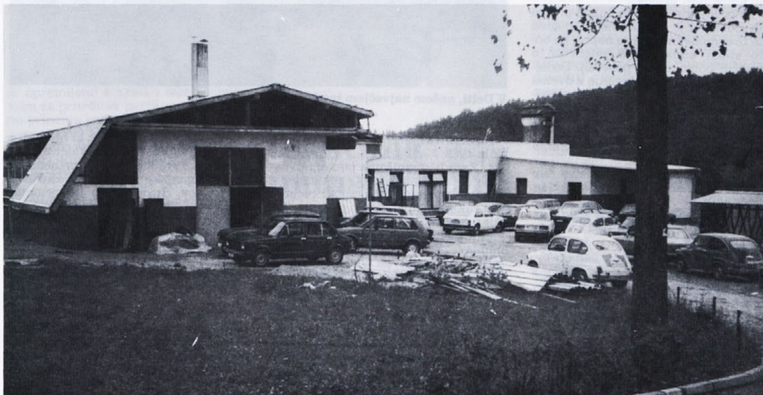
Delo je končano — posnetek pa je le še spomin na sanacijo streh v Temenici.