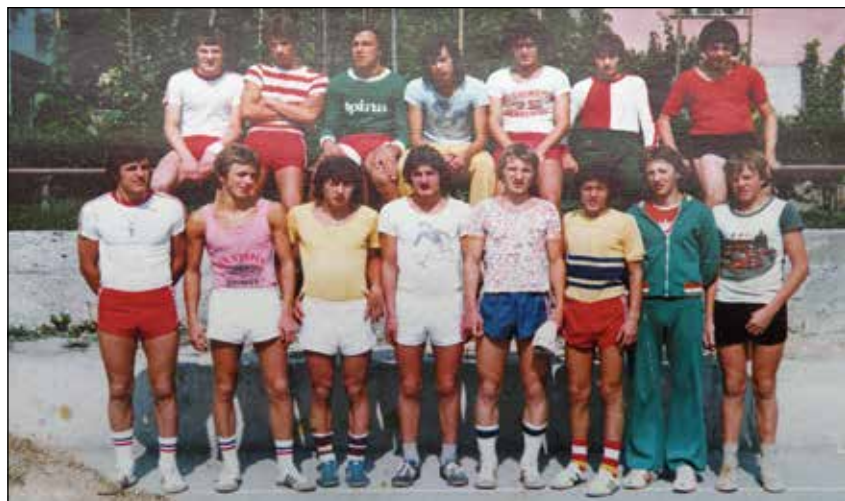
Tem mladim fantom ni bilo dano, da bi se izkazali.

vkluči v tekmovanja Gorenjske rokometne lige tudi ekipo B in C. Moška članska ekipa je bila to leto po mnenju strokovnjakov ena najperspektivnejših v Sloveniji. Ekipi B in C sta v Gorenjski rokometni ligi igrali le to leto, saj so prav v tej sezoni v Portorožu sprejeli t. i. Portoroške sklepe, ki so po regijah določili centre za posamezne igre, obenem uvedli nove tekmovalne sisteme in na tak način v Selški dolini praktično uničili moški roket.