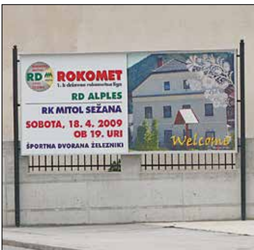
Oglaševanje nekoč in danes.