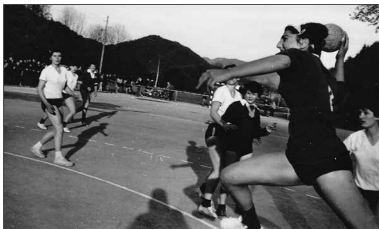
Prizor s tekme Selca : Spartak iz Subotice.