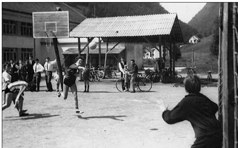
Rokometna tekma deklet na igrišču iz leša, ki je bilo na prostoru današnje šolske telovadnice.