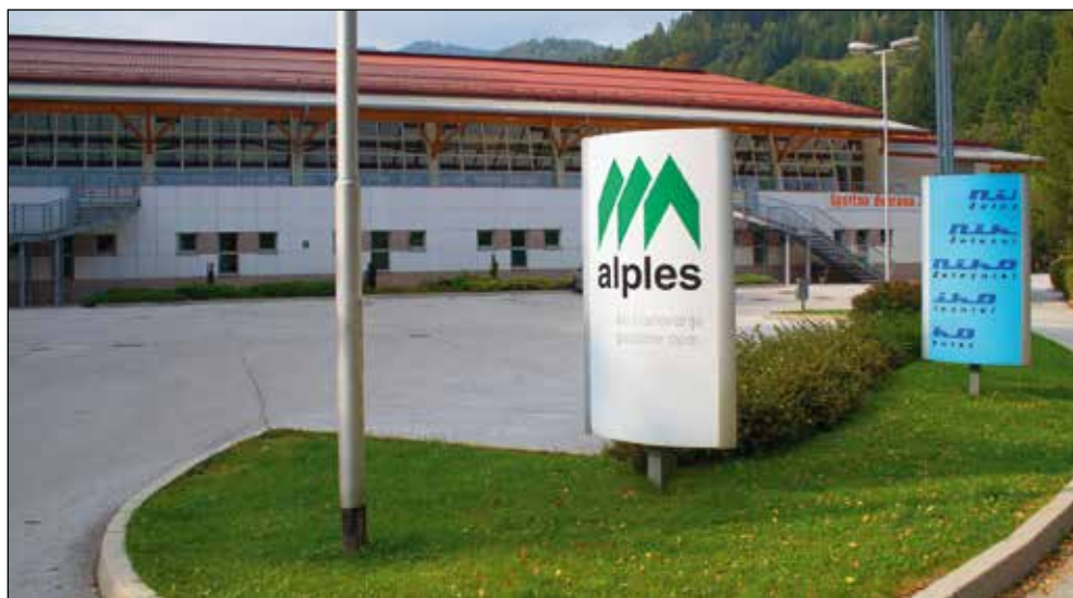
Končno je tudi v Železnikih zgrajena športna dvorana.

Z nastankom samostojne občine Železniki je misel na izgradnjo športne dvorane ponovno oživel, saj je osnovnošolskim otrokom primanjkovalo telovadnih površin, napredka v mnogih tekmovalnih športih v občini pa si brez ustreznih prostorskih pogojev tudi ni dalo zamisliti. Prav tako se je kazala potreba po večnamenskem prostoru, ki bi lahko sprejel do tisoč obiskovalcev.