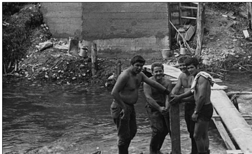
Fantje in možje udarniško gradijo most čez reko Soro proti igrišču na Rovnu.

S tekmovanji v republiški ligi je ekipa pridobila nove izkušnje. Vsako leto so se udeležile tudi najmnožičnejšega tekmovanja v takratni Socialistični