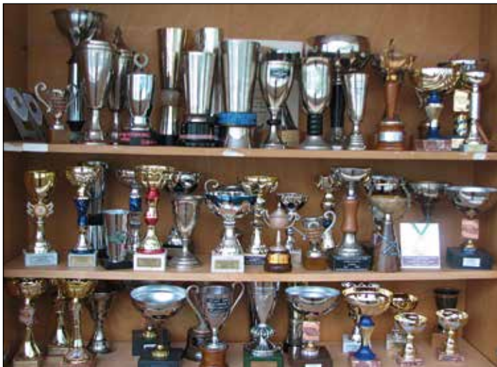
Rokometnih pokalov je v vitrini šole več kot pokalov vseh drugih športov skupaj.

V Železnikih na področju Dašnice za potrebe