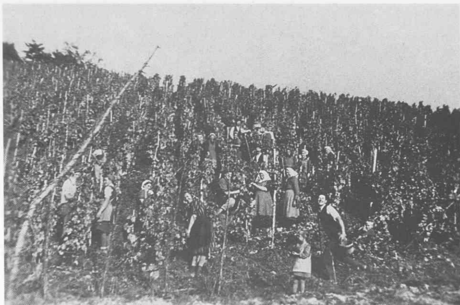
Trgatev v Svečini med vojnama. Originala hranijo Šerbinekovi na Plaču. ♦ Grape harvest in Svečina in the inter-war period. Both original photographs are kept by the Šerbineks from Plač. ♦ Les vendanges à Svečina entre les deux guerres. Les originaux se trouvent chez les Šerbinek à Plač.