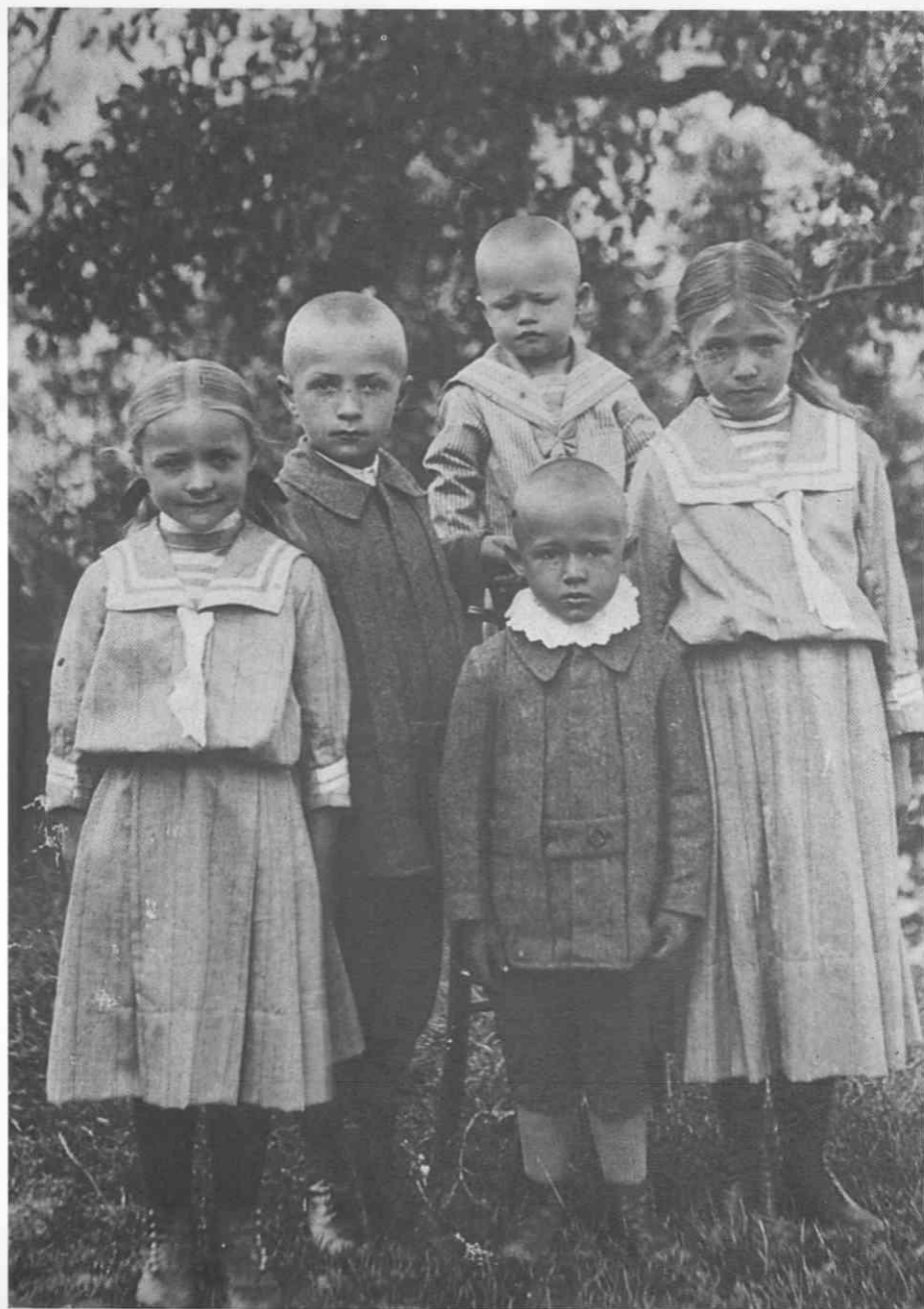
Svečinski kmečki otroci po 1. svetovni vojni. Original hranijo Krenovi na Plaču 12. ♦ Peasant children from Svečina after the First World War. The original photograph is kept by the Krens from 12 Plač. ♦ Les enfants de Svečina après la 1ère guerre mondiale. L'original est conservé chez les Kren à Plač.