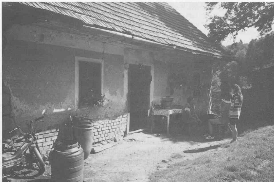
Nekdanja kmečka viničarija v Svečini. Svečina, junij 1995. ♦ Former farmer-owned vineyard cottage in Svečina. Svečina, June 1995. ♦ L'ancienne maison de vigneron à Svečina. Svečina, juin 1995.