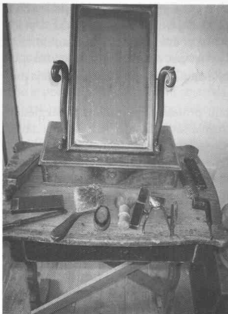
Brivska mizica s priborom iz ene od svečinskih viničarij, sedaj na ogled v vinogradniško-etnološki zbirki na Kopicu na Plaču. Foto: Mojca Ramšak, julij 1996. ♦ Table with shaving gear from one of Svečina's vineyard cottages, now exhibited in the viticulture ethnological collection in Kopica, Plač. Photograph: Mojca Ramšak, June 1996. ♦ Tablette de barbier avec ses accessoires trouvée dans une des maisonnettes de vigneron á Svečina. C'est partie de la collection ethnographique consacrée á la viticulture de Kopica sur Plač. Photo faite par Mojca Ramšak, juillet 1996.