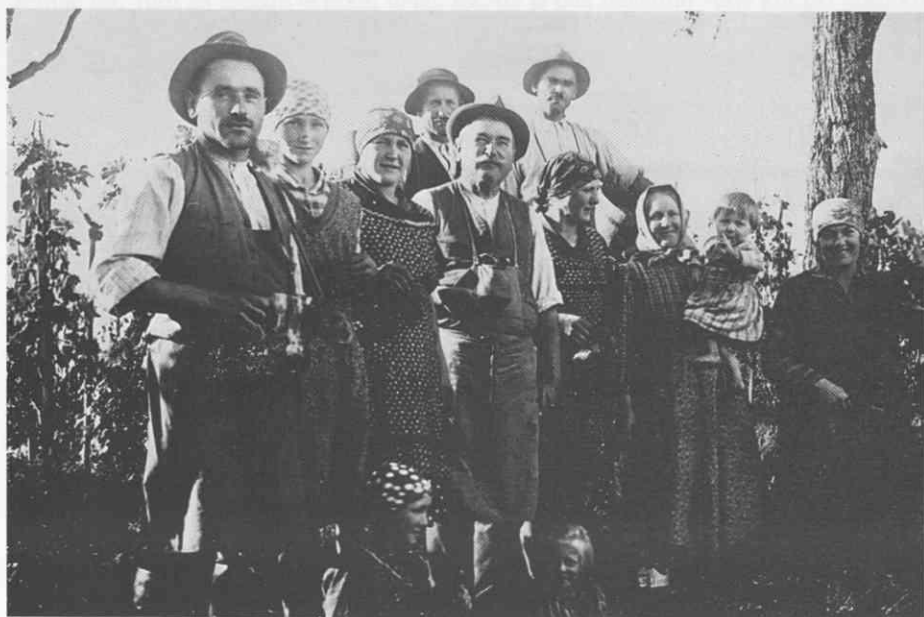
Trgatev pri Šerbinekih leta 1936. Original hranijo Šerbinekovi na Plaču. ♦ Grape harvest of the Šerbineks in 1936. The original photograph is kept by the Šerbineks from Plač. ♦ Les vendanges chez les Šerbinek en 1936. Les originaux se trouvent chez les Šerbinek à Plač.

ostajale doma in skrbele zanje, če že niso imele kake starejše sorodnice. Nekateri kmetje so dopustili, da je bila viničarjeva žena doma in delala v gospodinjstvu, drugod so morale na 'tabrh' ženske tudi v času nosečnosti in kasneje, ko so dojile. Sploh ni bilo redko, da so ženske rodile na polju, čez nekaj dni pa so zopet opravljale vsa dela. Majhne otroke so v teh primerih pazili bodisi starejši sorodniki ali pa otroci. Otroke so hitro navadili na delo: tri- ali štiriletniki so že npr. pasli svinje. Kmalu so se priključili staršem z manjšimi lažjimi deli, npr. pletev in podobno. Šoloobvezni otroci so zaradi dela mnogokrat izostajali od pouka. Izostanki so bili pogostejši pri fantih, ki šole niso preveč marali, pa tudi pri delu so bili koristnejši. Deklice so ponavadi rade šle v šolo, vendar so morale ostati doma in delati, če je tako zahteval gospodar. Mnogi viničarski otroci so ob prenehanju šolanja imeli opravljena le dva razreda, kljub temu, da so v šolo hodili več let. S šolo so po določenem času morali opraviti.