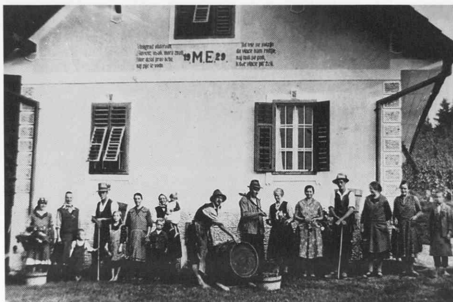
Trgatev pri Elšnikih leta 1936. Fotografija iz vinogradniško - etnološke zbirke na Kopici. ♦ Grape harvest of the Elšniks in 1936. Photograph from the viticulture ethnological collection in Kopica ♦ Les vendanges chez les Elšnik en 1936. La photo fait partie de la collection ethnologique de viticulture à Kopica.

kmetov, 24 viničarjev, od teh jih je 18 delalo za kmete, 1 na cerkvenem in 5 na državnem posestvu oziroma vinogradu.