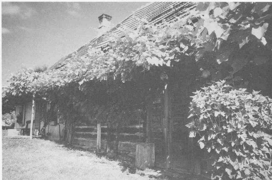
Nekdanja cerkvena viničarija brez kleti. Plač, junij 1995. ♦ Former church-owned vineyard cottage without wine cellar. Plač, June 1995. ♦ L'ancienne maison de vigneron d'Eglise, sans cave. Plač, juin 1995.