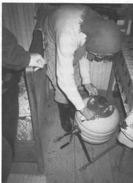
Nekdanja viničarka s Plača pere v ročnem pralnem stroju. Foto: Vesna Nikšič, junij 1995. ♦ Former vineyard labourer's wife from Plač washing with manual washing machine. Photograph: Vesna Nikšič, June 1995. ♦ Vigneronne d'antan lavant du linge á l'aide d'un lave-linge manuel. Photo faite par Vesna Nikšič, juin 1995.

V času menstruacije so ženske uporabljale tako imenovane 'pinte', bombažne krpe s štirimi trakovi, ki so jih zavezale za drug trak za pasom. V tridesetih letih so nekatere Svečinkanke začele uporabljati spodnje perilo, za viničarke pa so spodnje hlače pomenile pravo razkošje. Splošnejša uporaba spodnjega perila je postala običajna šele v štiridesetih letih.